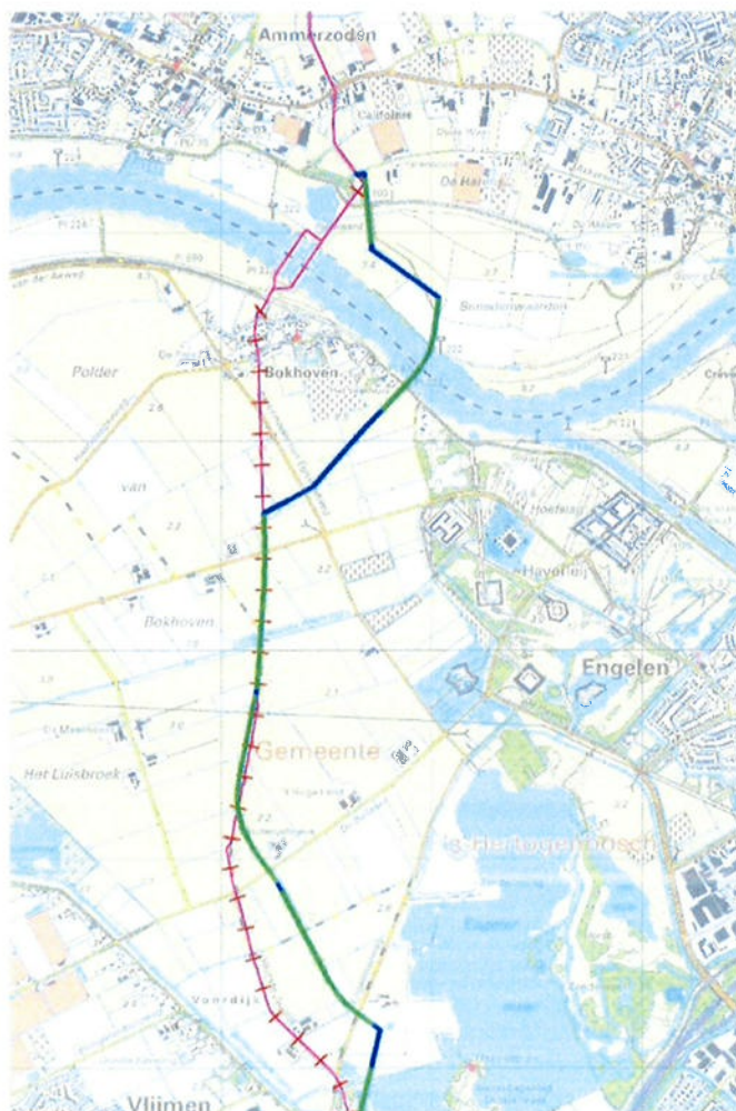
Afb. 1. Ligging nieuwe tracé (groen-blauw), bestaande tracé (roze)