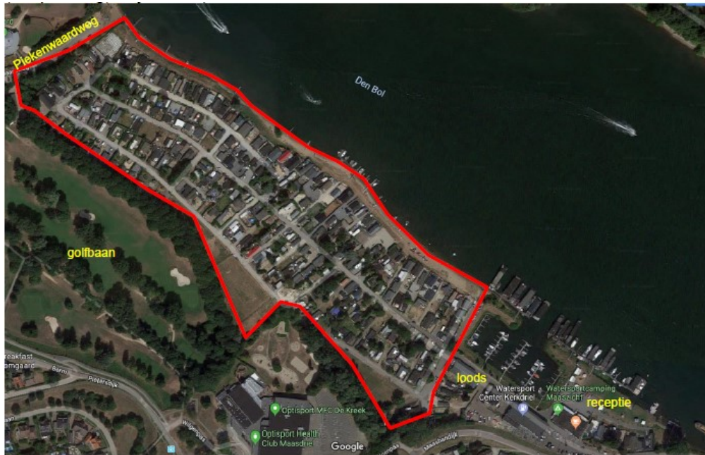
Figuur 1. De ligging van het plangebied (rood begrensd) met enkele toponiemen.