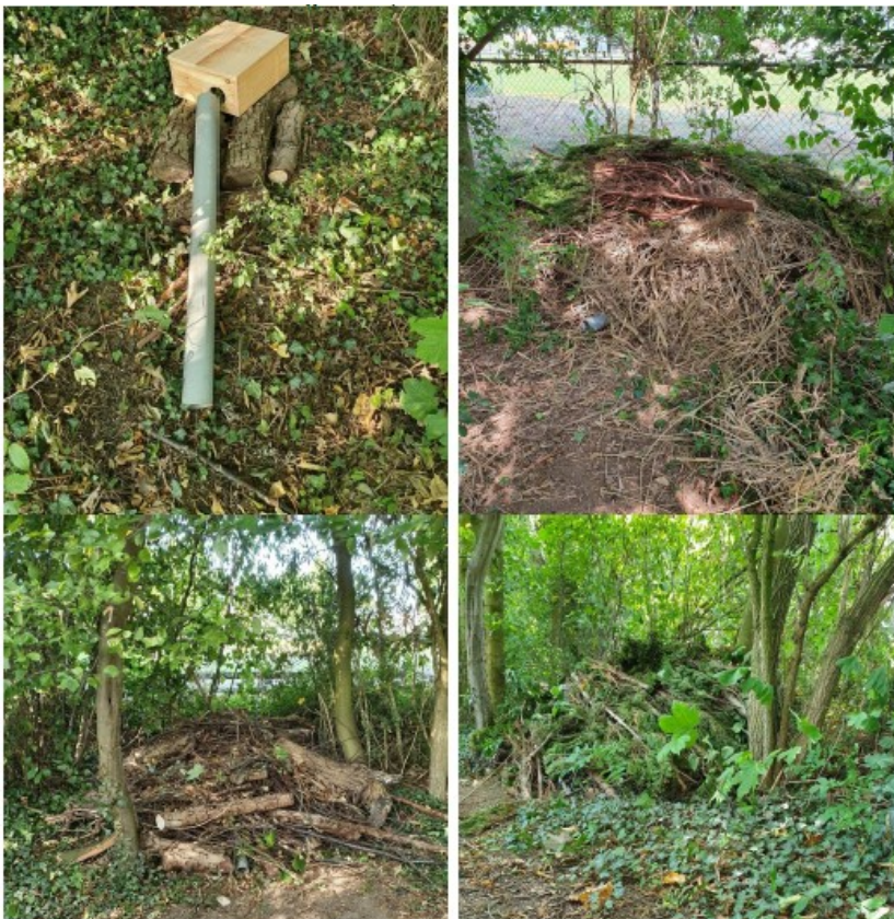
Figuur 8. Weergave marterkasten bedekt met takkenrillen aan de buitenzijde plangebied.