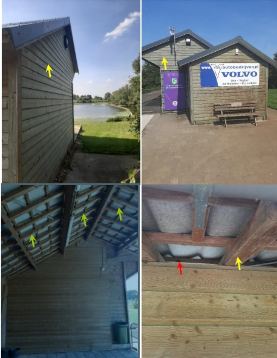
Figuur 6. Boven locatie van de plaatsing gevelbetimmering. De vloermuiskasten worden tegen de nok aan geplaatst en daaronder wordt de gevelbetimmering aangebracht. Onder, locatie van de te plaatsen platen tegen de tengellatten (gele pijl). Tussen de dakplaat en de tengellatten ontstaan compartimenten van 5cm bereikbaar voor vleermuizen via opening bij rode pijl.