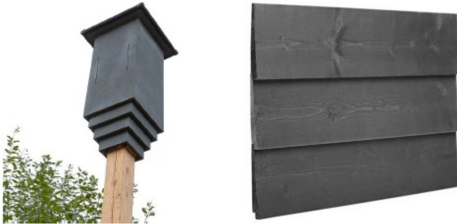
Figuur 5. Links Weergave vlermuizenpaalkast waarvan er twee worden geplaatst in het plangebied. Rechts, Gevelbetimmering met compartimenten van 3cm te plaatsen aan de muren loods en schuur golfbaan.