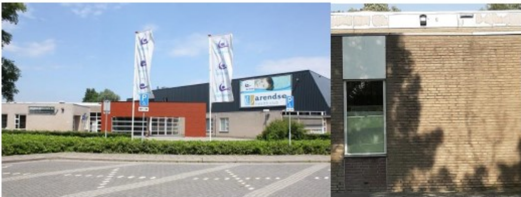
Figuur 4. Locatie geplaatste 16 vleermuiskasten aan het gebouw van sportvereniging MFC De Kreek.