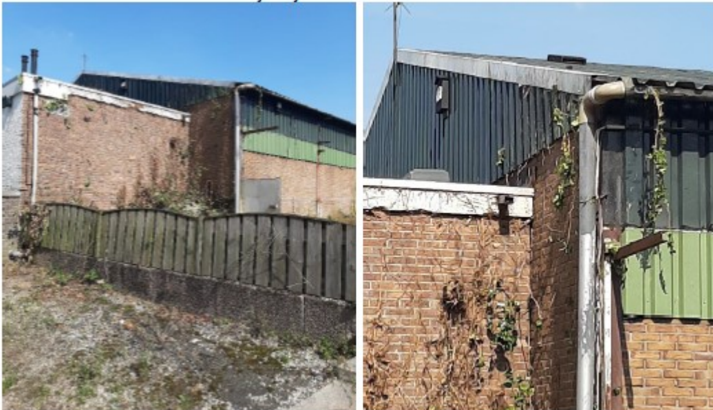
Figuur 3. Locatie geplaatste acht vleermuiskasten tegen de muren van de loods en vier op het dak.