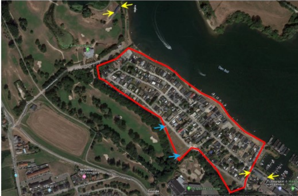
Figuur 7. Locatie plaatsing van de gevelbetimmering (gele pijl) en de twee vleermuizenpaalkasten (blauwe pijl).