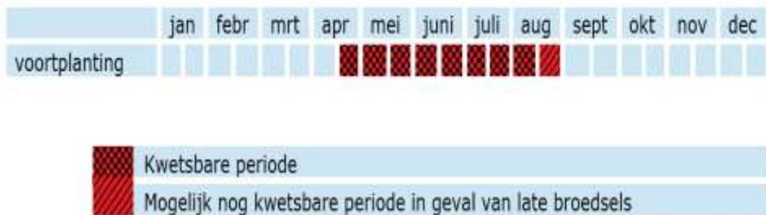
Figuur 7: Op hoofdlijnen weergegeven de kwetsbare perioden van de gierzwaluw.