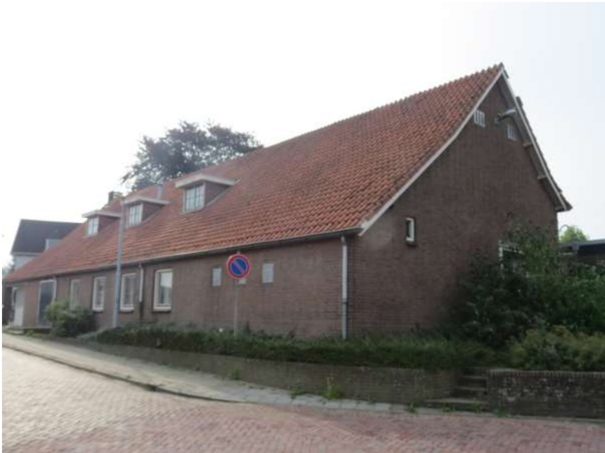
Hoofdgebouw Secretaris Janssenstraat Heerewaarden (blijft intact)

Deze drie gedeelten zijn met elkaar verbonden en hebben dienst gedaan als dorpshuis. Inmiddels is het een leegstaand pand en de opdrachtgever is voornemens om deels te slopen . Er zullen nieuwe woningen/appartementen gebouwd worden met tuin en parkeerplaatsen.