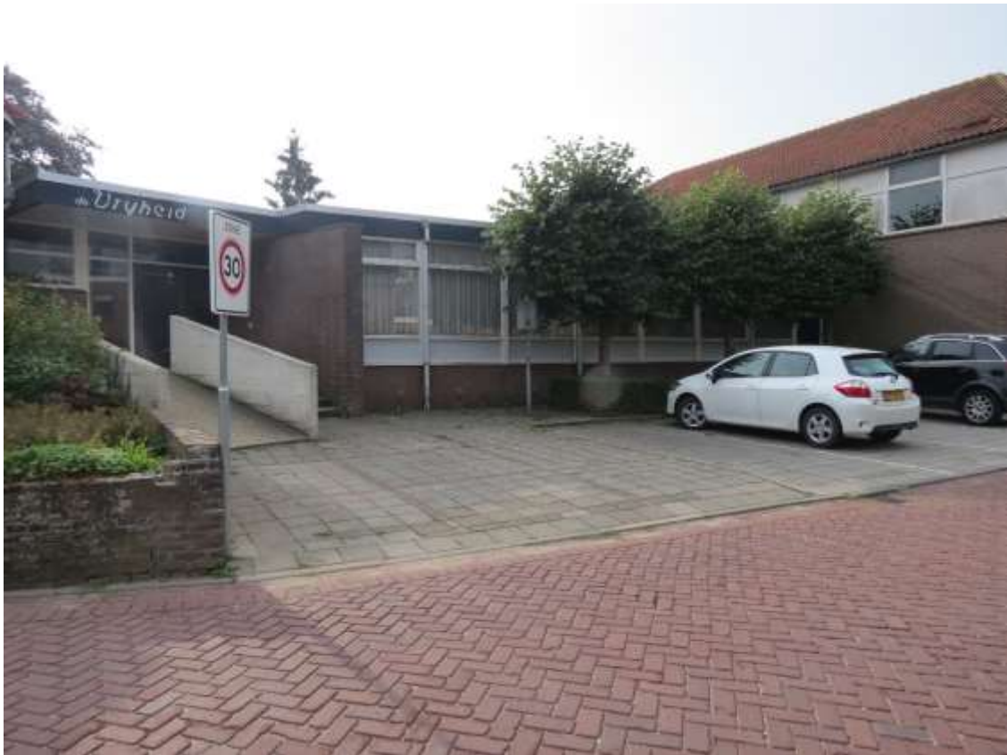
Midden/tussenstuk hoek Oude Maasdijk (wordt gesloopt)