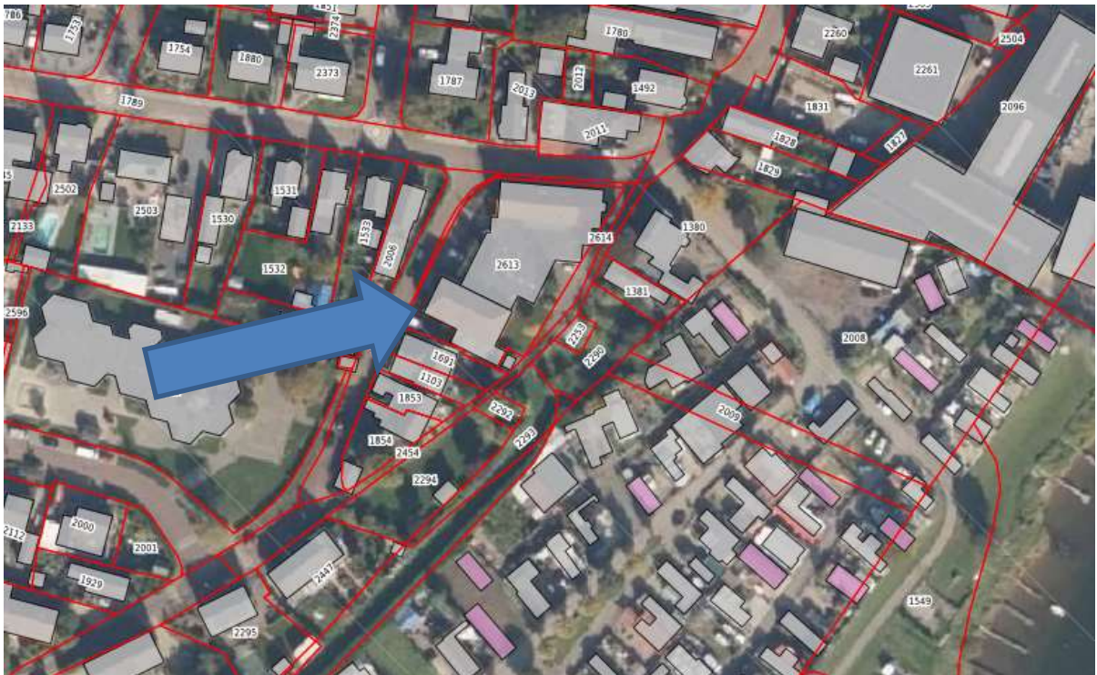
kadastraal perceel 2613