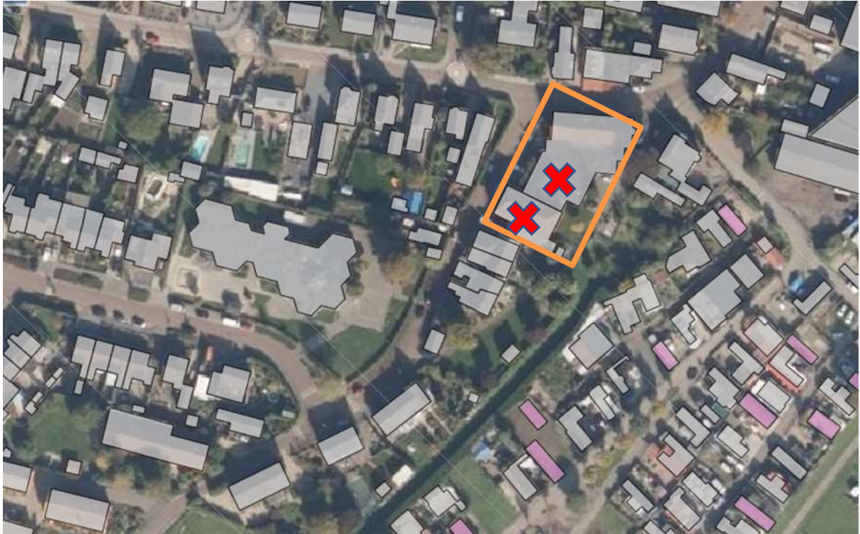
Projectlocatie met de te slopen gedeelten