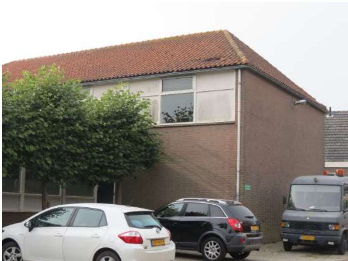
Gymzaal (wordt gesloopt)