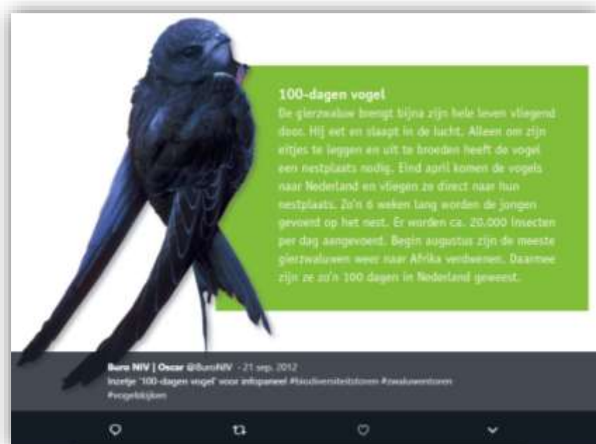
Tweet Buro NIV