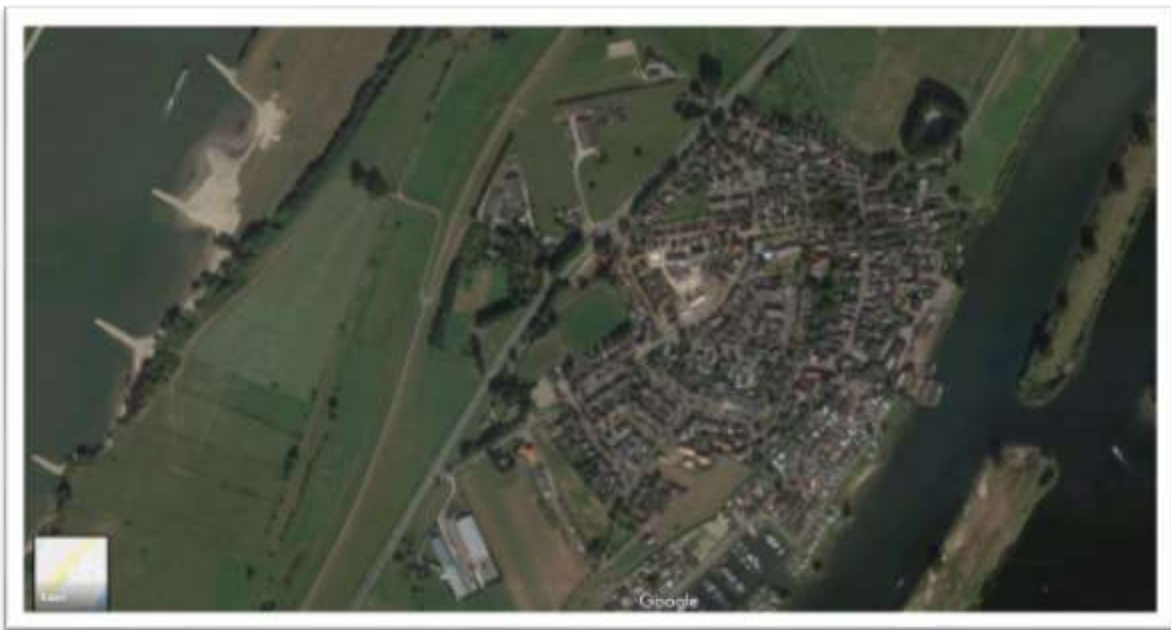
Luchtfoto van het dorp Heerewaarden

De geplande ontwikkeling betreft het leegstaande dorps huis gelegen aan de Secretaris Janssenstraat 1 te Heerewaarden; gemeente Maasdriel. Heerewaarden is een dorp in de gemeente Maasdriel in de Nederlandse provincie Gelderland. Het dorp telt 1355 inwoners (per 1 januari 2018).