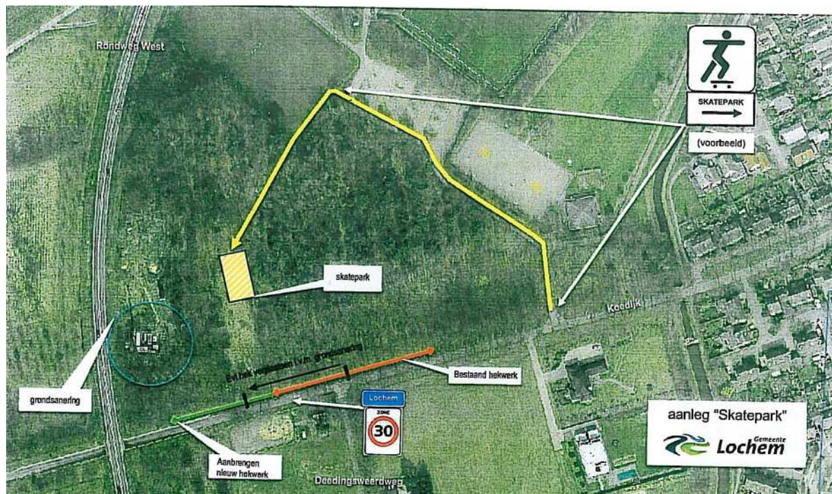
(Afbeelding 3: toegangsroutes + aan te leggen hekwerk)

Uit de beschreven verkeerskundige analyse kan worden geconcludeerd dat met het realiseren van het skatepark naar verwachting geen onveilige situaties ontstaan in verkeerstechnisch opzicht.