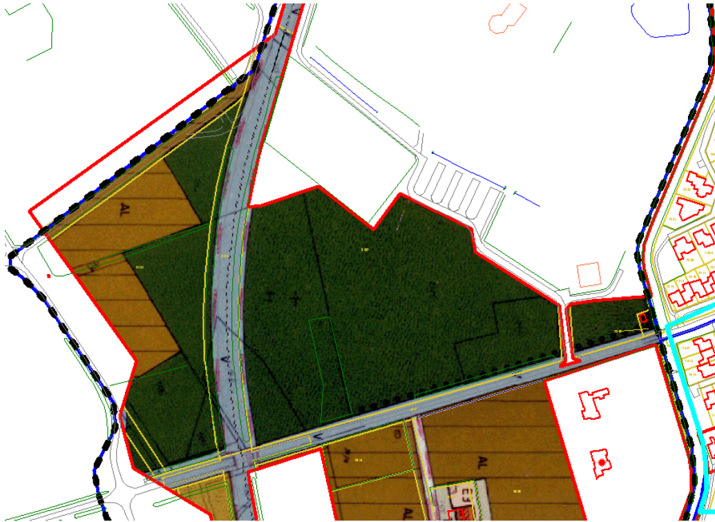
(Afbeelding 2: Uitsnede plankaart bestemmingsplan "Westelijke Omlidingsweg")