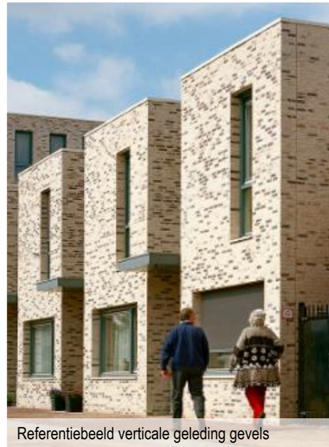
Referentiebeeld verticale geleding gevels