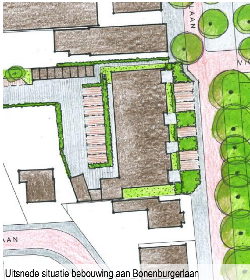
Uitsnede situatie bebouwing aan Bonenburgerlaan