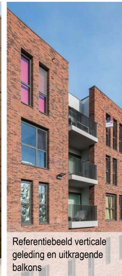
Referentiebeeld verticale geleding en uitkragende balkons