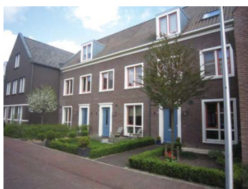
Door te "spelen" met de rooilijn en de kapvorm ontstaat een afwisselend gevelbeeld