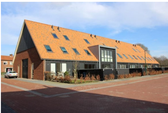
Agrarische uitstraling woningen