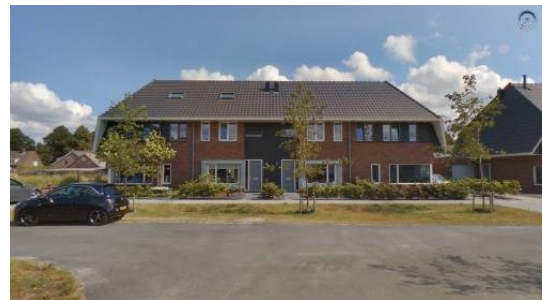
Incidenteel afwisseling in kapvorm, eenheid in materiaalgebruik en architectuur van de rijwoningen