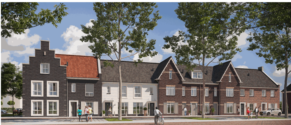
Rijke detaillering en afwisselend gevelbeeld zorgt voor 'statige' architectuur