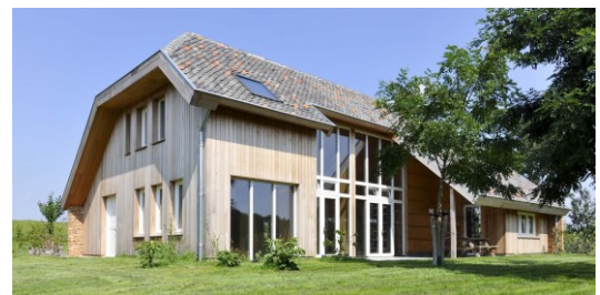
Incidenteel toepassen van hout en riet in de woningen