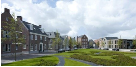
Prominent aanwezige straatwanden met 'statige' architectuur