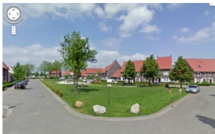
Eenheid in architectuur rondom de Brink