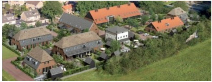
Woningen rondom het erf vormen een duidelijke eenheid