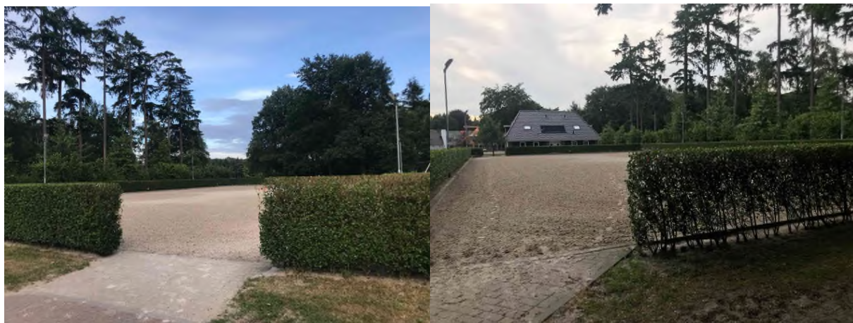
Figuur 2: Impressies paardenbak

Buitenrijbanen (paardenbakken) zijn onmisbaar voor iedere serieuze paardensportbeoefenaar. Dit geldt zowel voor de professionele ruiters als voor de hobbymatige ruiters. Buitenrijbanen hebben echter ook een impact op de omgeving. Enerzijds door de ruimtelijke componenten (omheining, bodem en lichtmasten). Anderzijds door functionele componenten (geluid, licht en stof). De uitdaging ligt in het zo goed mogelijk inpassen van buitenrijbanen op het erf.