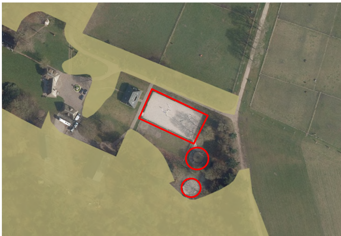
Figuur 3. Ligging paardenbak en loop/tredmolens (rood omrand) t.o.v. natuurbeheertypen Gelders Natuurnetwerk. Bruin: Droog bos met productie.