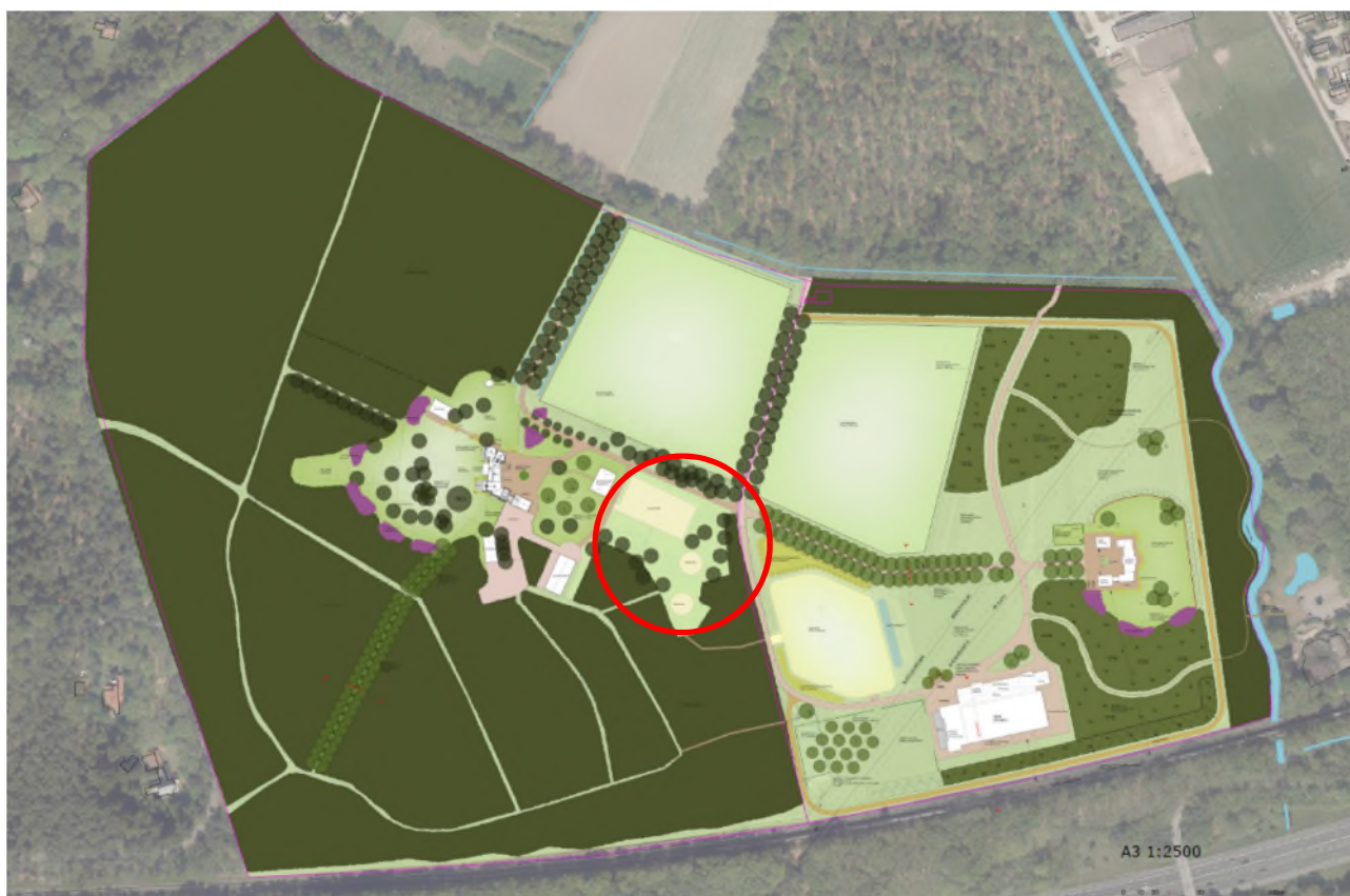
Figuur 4: Landschapsplan landgoed Morssinkhof 9's Hoeve Hierden

Het plangebied ligt buiten de gronden die in het bestemmingsplan met de dubbelbestemming Waarde - Openheid landschap worden beschermd.