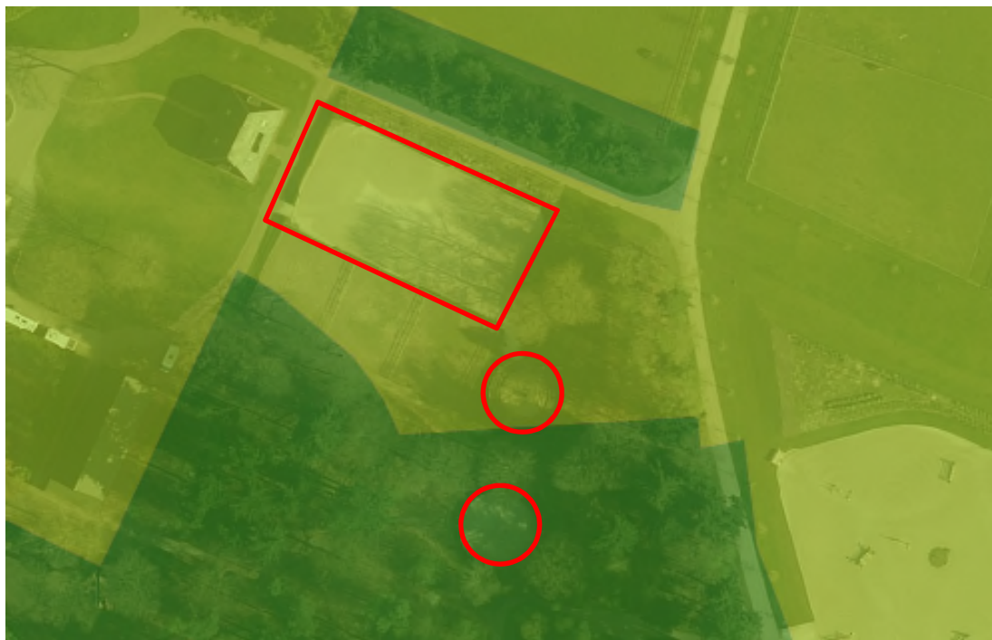
Figuur 2. Ligging paardenbak en loop/tredmolens (rood omrand) t.o.v. Gelders Natuurnetwerk (donker groen) en Groene ontwikkelingszone (licht groen).