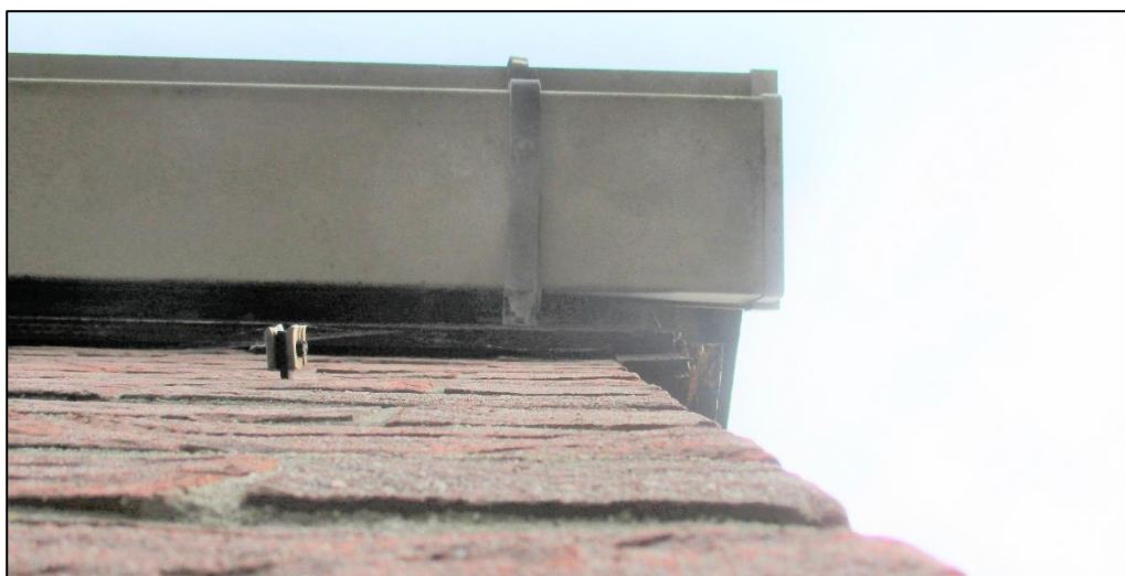
Figuur 3 De aanwezige opening onder het boeiboord betreft een opening van minder dan 1,5 cm.

Naar aanleiding van deze betreffende vraag zijn voorjaarsrondes ten aanzien van de gewone en ruige dwergvleermuis uitgevoerd. Dit betreft een ochtendronde en avondronde in de periode 15 mei en 15 juli. De aanwezige opening (c.q. boeiboord van de opslagloods) betreft een ruimte van < 1,5 cm (figuur 3). Hierdoor kunnen verblijfplaatsen van grotere vleermuissoorten als meervleermuis en laatvlieger uitgesloten worden. Door het uitsluiten van potentie voor grotere vleermuissoorten zoals laatvlieger, zijn 2 avonden in deze periode niet benodigd.