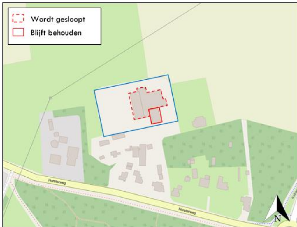
Figuur 1 De planlocatie (blauw omkaderd) is gelegen aan de Horsterweg 160 te Ermelo.

Aan de Horsterweg 160 te Ermelo is een perceel met een bedrijfswoning met een voortuin en bedrijfsbebouwing gesitueerd. De initiatiefnemer is voornemens de bedrijfswoning te renoveren en transformeren in twee huurwoningen; de bedrijfsbebouwing te saneren en zes nieuwe vrijstaande woningen te realiseren.