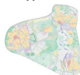
Plangebied van het bundelingsgebied