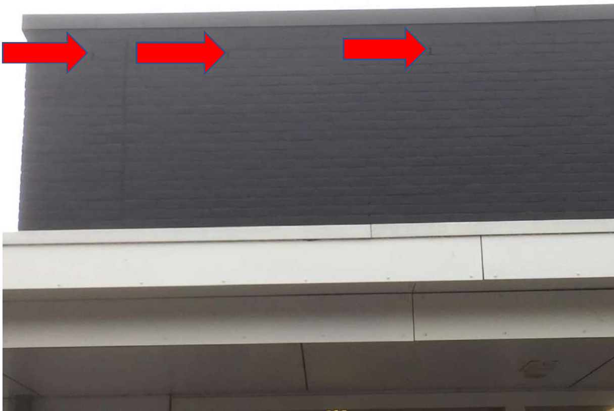
Figuur 3. Voorgevel. De rode pijlen wijzen naar drie van de open stootvoegen.

De meest strikte bescherming gaat uit naar vaste verblijfplaatsen van vleermuizen. Tijdens het veldbezoek is gekeken naar plekken die dienst kunnen doen als vaste verblijfplaats voor vleermuizen. Hierbij zijn in de voorgevel open stootvoegen aangetroffen, die toegang kunnen geven tot verblijfplaatsen.