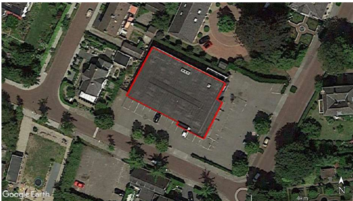
Figuur 2. Luchtfoto van het te slopen winkelpand (rood omlijnd).

De planlocatie is een winkelpand uit 1982 met een oppervlakte van circa 700 m 2 op het adres Arnhemsestraat 50 te Brummen (kadastraal Brummen G 4241). Het gebouw heeft een plat dak. Er is geen open water.