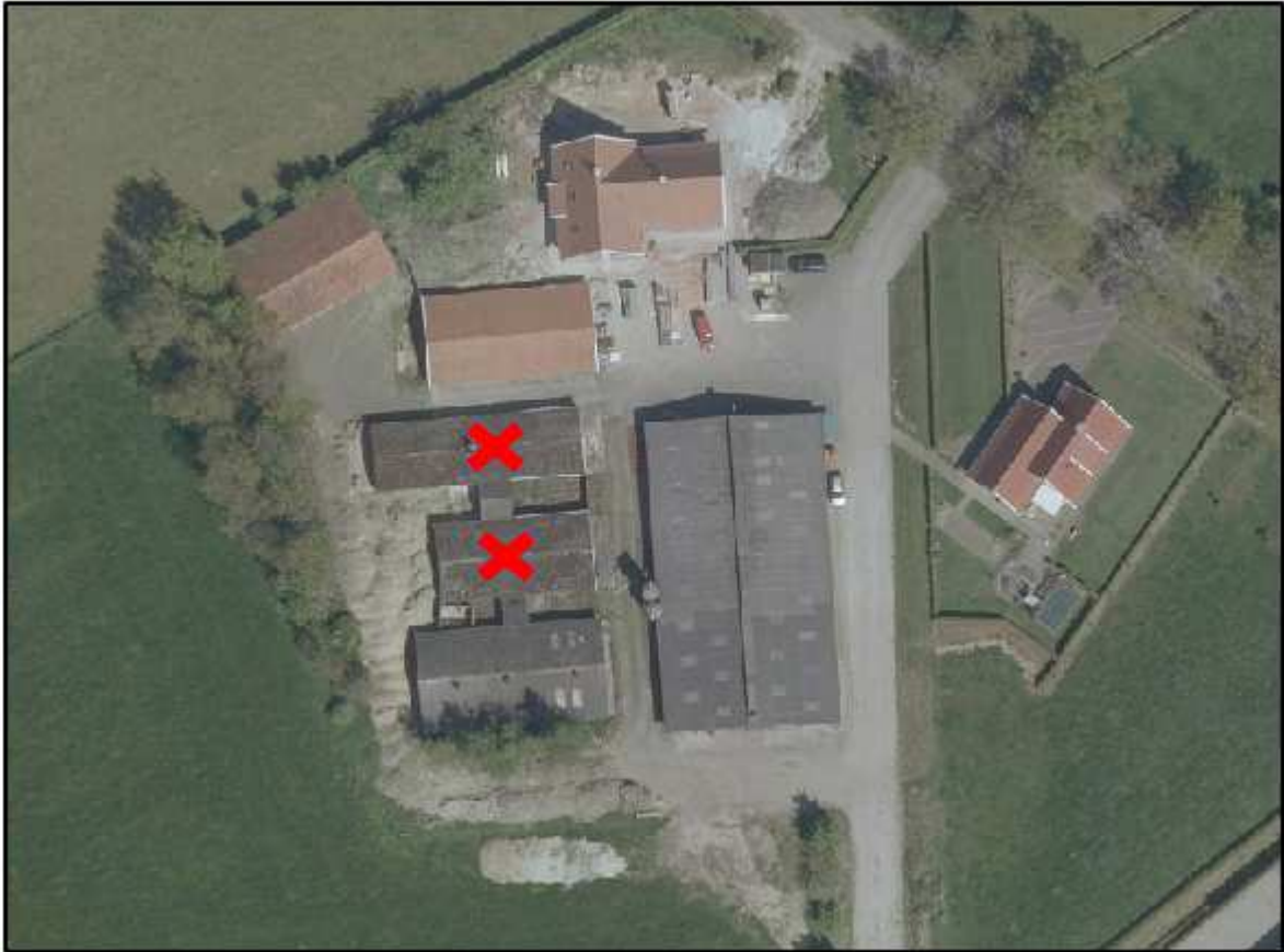
Sluttenweg 8-10 Reutum

Bijlage: te slopen schuren in kader van toepassing schuur voor schuur regeling Ootmarsumseweg 320 Reutum