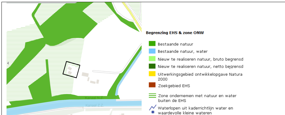
Ligging van het NNN nabij het plangebied. De ligging van het plangebied wordt met het zwarte vierkant aangeduid. Gronden die tot het NNN behoren worden met de groene kleur aangeduid (Bron: Provincie Overijssel).

Het plangebied behoort niet tot het Natuurnetwerk Nederland. Gronden die tot het NNN behoren liggen op minimaal 60 meter afstand van het plangebied. Het plangebied ligt gedeeltelijk in de 'Zone ondernemen met natuur en water buiten de EHS'. Op onderstaande afbeelding wordt de ligging van het NNN in de omgeving van het plangebied weergegeven.