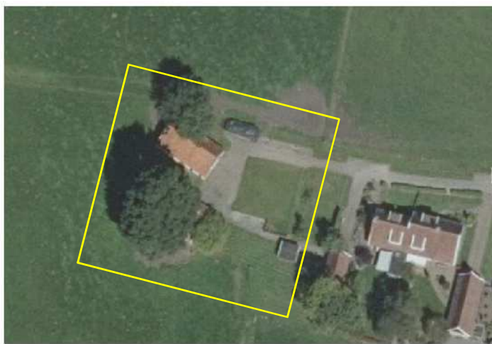
Detailweergave en begrenzing van het deelgebied.

Het plangebied bestaat uit bebouwing, erfverharding en agrarisch cultuurland. In het plangebied staan een oude, vervallen boerderij, kapschuur en een klein houten schuurtje. De boerderij en kapschuur zijn gebouwd van bakstenen en gedekt met gebakken pannen. De boerderij is in vervallen staat. Delen van de buitenmuur en het dak zijn ingestort waardoor het gebouw niet wind- en waterdicht is. De gebouwen beschikken niet over dak- of wandisolatie. Ten zuiden van de oude boerderij staat een oude zomereik. Recent is opgaande beplanting ten noorden van de boerderij geveld. Een deel van het plangebied bestaat uit erfverharding, gazon en agrarische cultuurgrond. Deze was tijdens het veldbezoek in gebruik als weide. Op onderstaande luchtfoto wordt het plangebied in detail weergegeven, evenals de begrenzing.