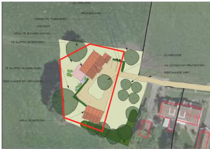
Wenselijk eindbeeld van het plangebied.

Het concrete voornemen bestaat om alle bebouwing in het plangebied te slopen en een nieuwe woning en bijgebouw op te richten. Het nieuwe erf wordt landschappelijk ingepast door de aanplant van erfbeplanting. Op onderstaande afbeelding wordt het wenselijke eindbeeld weergegeven.