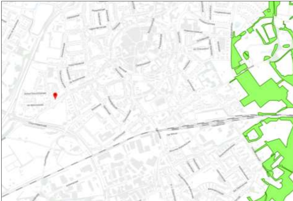
Ligging van Natuurnetwerk Nederland in de omgeving van het plangebied. De ligging van het plangebied wordt met de rode marker aangeduid. Gronden die tot Natuurnetwerk Nederland behoren worden met de lichtgroene kleur op de kaart aangeduid

Het plangebied behoort niet tot het Natuurnetwerk Nederland. De bescherming van het Natuurnetwerk Nederland kent geen externe werking in de provincie Overijssel. De voorgenomen activiteiten leiden daarom niet tot wettelijke consequenties in het kader van gebiedsbescherming, zoals opgenomen in de Omgevingsverordening Overijssel.