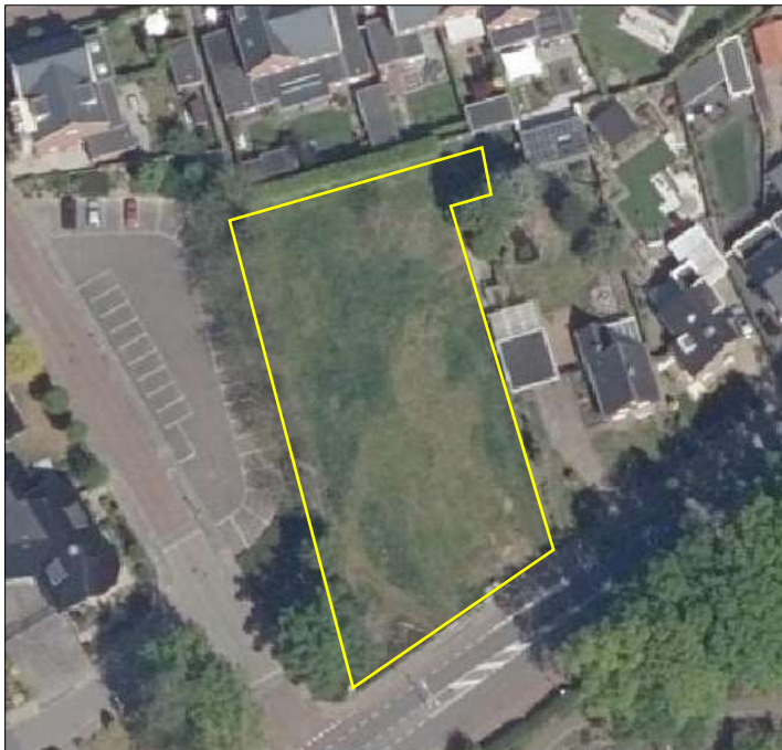
Begrenzing van het plangebied wordt de gele lijn aangeduid.

Het plangebied bestaat volledig uit grasland. In het noordelijke deel van het plangebied staat een solitaire loofboom. Het plangebied wordt aan de zuid- en westzijde begrenst met hekken. De noordzijde van het plangebied grenst aan een laurierhaag. Ten oosten en noorden wordt het plangebied omgeven door woningen en tuinen.