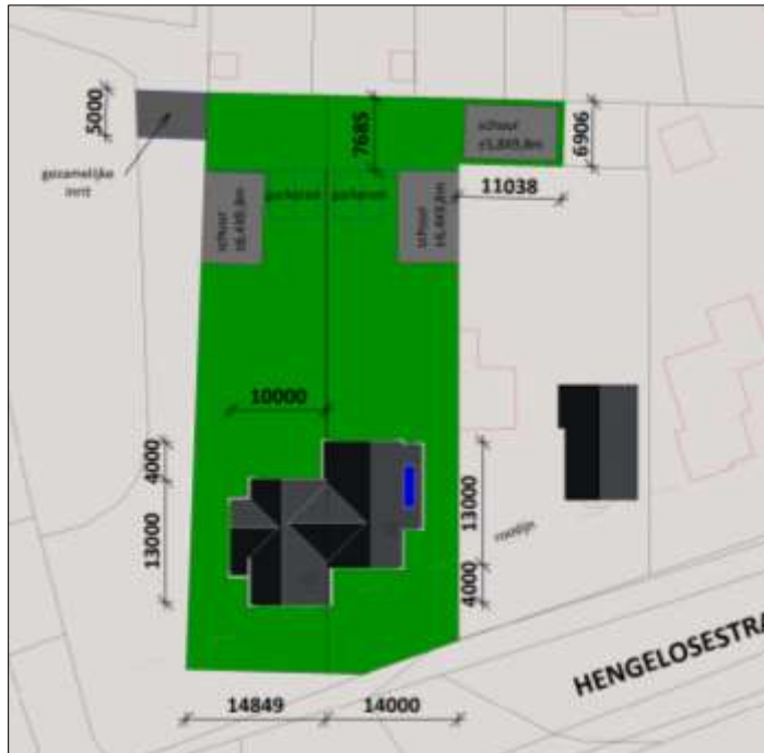
Verbeelding van het wenselijke eindbeeld

Het voornemen bestaat om twee aaneengesloten woningen, drie schuren en parkeerplekken te realiseren in het plangebied (zie onder). De laurierhaag net ten noorden van het plangebied blijft waarschijnlijk behouden. Aangenomen wordt dat de solitaire loofboom gerooid wordt. In deze beoordeling wordt ingegaan op de wettelijke consequenties van de voorgenomen activiteiten.