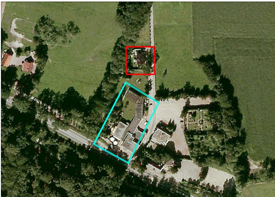
Luchtfoto met in rood de locatie van de bedrijfswoning en in blauw de locatie van hotel De Grote Zwaan

In het plangebied bevindt zich een bedrijfswoning en een hotel. Ten oosten van het plangebied is pannenkoekenrestaurant De Stroper gesitueerd en ten westen grenst het plangebied aan weiland. Het plangebied heeft één ontsluitingsweg, die uitkomt op de N735.