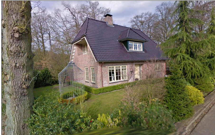
Aanzicht bedrijfswoning