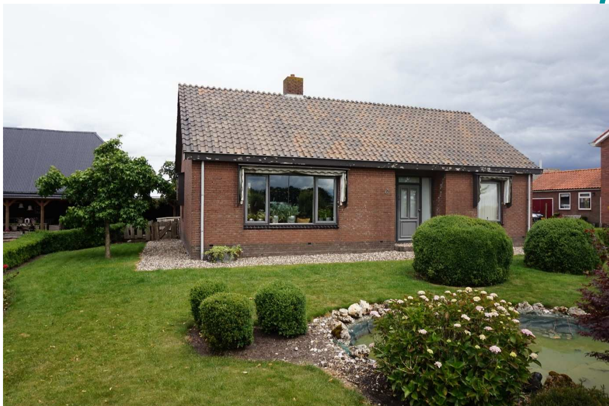
Figuur 2.2. Vooraanzicht te slopen woning.