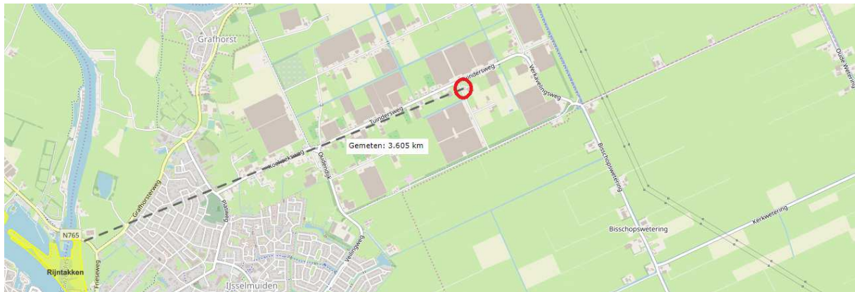
Figuur 2.7. De afstand tussen de onderzoekslocatie en het dichtstbijzijnde Natura 2000-gebied

Gelet op de afstand tot het gebied, de aard van het tussenliggende gebied (bebouwde kom IJsselmuiden en kassengebied), de kernopgave van het gebied en de aard van de geplande ingreep wordt er geen onderzoek in het kader van gebiedsbescherming binnen de Wet natuurbescherming uitgevoerd (zie ook paragraaf 1.2 scope).