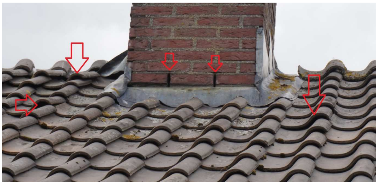
Figuur 5.2. Verschillende potentiële invliegopeningen voor vleermuizen.

Uit het veldbezoek is gebleken dat in de te slopen woning sprake is van potentieel beschermde waarden voor gebouwbewonende vleermuizen. Als gevolg van ruimtes bij losliggende dakpannen, kantpannen en openstootvoegen in de schoorsteen is voor gebouwbewonende vleermuizen mogelijkheid om toegang te verkrijgen tot potentiële verblijfplaatsen in de bebouwing (zie ook figuur 5.2).