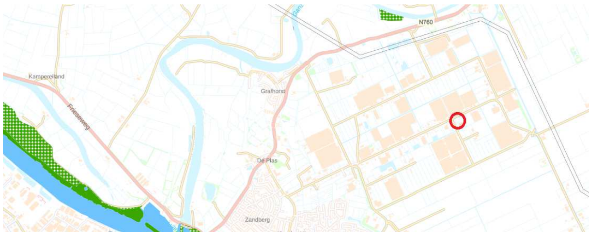
Figuur 2.8 Ligging onderzoekslocatie ten opzichte van het NNN.

Op de kaart in figuur 2.8 is te zien dat in de directe omgeving van de onderzoekslocatie (binnen rode cirkel) geen sprake is van een gebied uit de het Natuurnetwerk Nederland (NNN). Daar er geen sprake is van aantasting van wezenlijke waarden en kenmerken van het NNN is verder onderzoek naar invloeden op het NNN niet van toepassing.