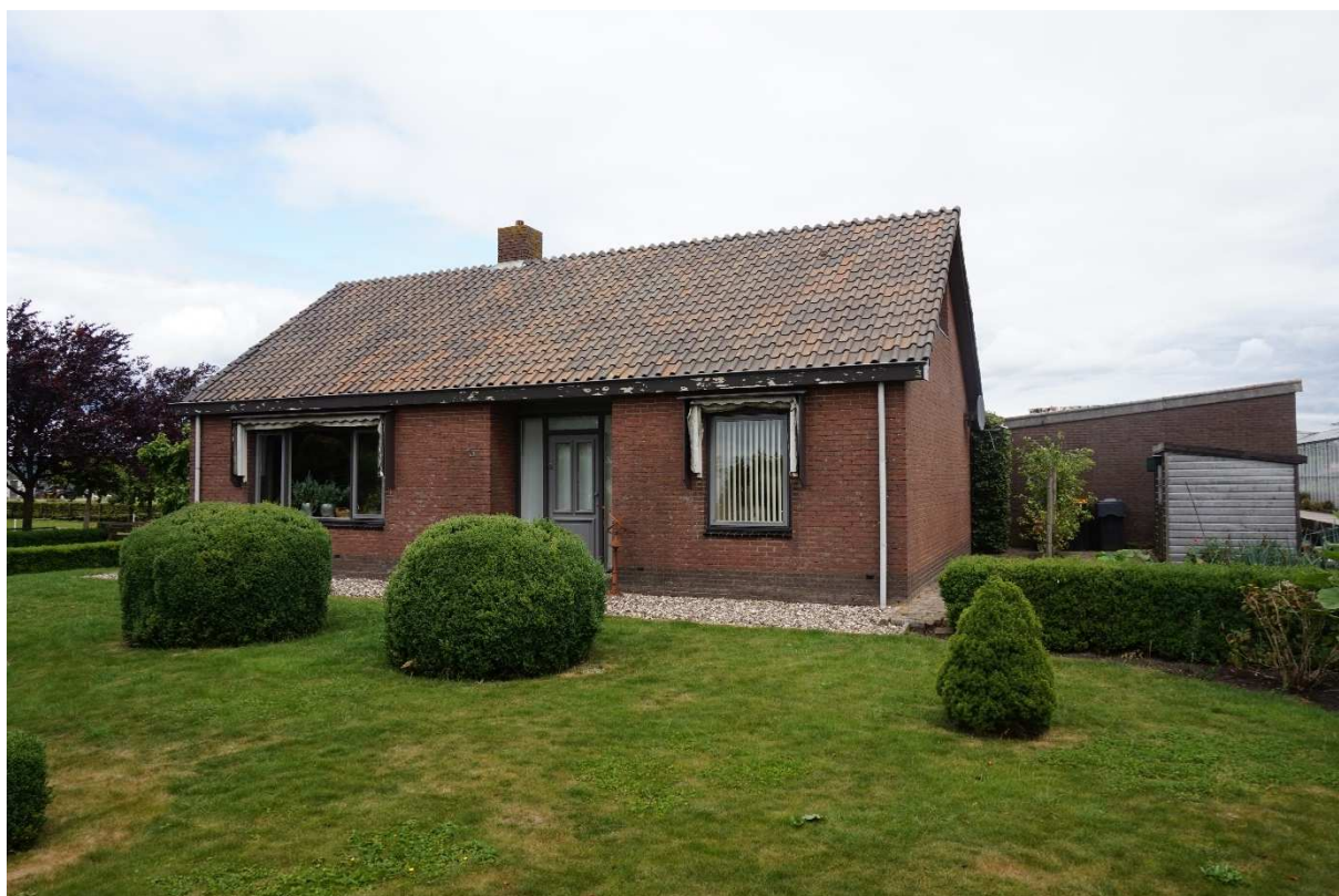
Figuur 2.3. Vooraanzicht te slopen woning.