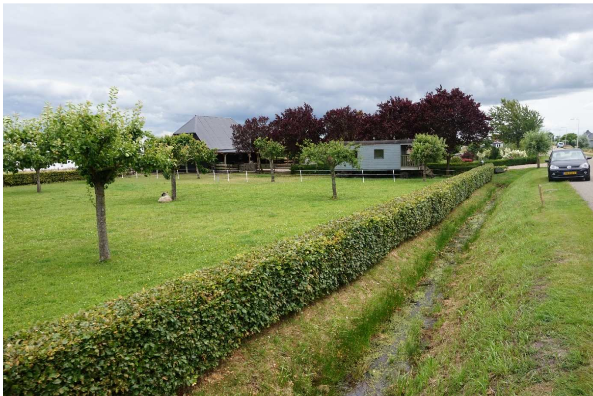
Figuur 2.4. Beoogde bouwlocatie.