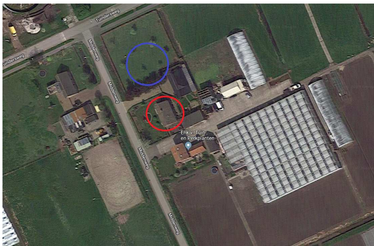
Figuur 2.1. Te slopen woning, rood omcirkeld. Beoogde bouwlocatie, blauw omcirkeld.

In onderstaande figuur 2.1 is de onderzoekslocatie aangegeven.