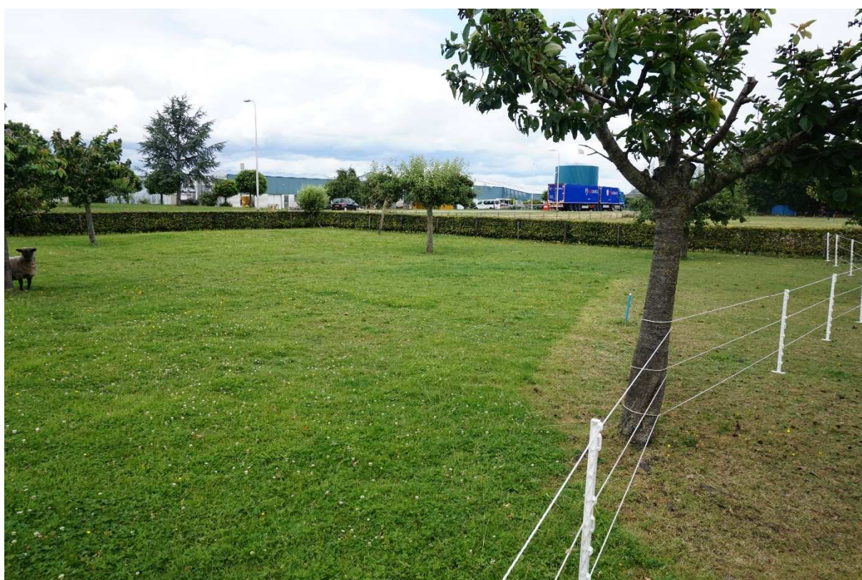
Figuur 2.5. Beoogde bouwlocatie.