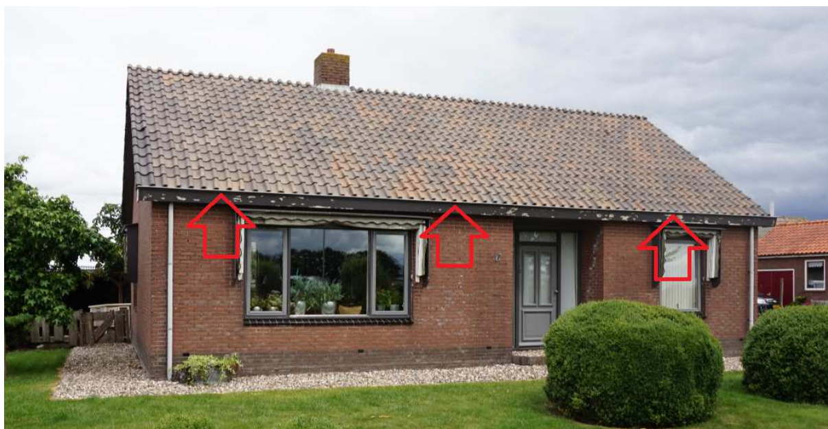
Figuur 5.1. Toegang tot dakconstructie bij de dakgoot aan de voorzijde van de woning.

Door het ontbreken van geschikte invliegopeningen voor gierzwaluwen wordt deze jaarrond beschermde soort (tevens een gebouwbewonende soort) ter plaatse niet verwacht.