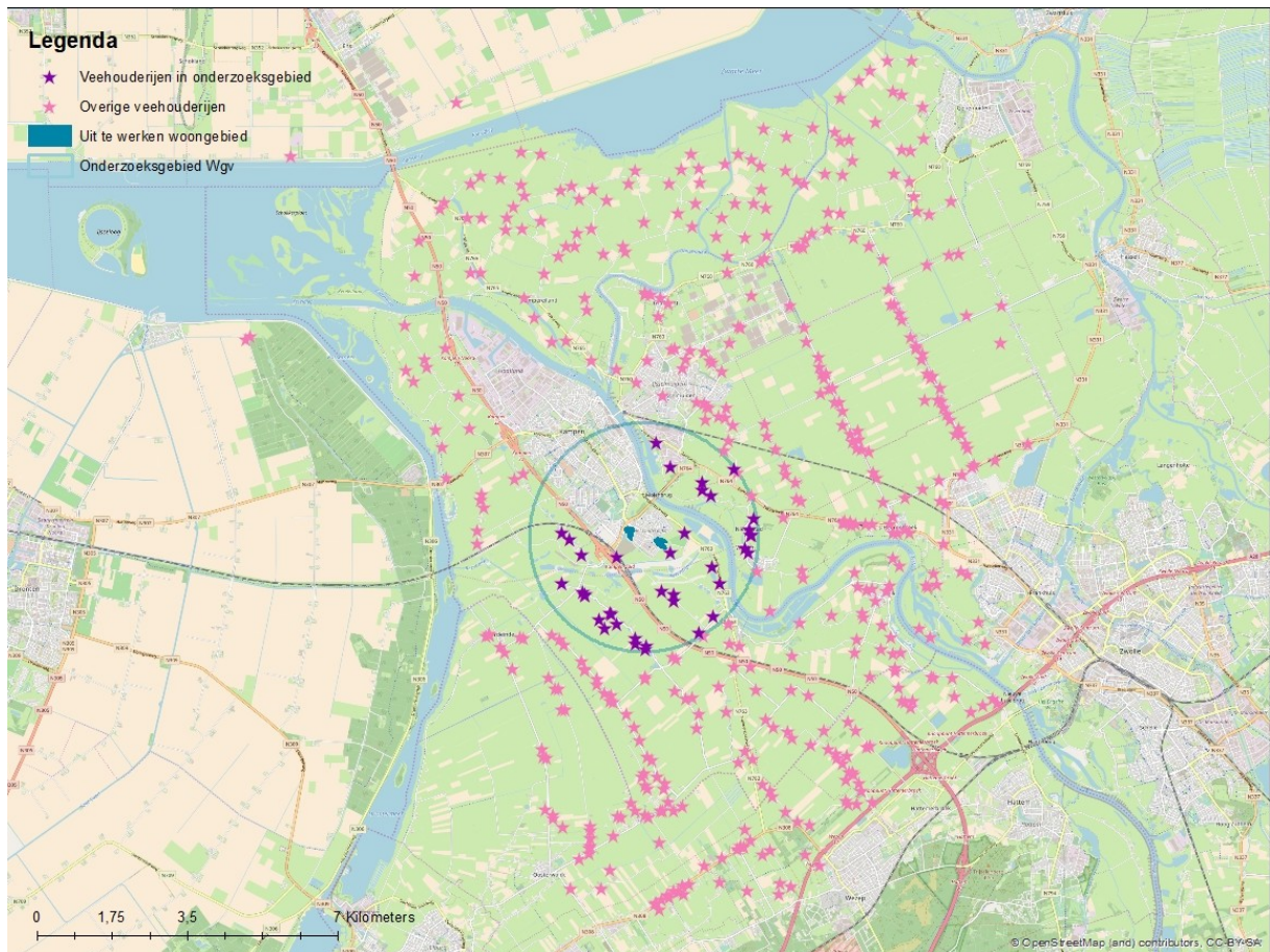
Figuur 3.1 Overzicht veehouderijen Kampen en omgeving.