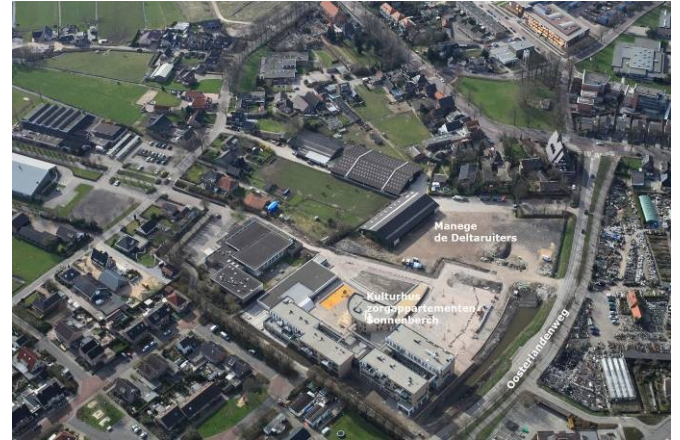
Grondeigendomkaart. Oranje = gemeentegrond Luchtfoto manege Deltaruiters gezien vanuit het oosten