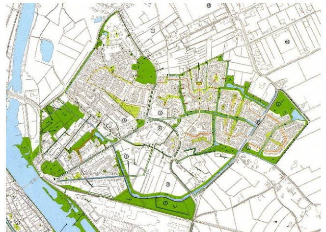
Structuurvisie en groenstructuurvisie