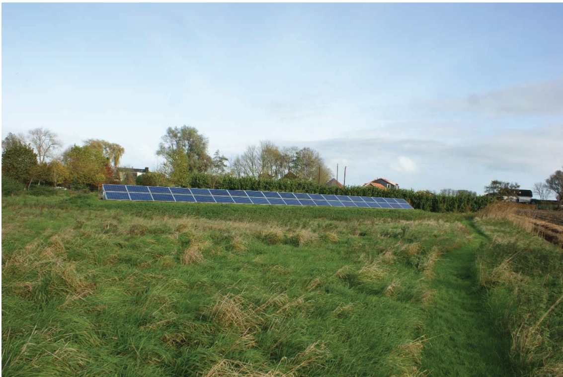
Figuur 2.5 Zonnecollectoren aan zuidzijde erf.