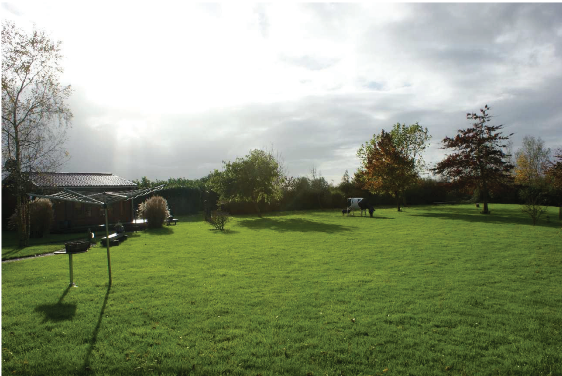
Figuur 2.3. Grasveld binnen bouwvlak, achter bestaande bungalows