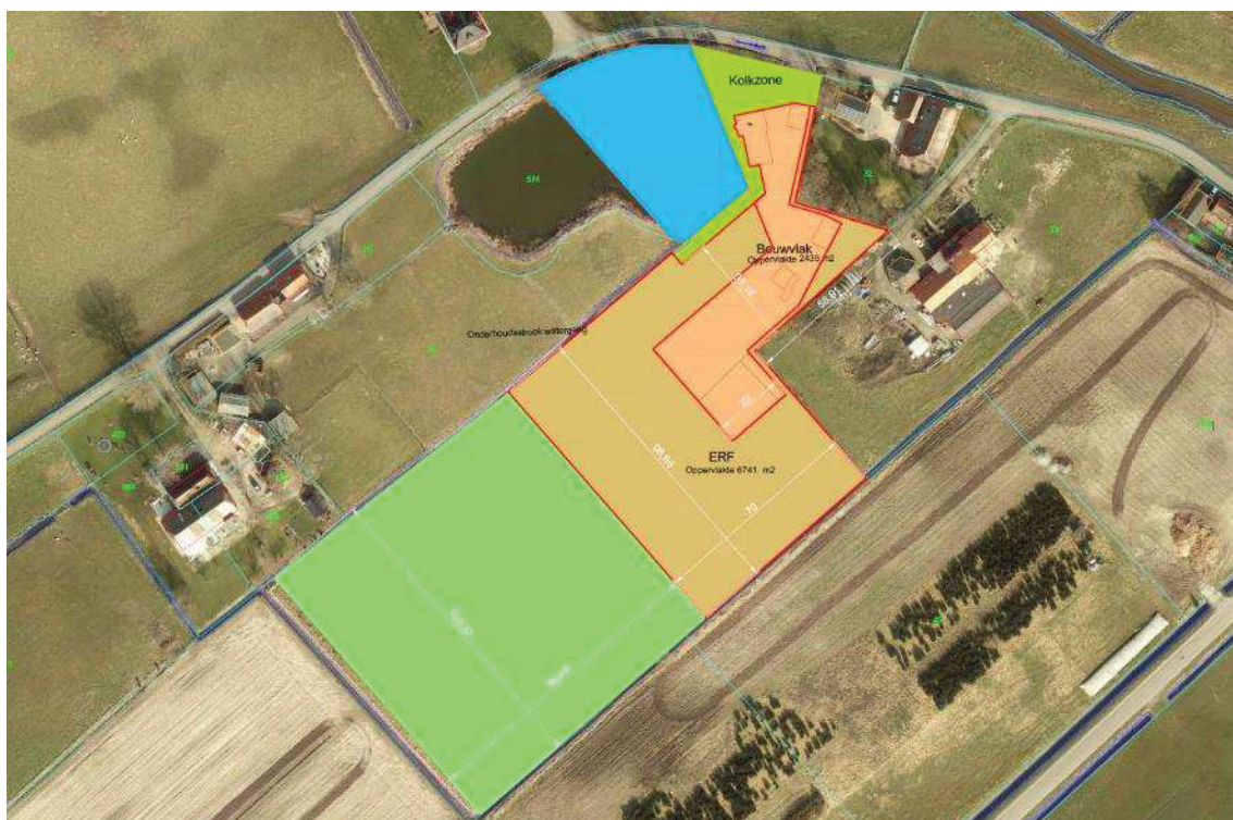
Figuur 2.1. Plangebied

In onderstaande figuur 2.1 is de onderzoekslocatie aangegeven.