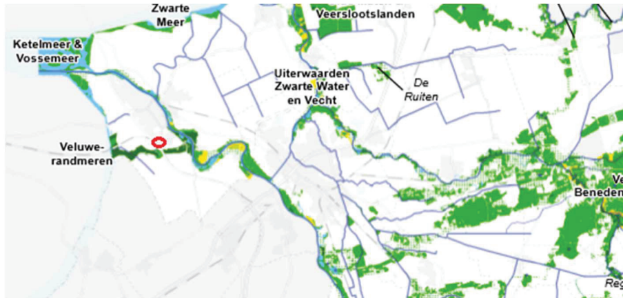
Figuur 2.7 Ligging onderzoekslocatie ten opzichte van het NNN

Daar er geen sprake is van externe toetsing van invloeden op het NNN is verder onderzoek naar invloeden op het NNN niet van toepassing.