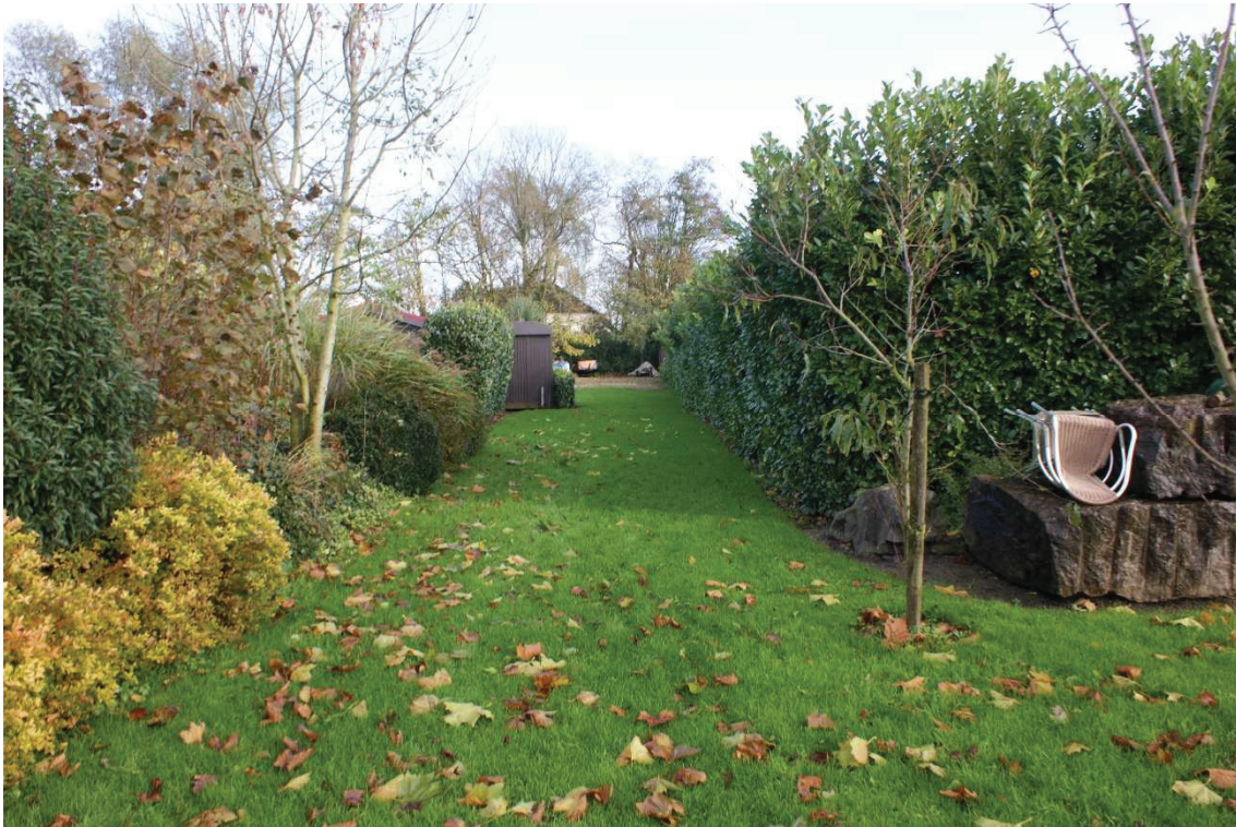
Figuur 2.4. Overzicht door tuin