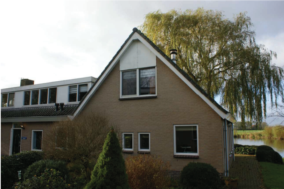
Figuur 2.2. Bestaande woning