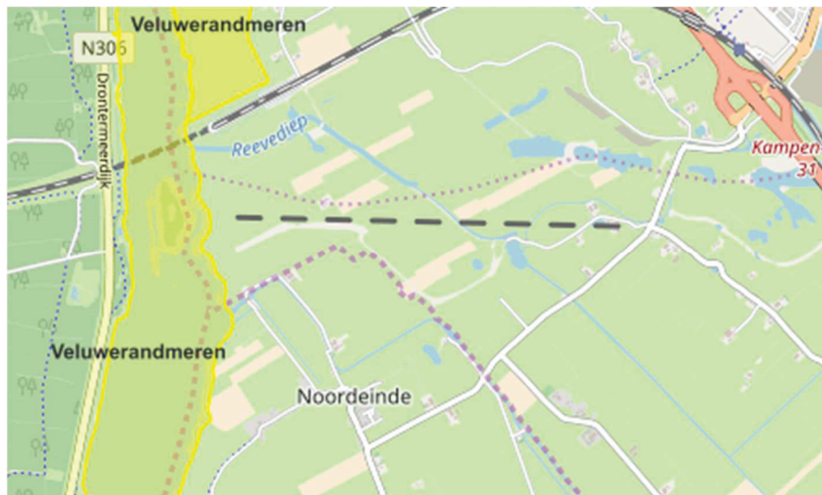
Figuur 2.6 De afstand tussen de onderzoekslocatie en het dichtstbijzijnde Natura 2000-gebied (geel gearceerd)

Gelet op de afstand tot het gebied, de kernopgave van het gebied en de aard van de geplande ingreep wordt er geen onderzoek in het kader van gebiedsbescherming binnen de Wet natuurbescherming uitgevoerd (zie ook paragraaf 1.2 scope).