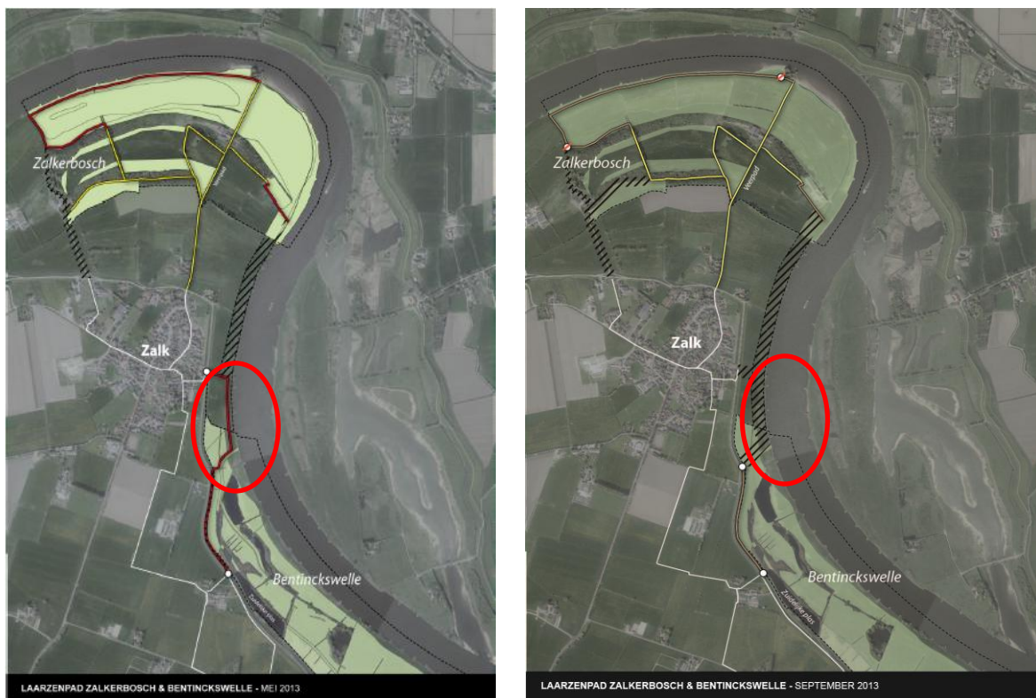
Rood omcirkeld het gedeelte van het laarzenpad dat is vervallen uit de ontwerpvergunning (links) en zoals dat nu in de definitieve vergunning staat (rechts).

Gevolg voor besluit: Het wandelpad in het zuiden van Zalkerbosch, voor zover in strijd met het bestemmingsplan, is uit de Omgevingsvergunning, de Ffontheffing en de Nbwet van de provincie Overijssel gehaald. Ook is dit wandelpad uit de bijlage Kaart uiterwaardmaatregelen Beneden-IJssel (bij diverse besluiten) verwijderd.