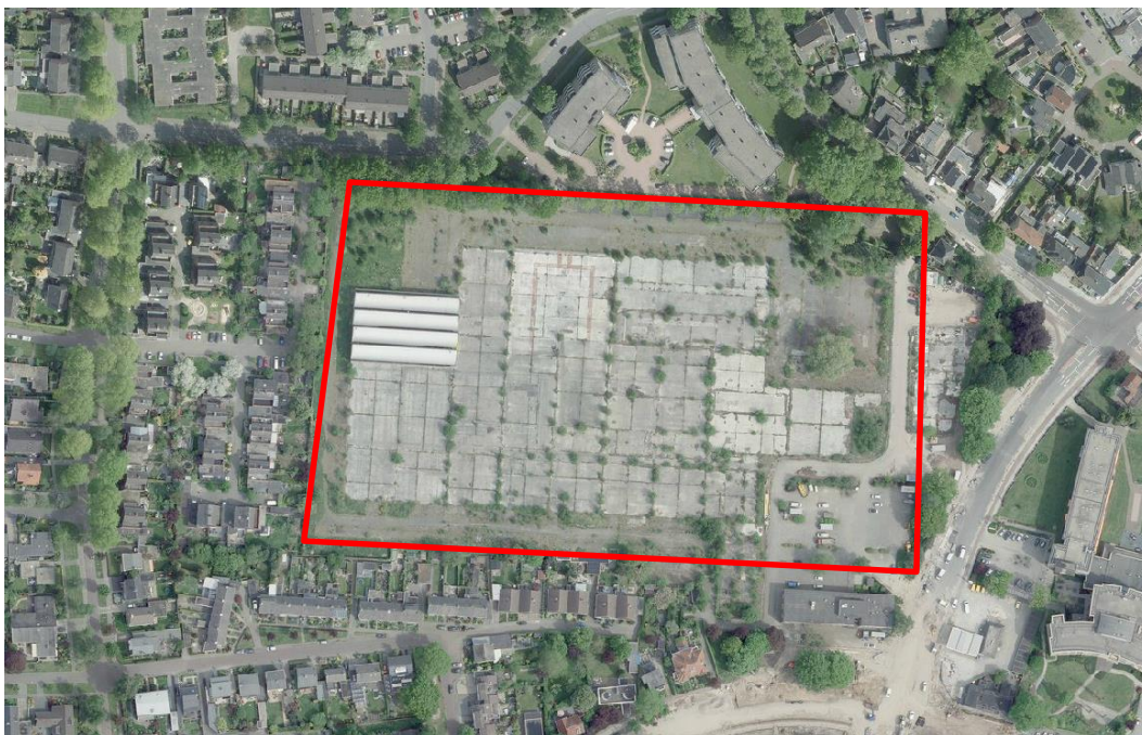
Figuur 2. Globale ligging van het plangebied (rood omkaderd).