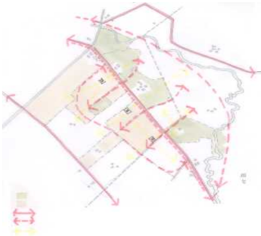
Afbeelding 2: Kaart met eigendommen en indicatieve recreatieve structuur

De Bellersweg is een uniek stukje Hengelo. Het is een van de weinige buitengebieden die de gemeente omzoomt. Door de samenwerking van de vereniging Buurtschap Bellersweg zal aan de zuidrand van de stad een particulier onderhouden natuurgebied van meer dan 30 hectare ontstaan. Het gebied zal grotendeels worden ontsloten met een aaneengesloten netwerk van wandelpaden. Hengelo krijgt er een groene parel van grote recreatieve waarde bij.