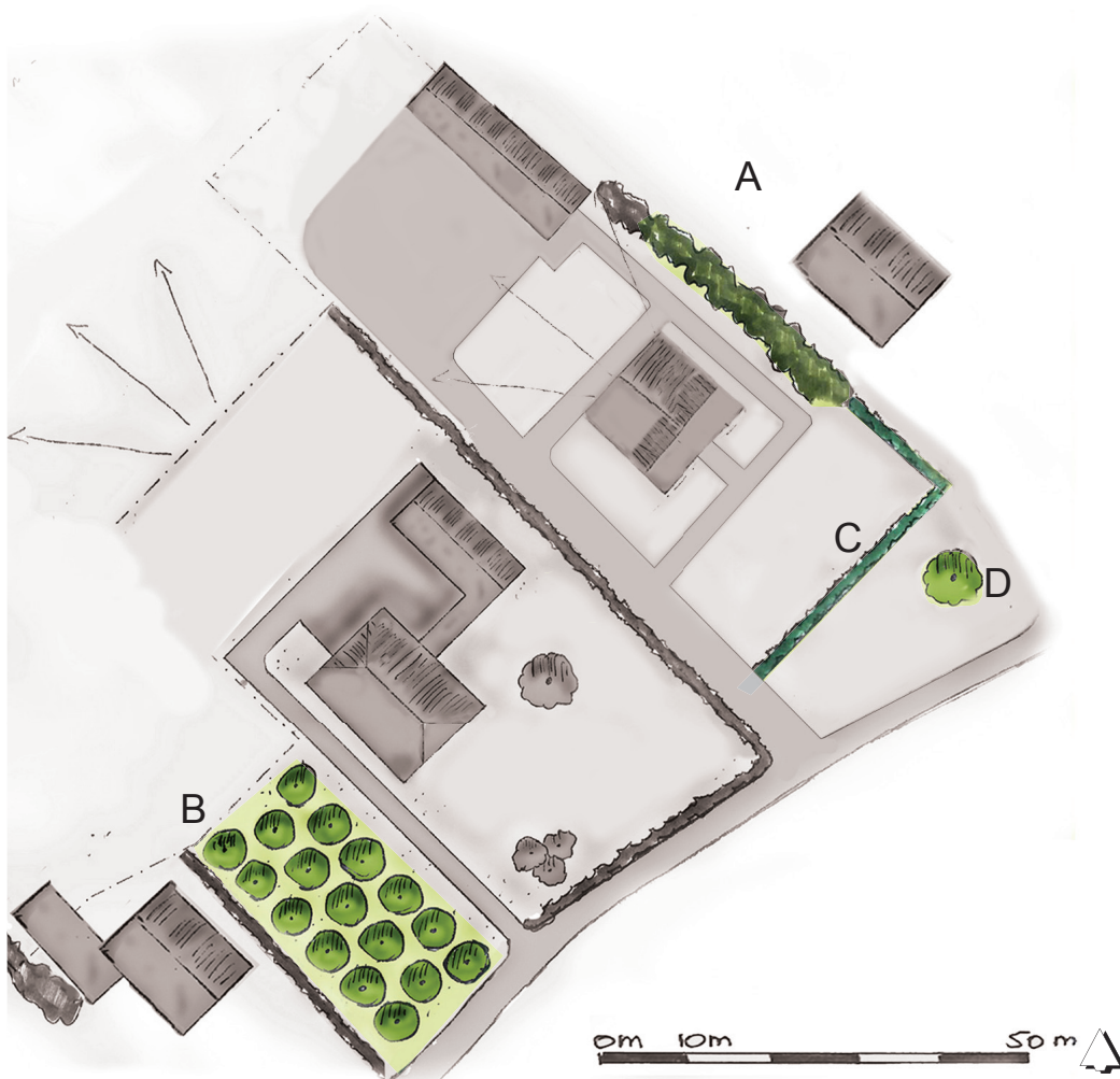
Afbeelding 35. Overzicht elementen beplantingsplan

Opslag: (A en C) kamperfoelie, klimop grove den, wilde appel, taxus, mahonia, framboos en in de randen ook brem.