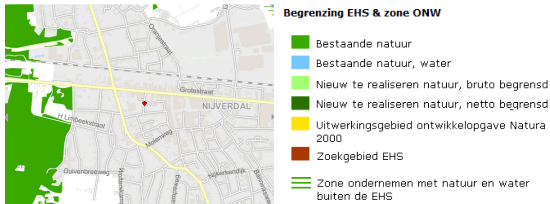
Ligging van de EHS nabij het plangebied. Het plangebied wordt met de rode marker aangeduid.

Het plangebied ligt niet in de EHS. Gronden die tot de EHS behoren liggen 500 meter ten oosten van het plangebied. Op onderstaande kaart wordt de ligging van de EHS in de omgeving van het plangebied weergegeven.