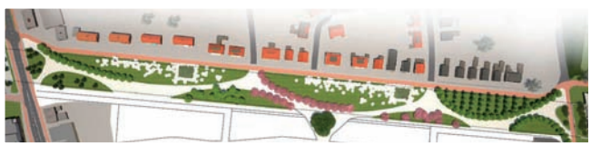
^ Tuinen van Nijverdal