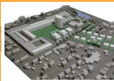
Herontwikkeling Van den Steen > van Ommerenstraat