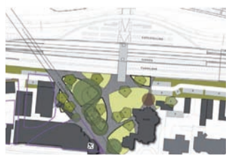
^ Inrichting nieuwe stationsomgeving