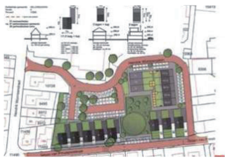
< Plan Hendrik Wormser