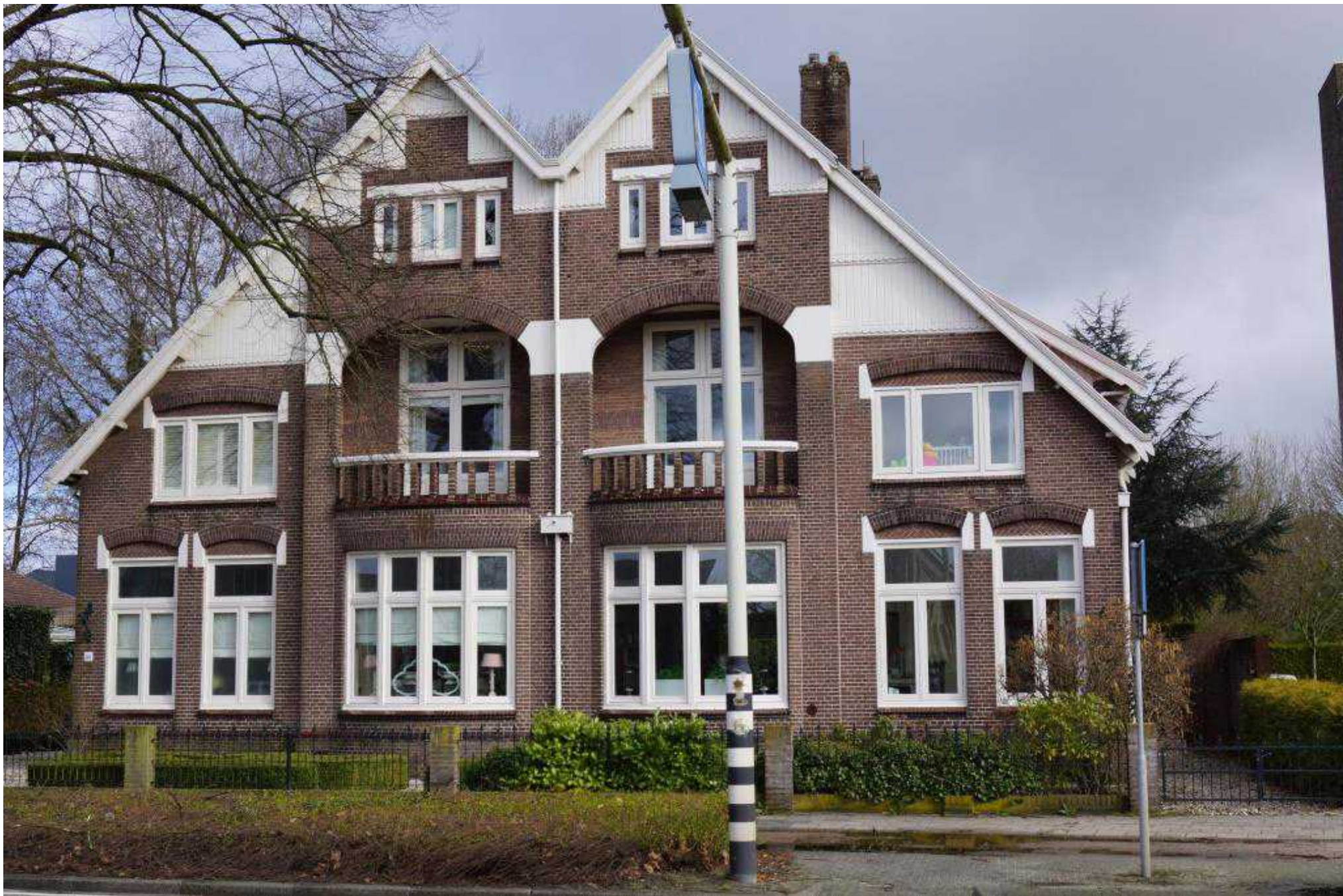
Dubbele villa Grotestraat