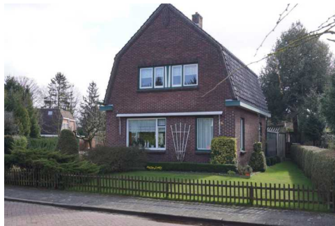
Eerste Kampsweg 26