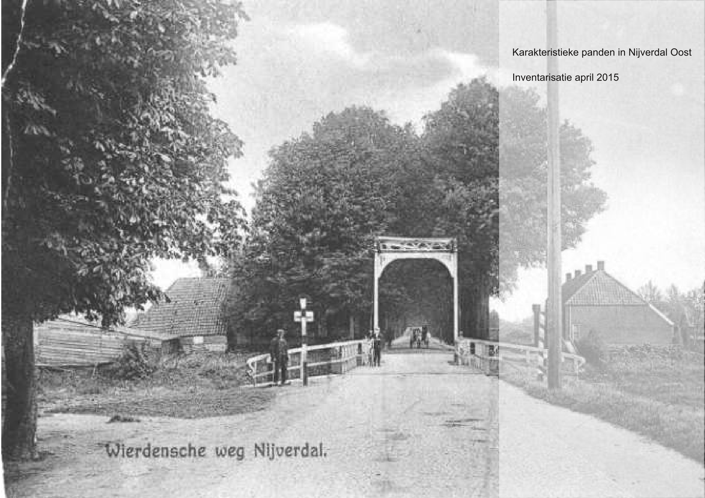
Wierdensche weg Nijverdal.