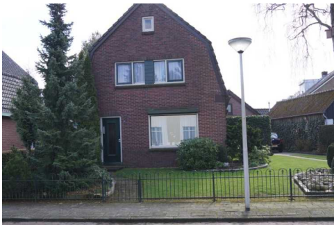
Eerste Kampsweg 24