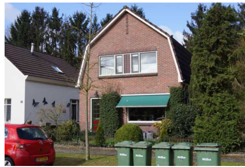
Eerste Kampsweg 35