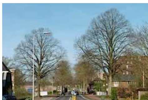
Wierdensestraat: entree met lindes