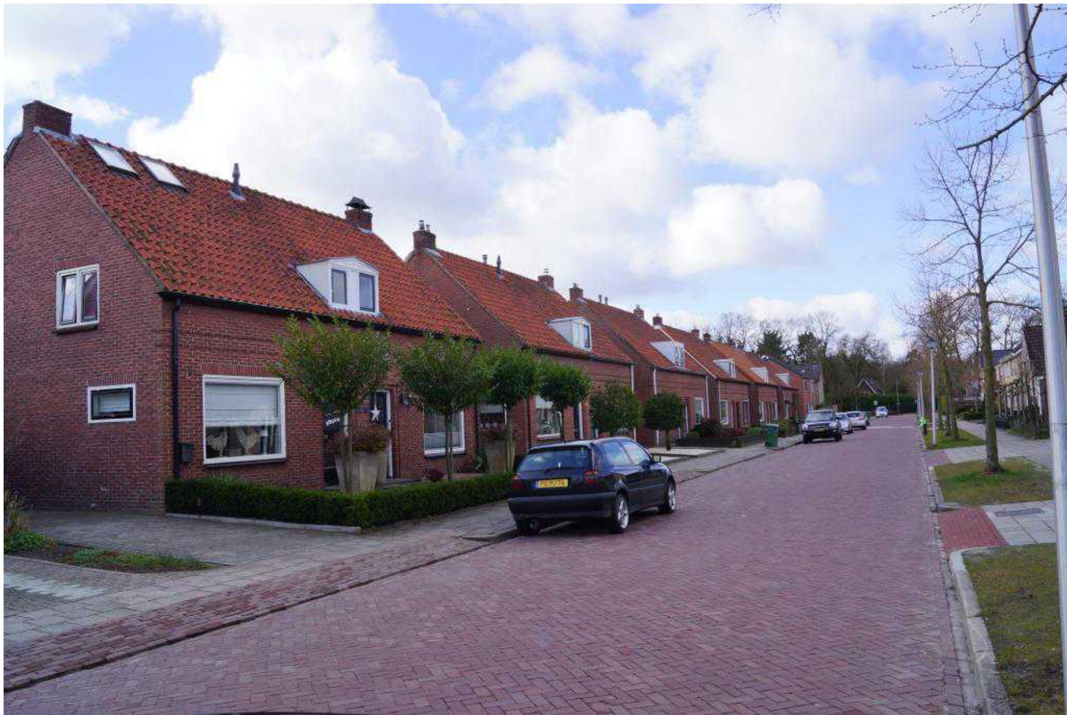
Derde Kampsweg 12-34