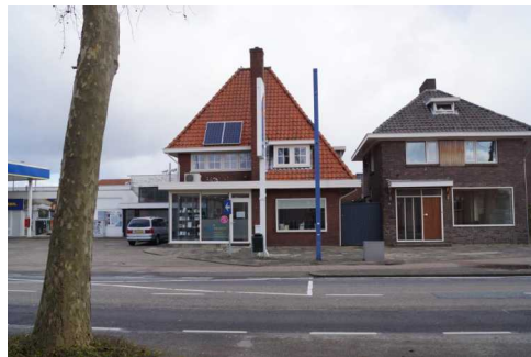
Grotestraat 72a en 72