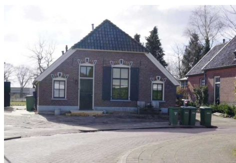
Tweede Kampsweg 44