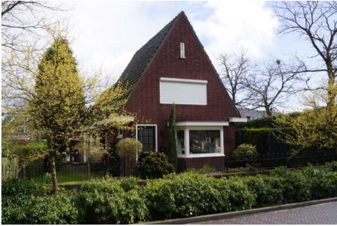
Hoge Dijkje 51