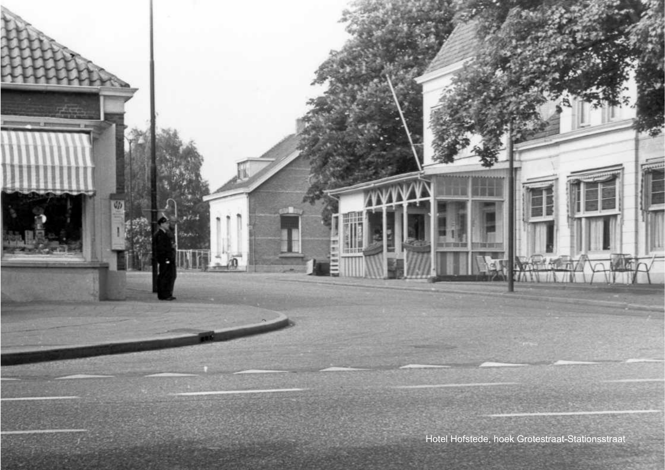
Hotel Hofstede, hoek Grotestraat-Stationstraat