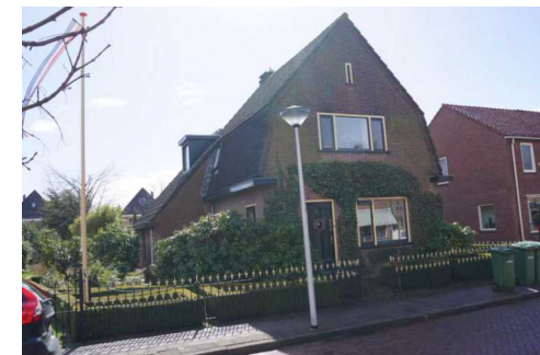
Tweede Kampsweg 14