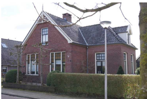
Tweede Kampsweg 42