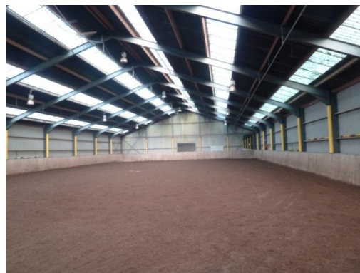
Afbeelding 2 binnenzijde manegehal