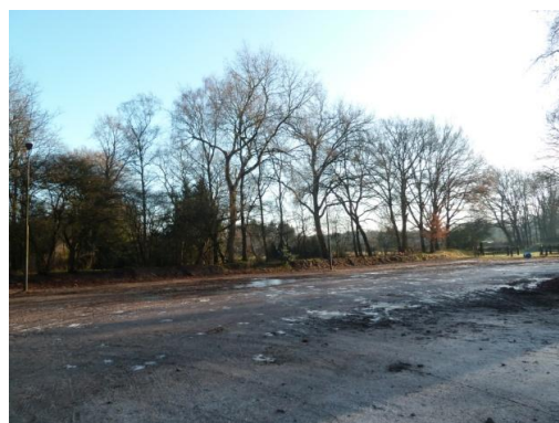
Afbeelding 3 de nieuwbouwlocatie van de manege (oostkant). De nieuwbouwlocatie bestaat uit een open terrein zonder beplanting alleen aan de randen staan enkele bomen.