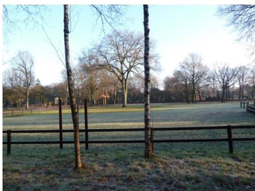
Afbeelding 6 paardenweide aan de westkant van het plangebied.