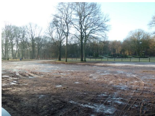
Afbeelding 5 nieuwbouwlocatie (de vier bomen voor het hek zullen waarschijnlijk gekapt worden)