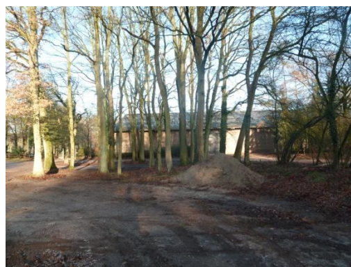
Afbeelding 4 zijkant manegehal (enkele bomen op de voorgrond zullen gekapt worden).