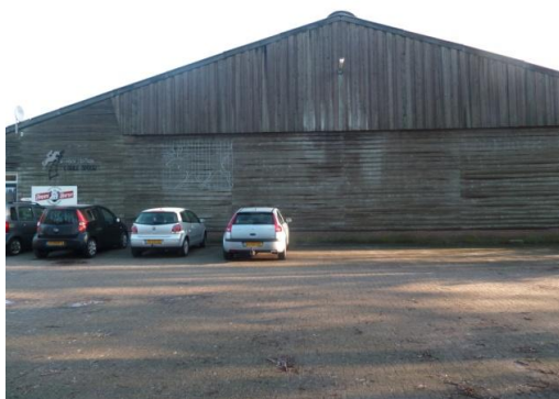
Afbeelding 1 voorzijde manegeschuur

Onderstaande foto's geven een impressie van de projectgebied en de directe omgeving: