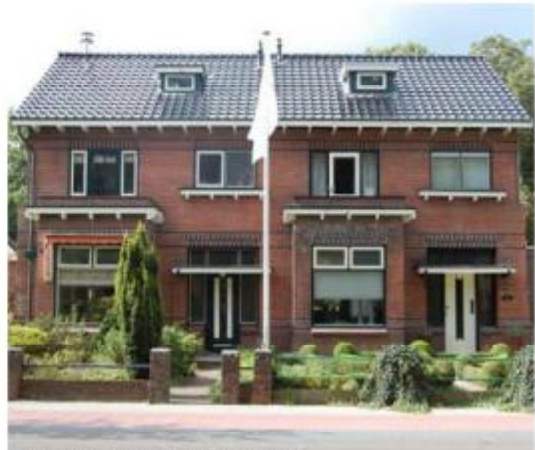
Detailering gevel met metselwerk