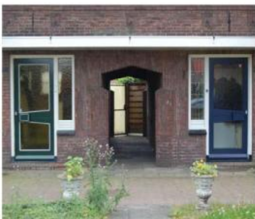
Detail poortje Frederik Hendrikstraat