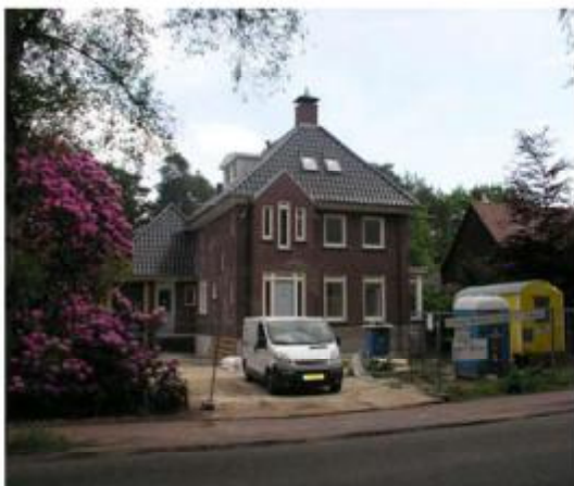
Voorbeeld nieuwe invulling passend in de karakteristiek