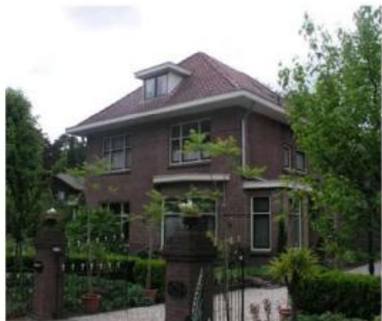
Villa 2 bouwlagen met fors zadeldak (Joncheerelaan)