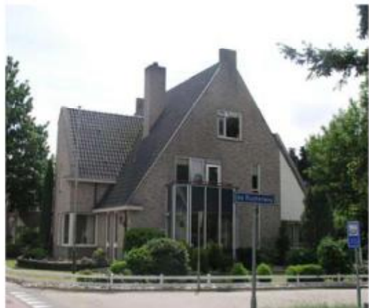
Afwijkend kleur- en materiaalgebruik