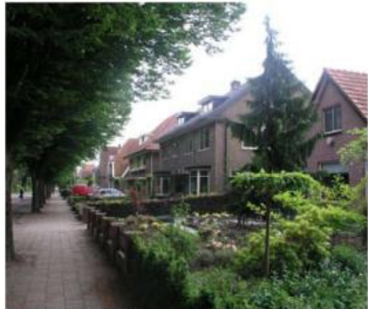
Oranjestraat (woningen en sterke laanbeplanting)