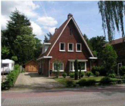
Eenvoudige hoofdvorm, stijl zadeldak. Details in bakgoten, erker. Rood metselwerk, rood pannendak.