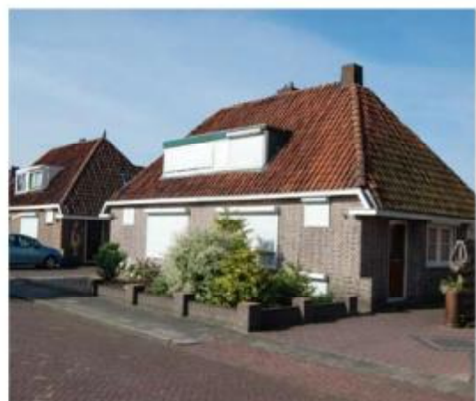
Beeldverstoring door aanbrengen rolluiken