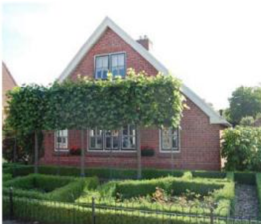
Sallands boerderijtje Julianastraat