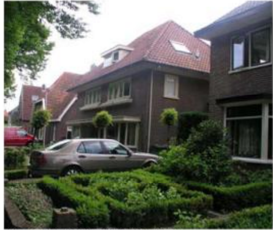
Villa twee-onder-een-kap (Oranjestraat)