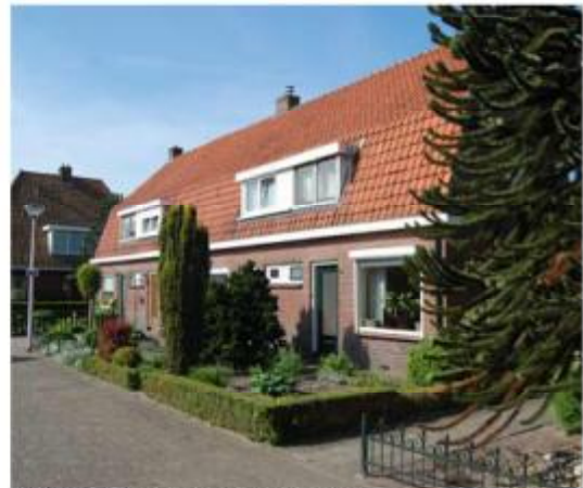
Ensemble rijenwoningen Julianastraat