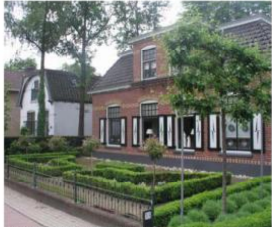
Eenvoudige hoofdvorm met zadeldak. Details in metselwerk, luiken. Roodmetselwerk antraciet pannendak.