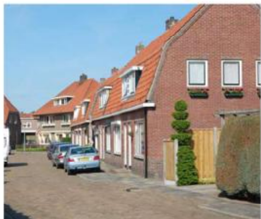
Rijenwoningen met mansardekap Dillenburgstraat