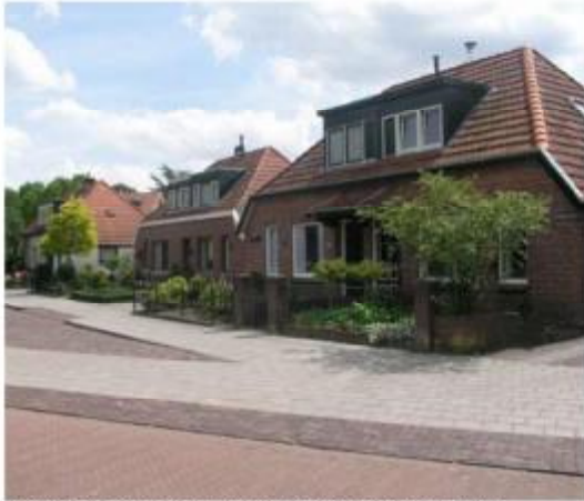
Verstoord ensemble drie halfvrijstaande woningen