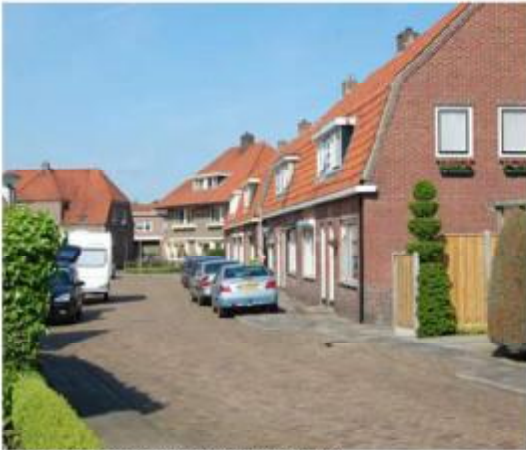
Harmonie in kleur en materiaalgebruik