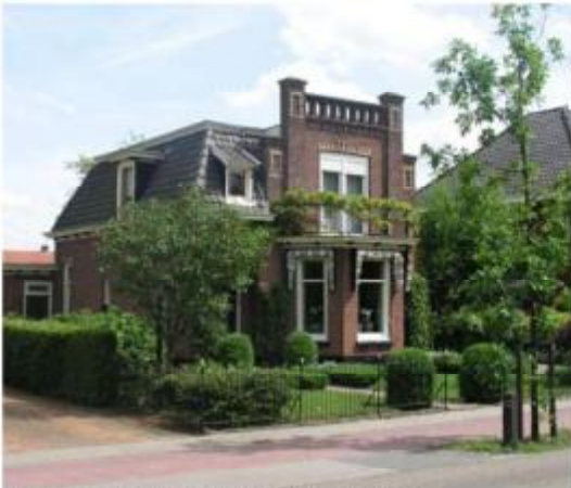
Detailering villa met erker, balkon en kroon