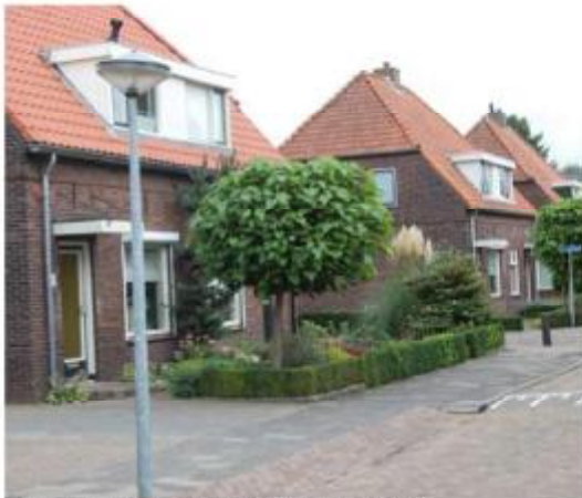
Eenheid in ensemble Frederik Hendrikstraat