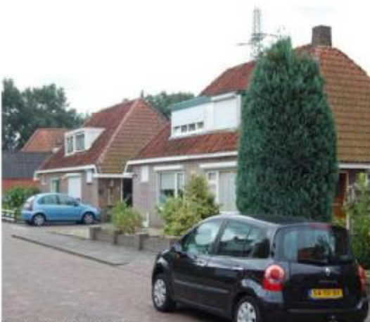
Eenheid in ensemble