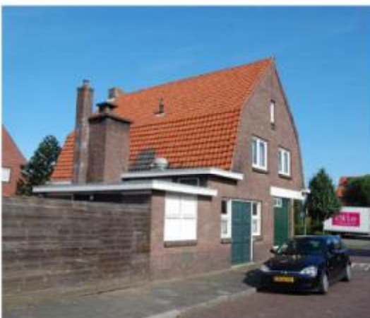
Voormalige slagerij op hoek van het Nassauplein