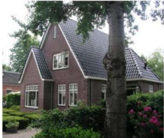
Voorbeeld nieuwe invulling passend in de karakteristiek