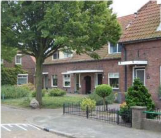
Ensemble karakteristieke panden Frederik Hendrikstraat