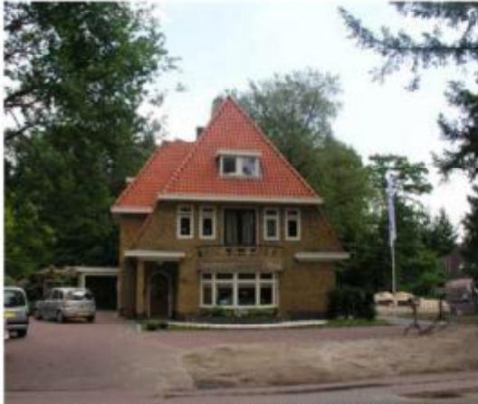
Samengestelde hoofdvorm met een fors zadeldak. Details in vorm van erker/ balkon. Geel metselwerk, rode pannen,