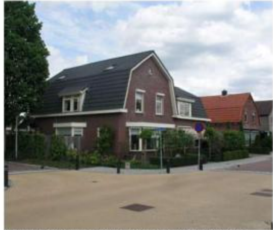
Voorbeeld nieuwe invulling Van Limburg Stirumstraat passend binnen de karakteristiek