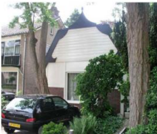
Voormalige tandartspraktijk Joncheerelaan