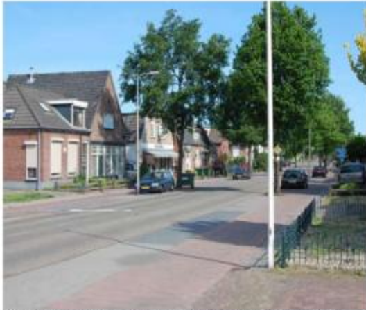
Zuidelijk deel Joncheerelaan (uitloper centrumgebied)