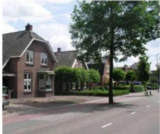
Noordelijk deel Joncheerelaan (laankarakter)