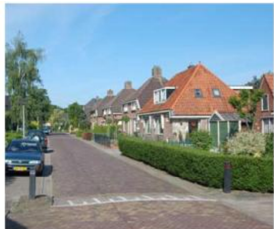
Boerderijwoningen Prins Hendrikstraat