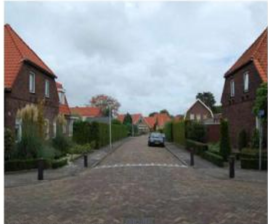
Poortwerking entree Emmastraat