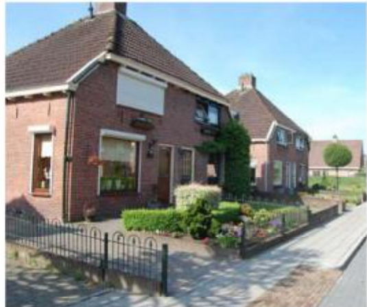
Ensemble boerderijwoningen zuidzijde Van Limburg Stirumstraat