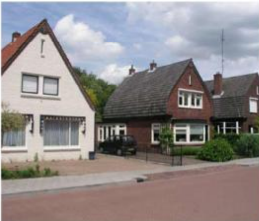
Ensemble vrijstaande woningen noordzijde Van Limburg Stirumstraat