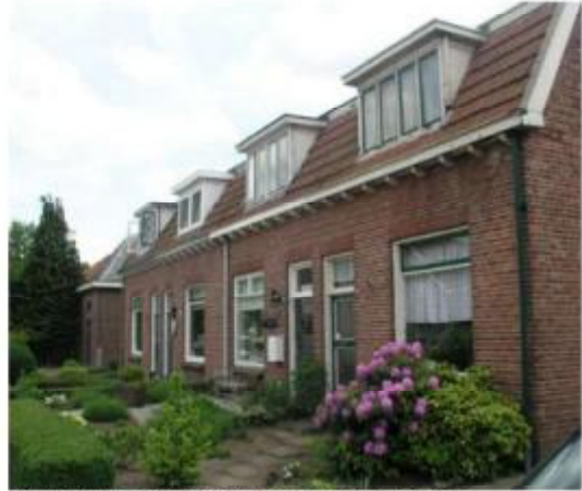
Eenheid in gevelbeeld en dakkapellen per blok