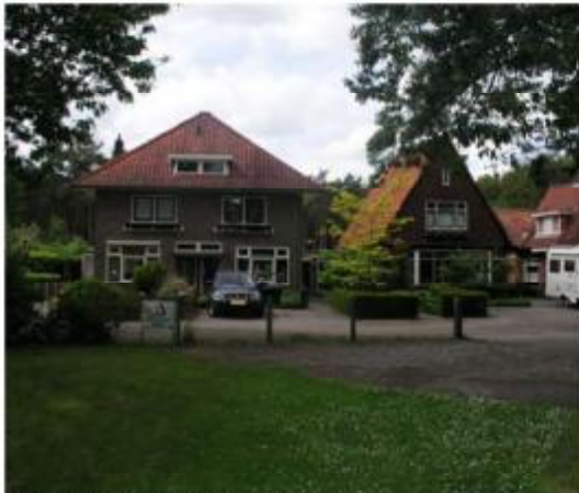
Parkweg (bebouwing in het groen)