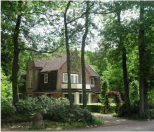
Vrijstaande Villa (Joncheerelaan150)