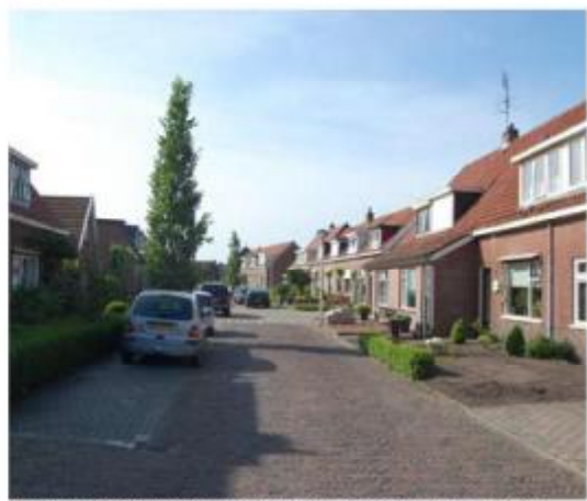
Beeldverstoring door aanbrengen uitbouw voor rooilijn