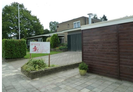
Afbeelding 3 de te slopen nagelstudio