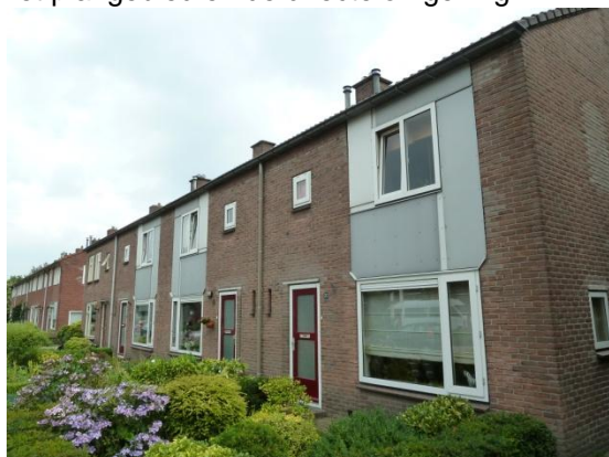
Afbeelding 1 voorkant van het huizenblok van af de Dahliastraat

Onderstaande foto's geven een impressie van het plangebied en de directe omgeving: