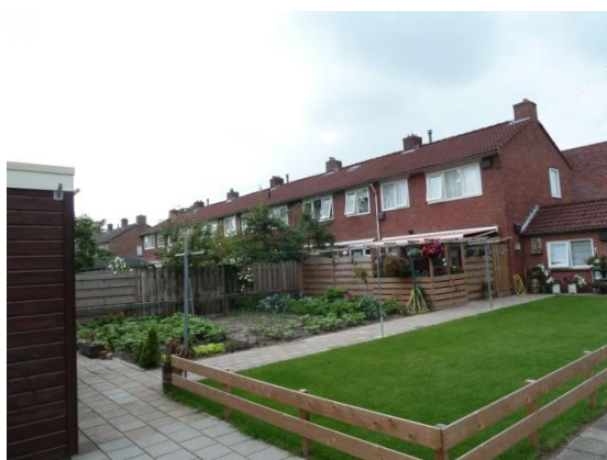
Afbeelding 2 achterkant huizenblok