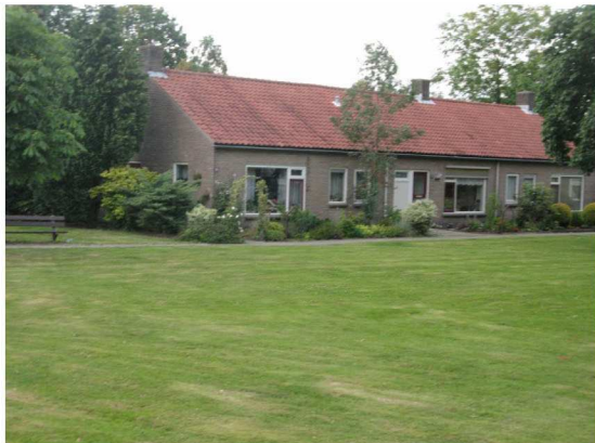
Figuur 4: Helmestraat met seniorenwoningen voorzien van een pannendak. Er is veel ruimte voor groen.