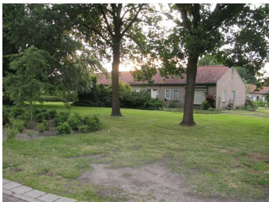
Figuur 5: Helmestraat. Tussen de woningblokken liggen boomweiden met her en der een heestervak.