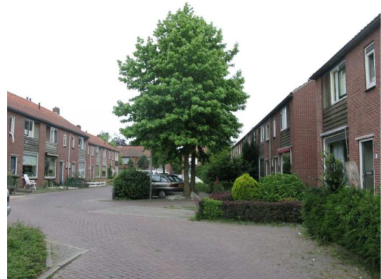
Figuur 1: Jan Luykenstraat met de woningblokken en de kleine, overwegend verharde, voortuinen.

Met de Helmerstraat en omgeving wordt het gebied bedoeld dat tussen de Rijssensestraat en de Nicolaas Beestraat ligt. Het betreffen hier 5 woningblokken voor senioren welke opgetrokken zijn uit steen en voorzien zijn van een pannendak. Dit deel van de wijk is vrij ruim opgezet waardoor veel ruimte is voor een parkachtige zone met boomweiden. Voor een impressie van dit plangebied wordt verwezen naar figuur 4 en 5.