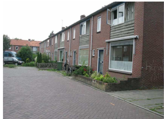
Figuur 2: Roemer Visscherstraat met de woningblokken bestaande uit een gevel met houtbeschet en een pannendak (geldt ook voor de J.Luykenstraat).