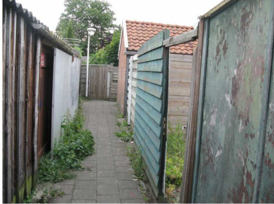
Figuur 3: de steeg achter de woningen bestaat uit kleine, zelfgebouwde schuurtjes en veel schuttingen. Op de achtergrond de uit steen opgebouwde schuurtjes met pannendak