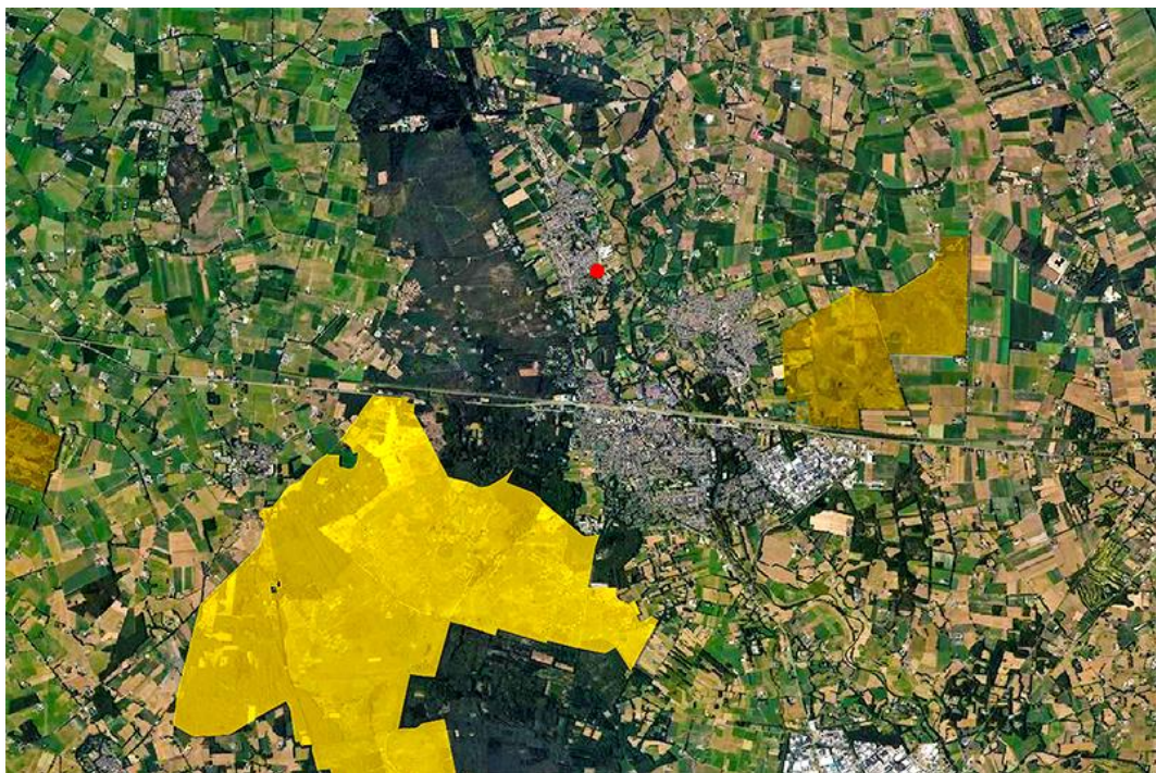
Fig. 5: Globale begrenzing plangebied (rode arcering) versus omliggende N2000 gebieden (gele arcering.).

Enigzins binnen de externe invloedsfeer op een afstand van ca. 2,8 kilometer zuidoostelijk van het plangebied ligt het dichtstbijzijnde N2000-gebied Wierdense Veld (figuur 5). Het N2000 aanwijzingsbesluit is weergegeven in bijlage II. Met behulp van de effectenindicator van het Ministerie kan een oriëntatie worden uitgevoerd naar potentiële (significante) negatieve effecten op kwalificerende soorten door bepaalde activiteiten. De effectenindicator geeft informatie over de meest voorkomende storingsfactoren en de gevoeligheid hiervoor van de aangewezen beschermde Habitat- en Vogelrichtlijnsoorten. In het Wierdense Veld zijn geen beschermde Habitat- en Vogelrichtlijnsoorten aangewezen, waardoor toetsing aan de effecten op beschermde Habitat- en Vogelrichtlijnsoorten van het Wierdense Veld niet aan de orde is. Er wordt niet verwacht dat de geplande ingrepen leiden tot enig negatief effect op de sinds enkele jaren in het Wierdense Veld aanwezige broedpaar kraanvogels of beschermde Habitat- en Vogelrichtlijnsoorten van overige omliggende N2000-gebieden.