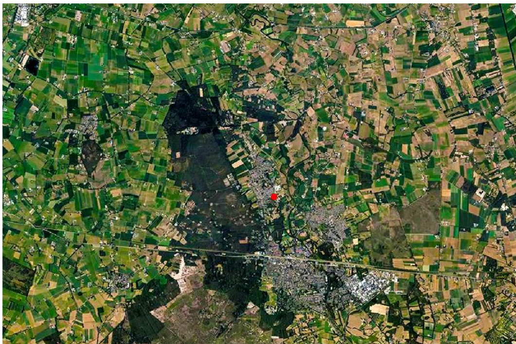
Fig. 4: Globale situering plangebied (rode arcering) versus regio.