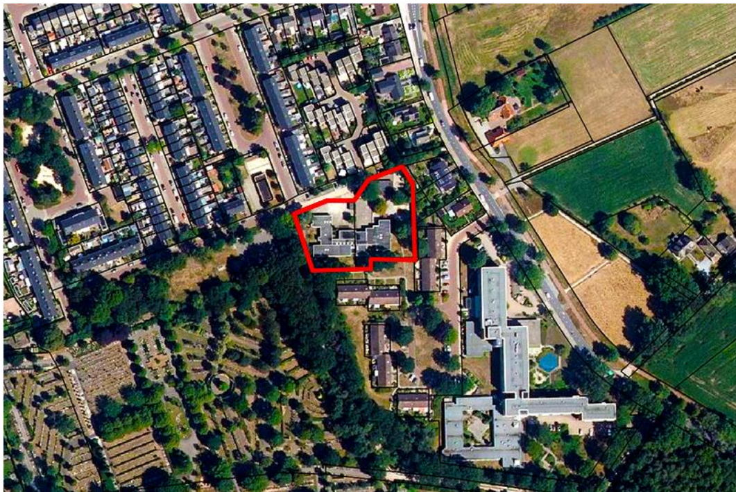
Fig. 3: Globale situering plangebied (rode arcering) versus directe omgeving.