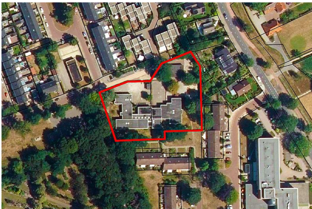
Fig. 2: Globale situering plangebied / onderzoeksgebied (rode arcering).

Gepland staat het schoolgebouw te slopen en omliggend grijs en groen te verwijderen ten bate van toekomstige woningbouw. De daaruit voortvloeiende ingrepen zijn het amoveren van de opstallen, verwijderen omliggend grijs en groen en vlak trekken van de gronden. In de toekomst bouwrijp maken van de gronden en het nieuwbouwen van woningen met bijbehorende delen. In figuur 2 wordt de globale situering van het plangebied weergegeven (rode arcering). In figuur 3 en 4 volgt een verdere uitzooming van het plangebied (rode arcering) in de omgeving en regio. Foto's van het plangebied zijn opgenomen in bijlage I.