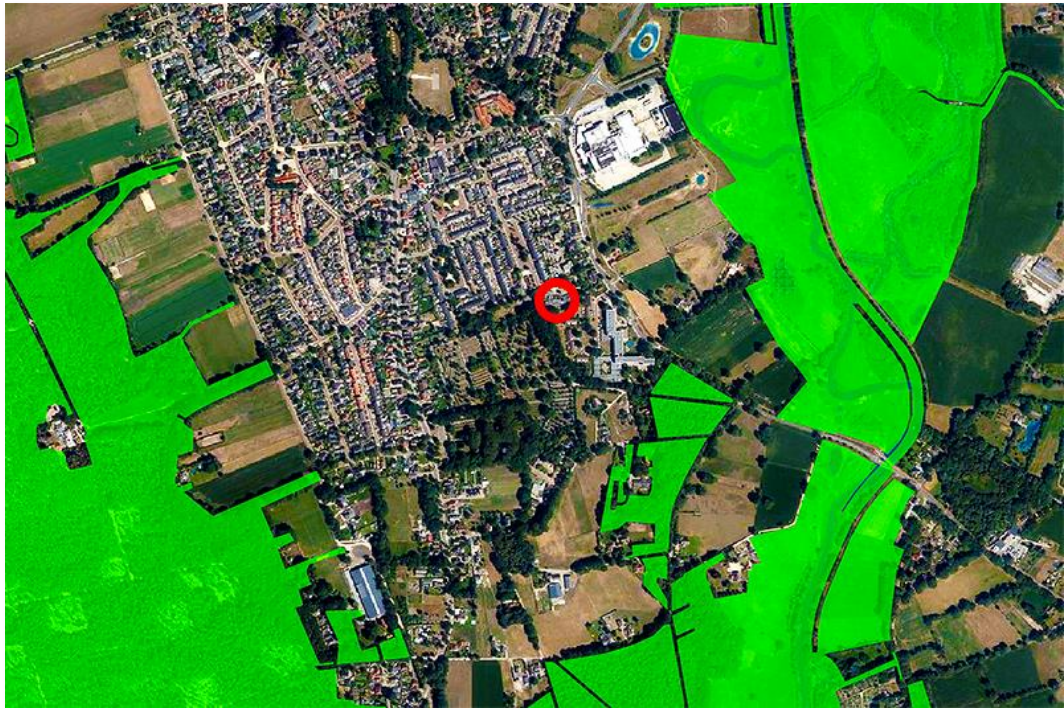
Fig. 7: Plangebied (rode arcering) versus omliggende NNN gebieden (groene arcering.).