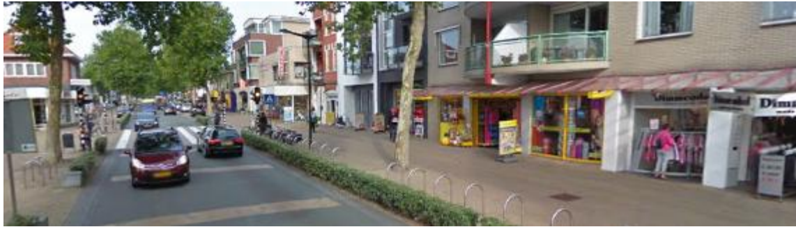
Centrum Nijverdal: matig stedelijk