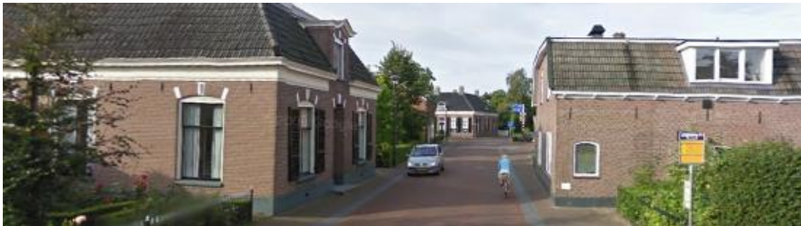
Overig gebied van Nijverdal en Hellendoorn: weinig stedelijk