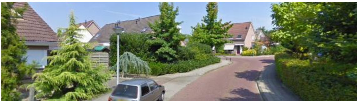
Hulsen, Daarle, Daarlerveen en Haarle: niet stedelijk