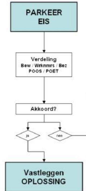
Figuur 3: Schema vastleggen oplossing

Het vastleggen van parkeerafspraken voor ontwikkelingen geeft de gemeente de mogelijkheid om te kunnen controleren of de parkeeroplossingen worden gebruikt zoals ze zijn afgesproken. Maar het vastleggen van de afspraken gebeurt ook om geen onduidelijkheid te laten bestaan over situaties die zich in de toekomst kunnen afspelen.