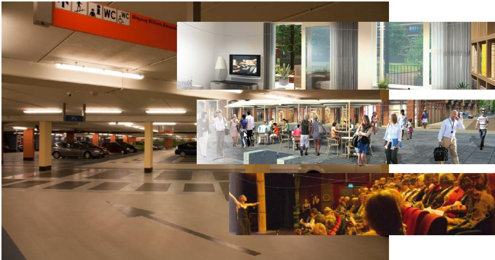
Parkeergarage voor bezoekers, bewoners en werkers