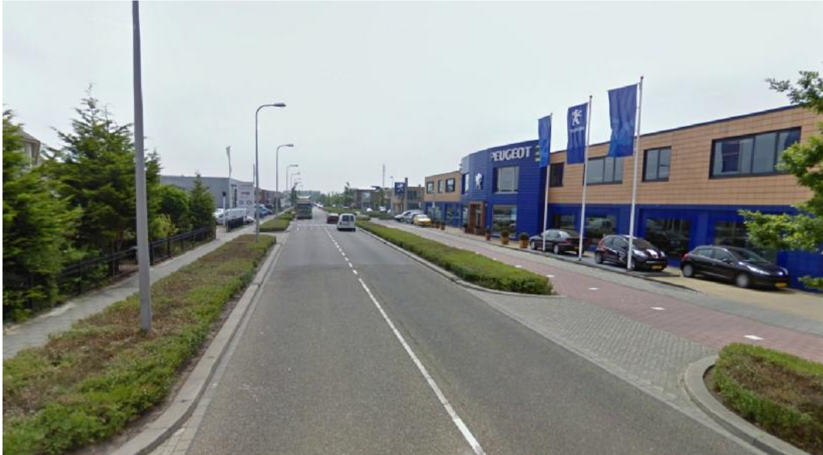
Bedrijventerrein waar uitsluitend op eigen terrein geparkeerd mag worden.