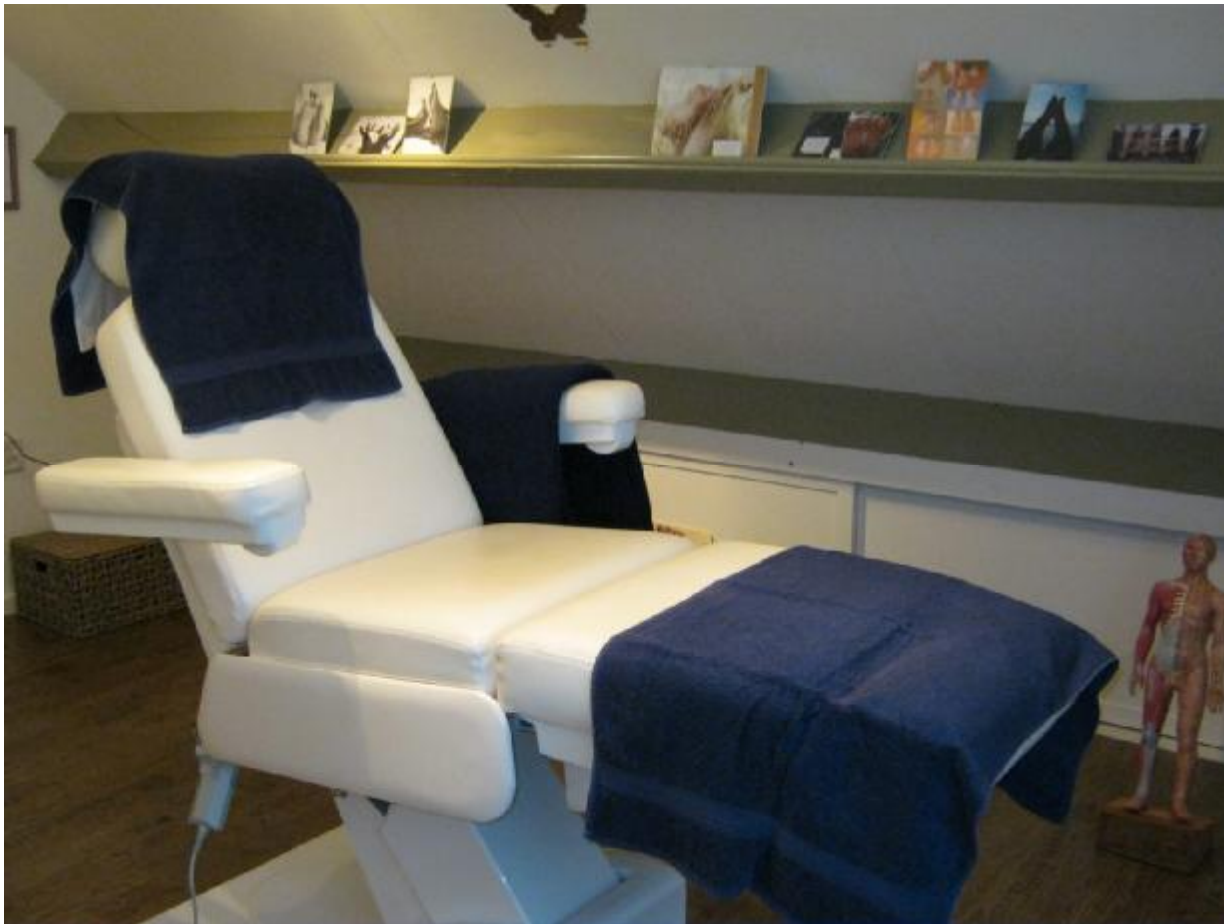
Praktijk (commerciële ruimte) aan huis (op zolder)