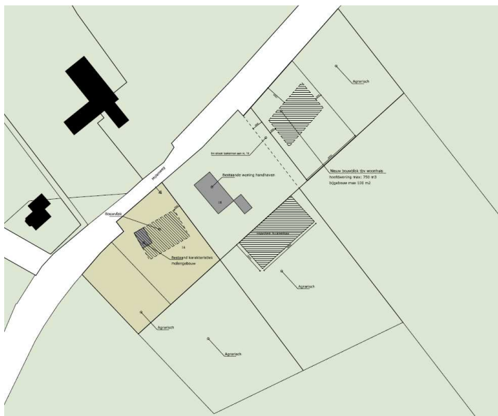
Wenselijke nieuwe situatie.

Op onderstaande afbeelding wordt een verbeelding van het nieuwe erf weergegeven.