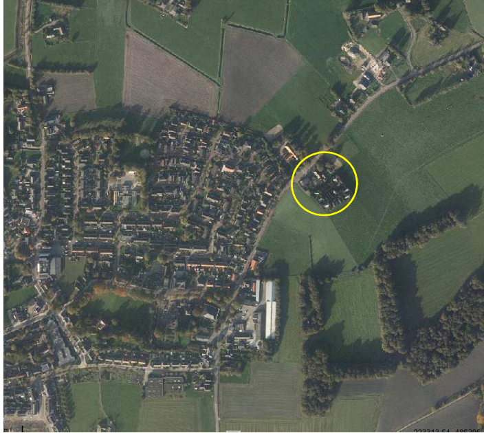
Globale ligging van het plangebied in de omgeving. Het plangebied wordt met de cirkel aangeduid.

Het plangebied is gesitueerd aan de Molenweg 16 in Haarle. Het ligt aan de oostrand van Haarle. Het plangebied omvat het perceel Molenweg 16 in Haarle alsmede een aangrenzend perceel (S902, naast nr. 18). Opgemerkt wordt dat het huidige erf behorend nr. 18 overeenkomstig huidige situatie wordt gehandhaafd. Op onderstaande afbeelding wordt de globale ligging van het plangebied weergegeven met de cirkel.