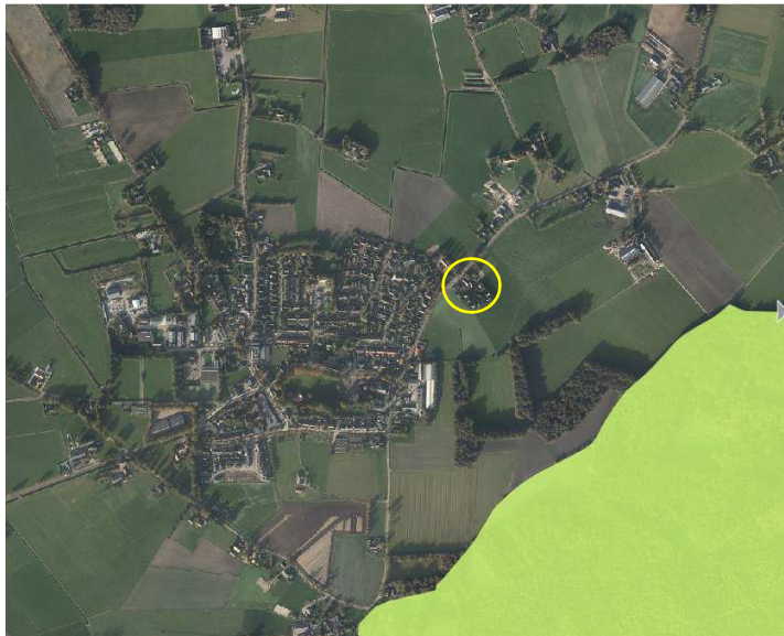
Ligging van Natura 2000-gebied nabij het plangebied. Het plangebied wordt met de cirkel aangeduid.

Het plangebied ligt niet in, of direct naast een Natura 2000-gebied. Op 450 meter ten oosten van het plangebied ligt het Natura2000-gebied Sallandse Heuvelrug. Op onderstaande afbeelding wordt de ligging van dit Natura 2000-gebied weergegeven.