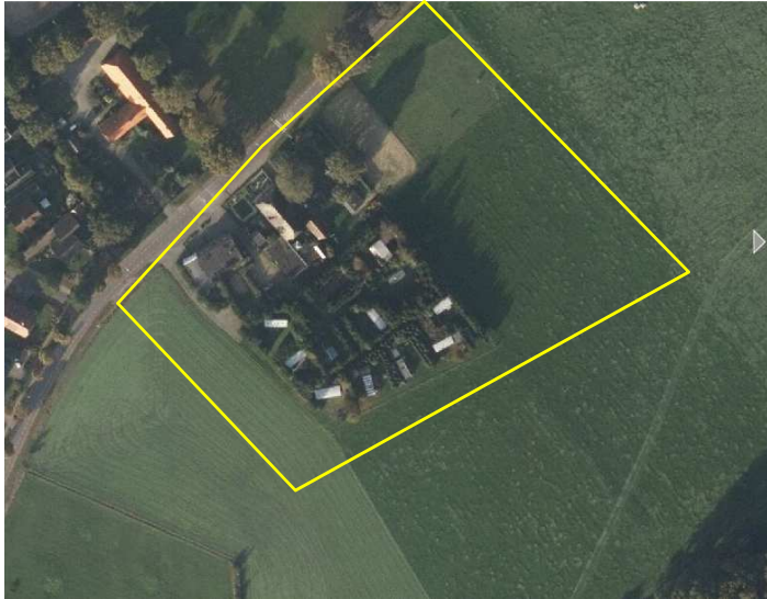
Detailopname van het plangebied. Het plangebied wordt met de lijn aangeduid.