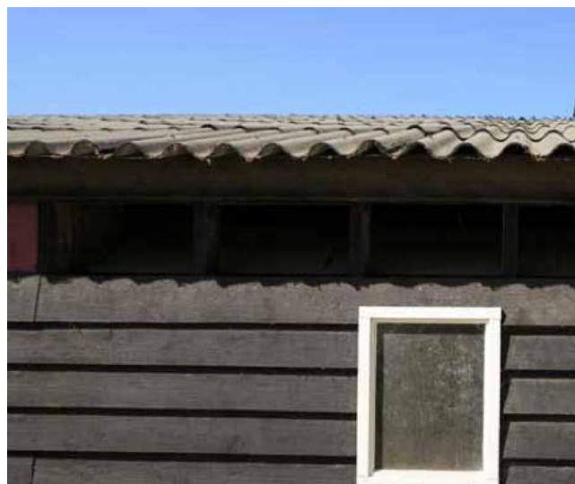
de stallen worden bekleed met gepotdekseld hout