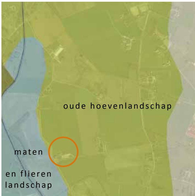
Laag van agrarisch cultuurlandschap