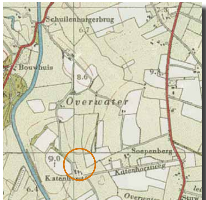
het landschap rond 1950