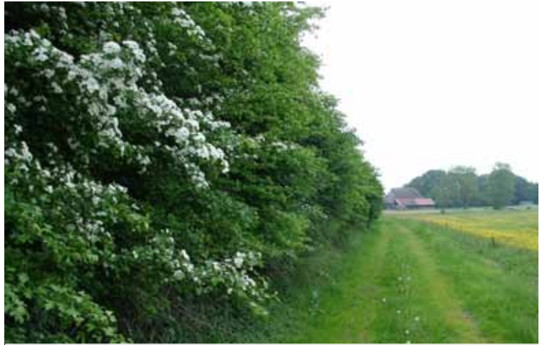
houtsingels schermen het erf deels af