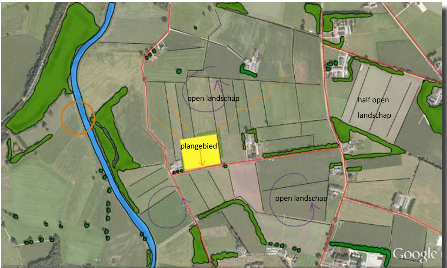
structuren in het landschap als basis voor de landschappelijke inpassing