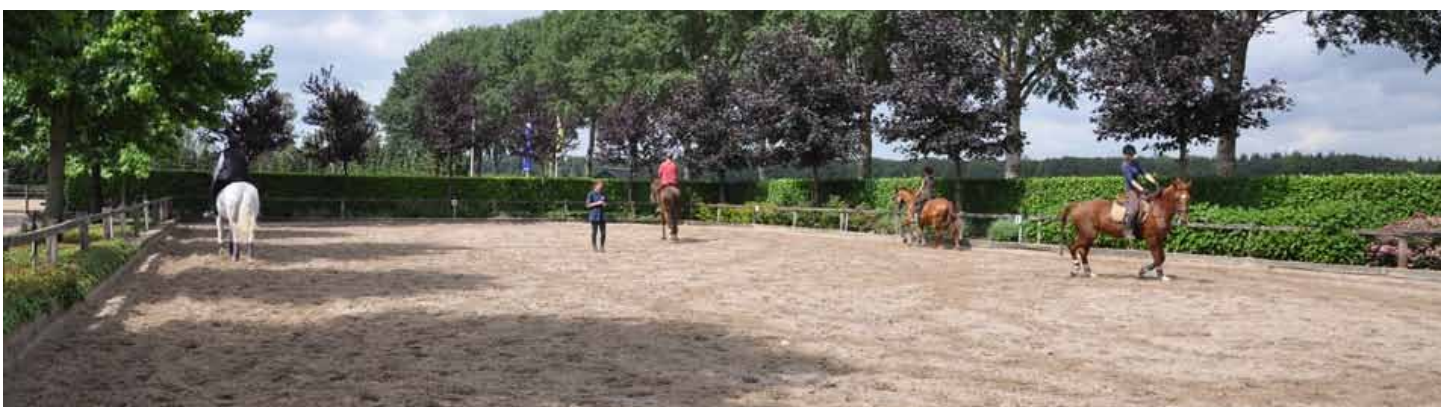
de rijbak op het 'voor' erf krijgt een lage afscherming en een representatief karakter