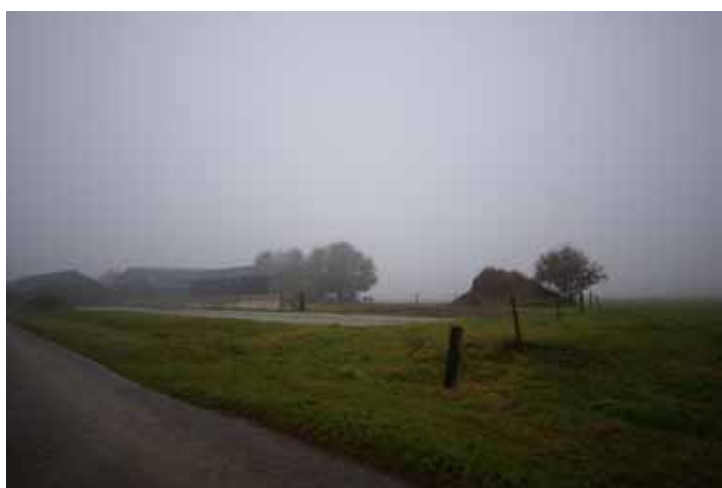
De oostzijde van het huidige bedrijf