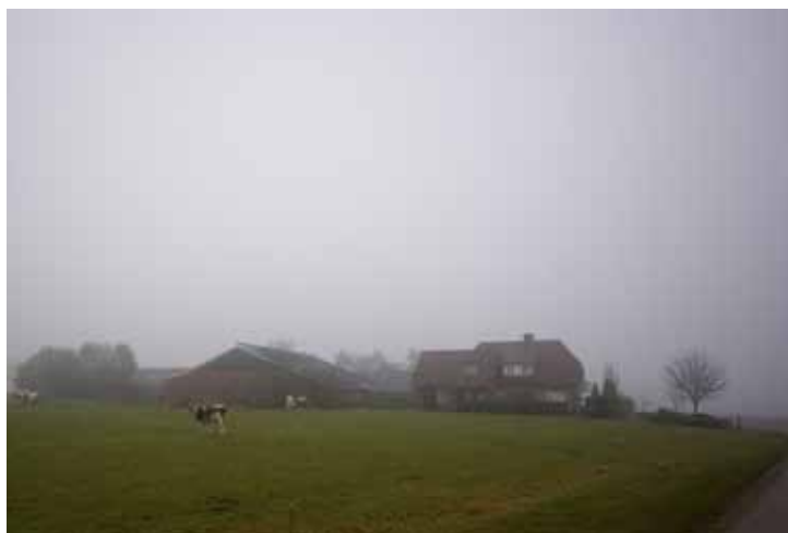
Het bestaande erf aan de Katenhorstweg

Het erf kent een vrij traditionele opbouw. De woning met siertuin staat aan de voorzijde van het erf. Daarachter staan de stallen, ontsloten vanaf één centraal plein en vervolgens, aan de achterzijde de kuil en mestopslagen. Het erf kent drie ontsluitingen aan de Katenhorstweg. Langs deze weg staan enkele zomereiken die eigendom van de gemeente Hellendoorn zijn.