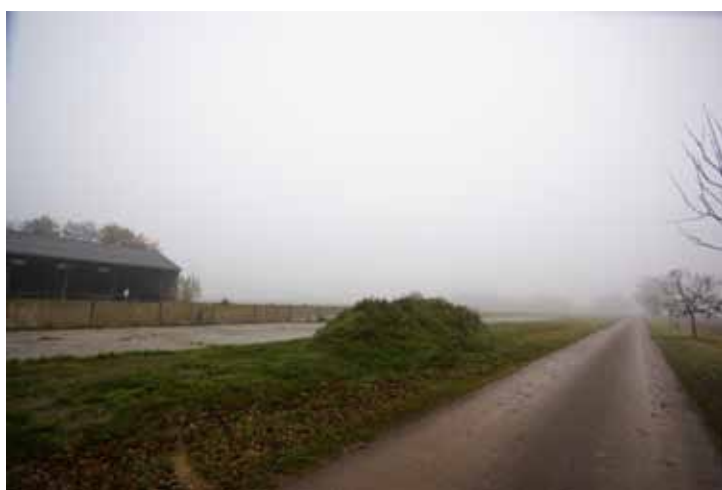
De Katenhorstweg als ontginningsas