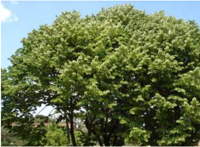
bomen geven het erf massa