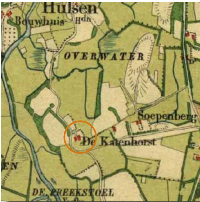
het landschap rond 1900