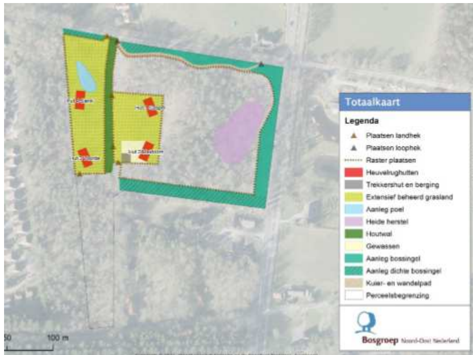
Verbeelding van het wenselijke eindbeeld

Er zijn concrete plannen om vier recreatieverblijven, een trekkershut en een sanitairgebouw te bouwen in het plangebied. In het kader van de Kwaliteitsimpuls Groene Omgeving wordt een voormalig heideterreintje, gelegen in het bos ten oosten van de recreatieverblijven, hersteld. De bomen op het toekomstig heideterreintje worden gerooid en de humusrijke bovenlaag wordt verwijderd (plaggen). Daarnaast wordt er een poel aangelegd en wordt de rand van het bos gedund. Op onderstaande afbeelding wordt het wenselijke eindbeeld van het plangebied weergegeven.