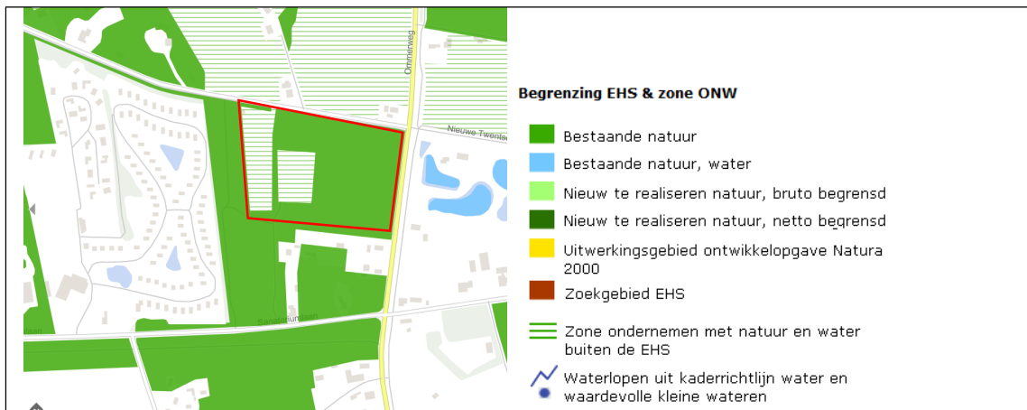
Ligging van het NNN nabij het plangebied. Het plangebied wordt met de rode lijn aangeduid.

Het plangebieden ligt deels in het NNN (groene kleur) en behoort deels tot de 'Zone ondernemen met natuur en water buiten de EHS' (groene arcering). Op onderstaande afbeelding wordt de ligging van het NNN in de omgeving van het plangebied weergegeven. De begrenzing van het plangebied wordt met de rode lijn aangeduid.