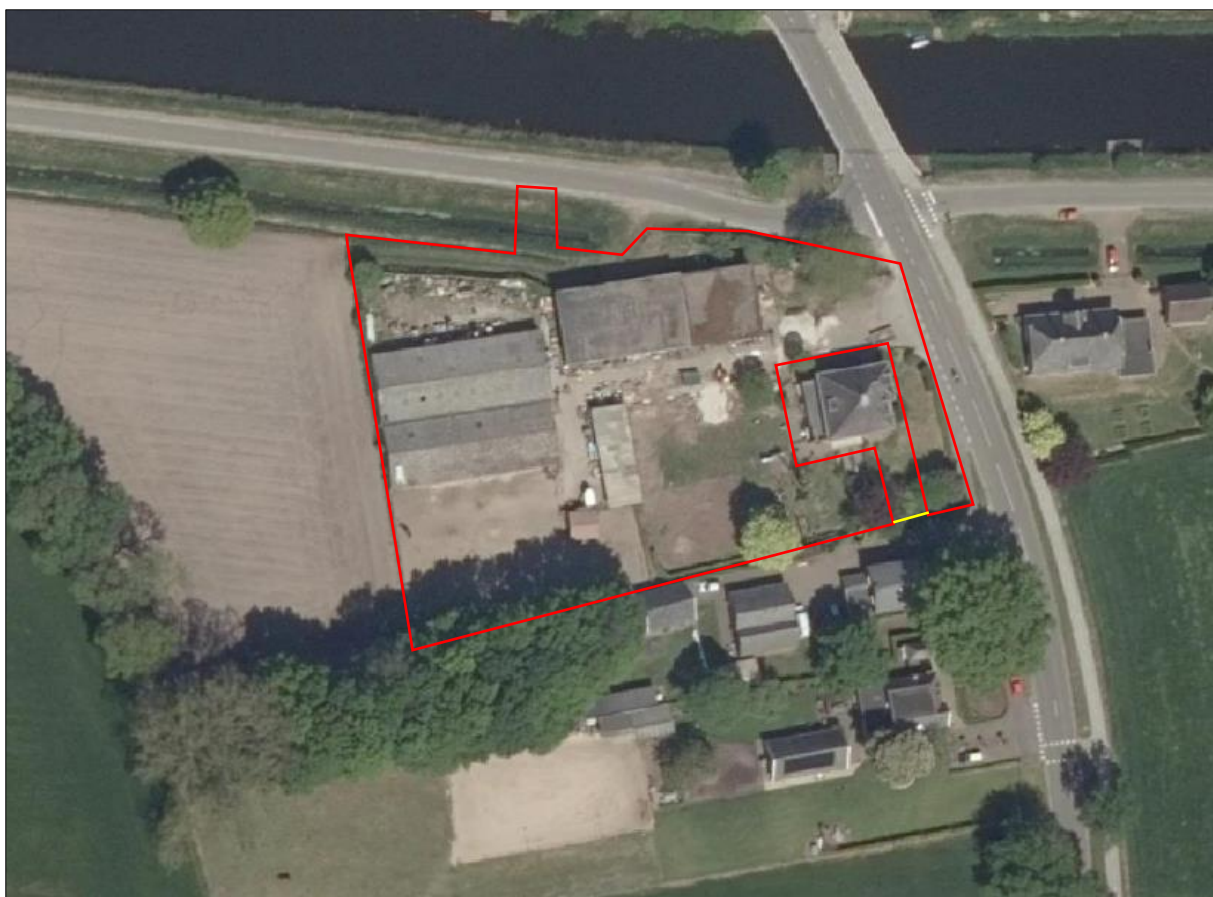
Begrenzing van het plangebied (gele lijn) en het onderzoeksgebied (rode lijn).