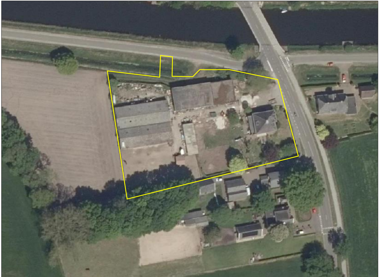
Begrenzing van het plangebied; deze wordt met de gele lijn aangeduid (bron luchtfoto: ruimtelijkeplannen.nl).