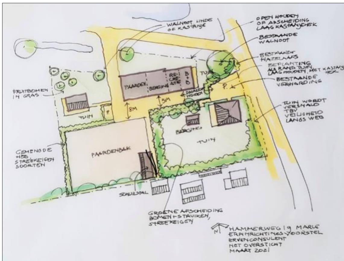
Plattegrond van het wenselijk eindbeeld.

Het voornemen bestaat om één extra woning in het plangebied te realiseren en het meest oostelijk gelegen bedrijfsgebouw intern te verbouwen tot paardenverblijf, berging en recreatie (B+B). Deze (verbouw)werkzaamheden bestaan o.a. uit het strippen van het bedrijfsgebouw, het leggen van vloeren en het uitvoeren van metselwerk. Aangenomen wordt dat het dak behouden blijft. De meest westelijk gelegen bedrijfsgebouwen, de kapschuur en het schuilhok worden gesloopt. De paardenbak wordt vergroot aan de oostzijde en er wordt een schuilstal in de paardenbak gerealiseerd. Tevens wordt er een berging in de tuin gebouwd. Het oostelijke deel van de tuin wordt versmald i.v.m. veiligheid langs de weg. Voor het versmallen van de tuin dienen er enkele heesters en scheerhagen te worden verwijderd. Er wordt verder geen beplanting in het plangebied verwijderd. Het erf wordt d.m.v. een nieuw aan te leggen verharde weg in verbinding gebracht met de Zuidelijke Kanaaldijk. Aangenomen wordt dat een deel van de bestaande erfverharding verwijderd en vervangen wordt en dat er nieuwe erfverharding wordt aangelegd. Het plangebied wordt nadien landschappelijk ingepast, middels aanplant van erfbeplanting, loofbomen (walnoot, linde of kastanje) en fruitbomen. Op onderstaande afbeelding is een plattegrond van het wenselijk eindbeeld weergegeven.