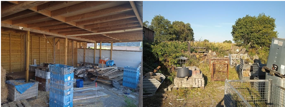
Amfibieën kunnen een vaste (winter)rustplaats bezetten onder goederen/materialen opgeslagen in de bebouwing en verspreid in de buitenruimte.

bebouwing en verspreid in de buitenruimte. De drie bedrijfsgebouwen zijn voor amfibieën niet toegankelijk en daardoor niet geschikt om een (winter)rustplaats in te bezetten. Het plangebied wordt niet als functioneel leefgebied van zeldzame amfibieënsoorten als kamsalamander, rugstreeppad of poelkikker beschouwd. Geschikt voortplantingsbiotoop ontbreekt in het plangebied.