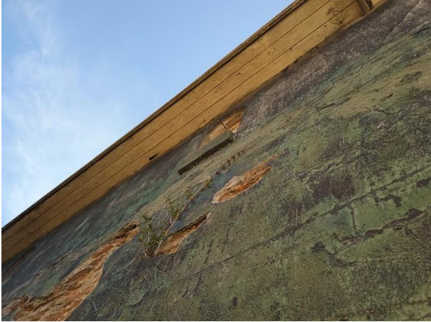
De betimmering van het dak overstek sluit naadloos aan op de buitengevels.

Door het uitvoeren van de voorgenomen activiteiten wordt geen vleermuis verstoord of gedood en wordt geen vaste rust- of voortplantingsplaats verstoord, beschadigd of vernield.