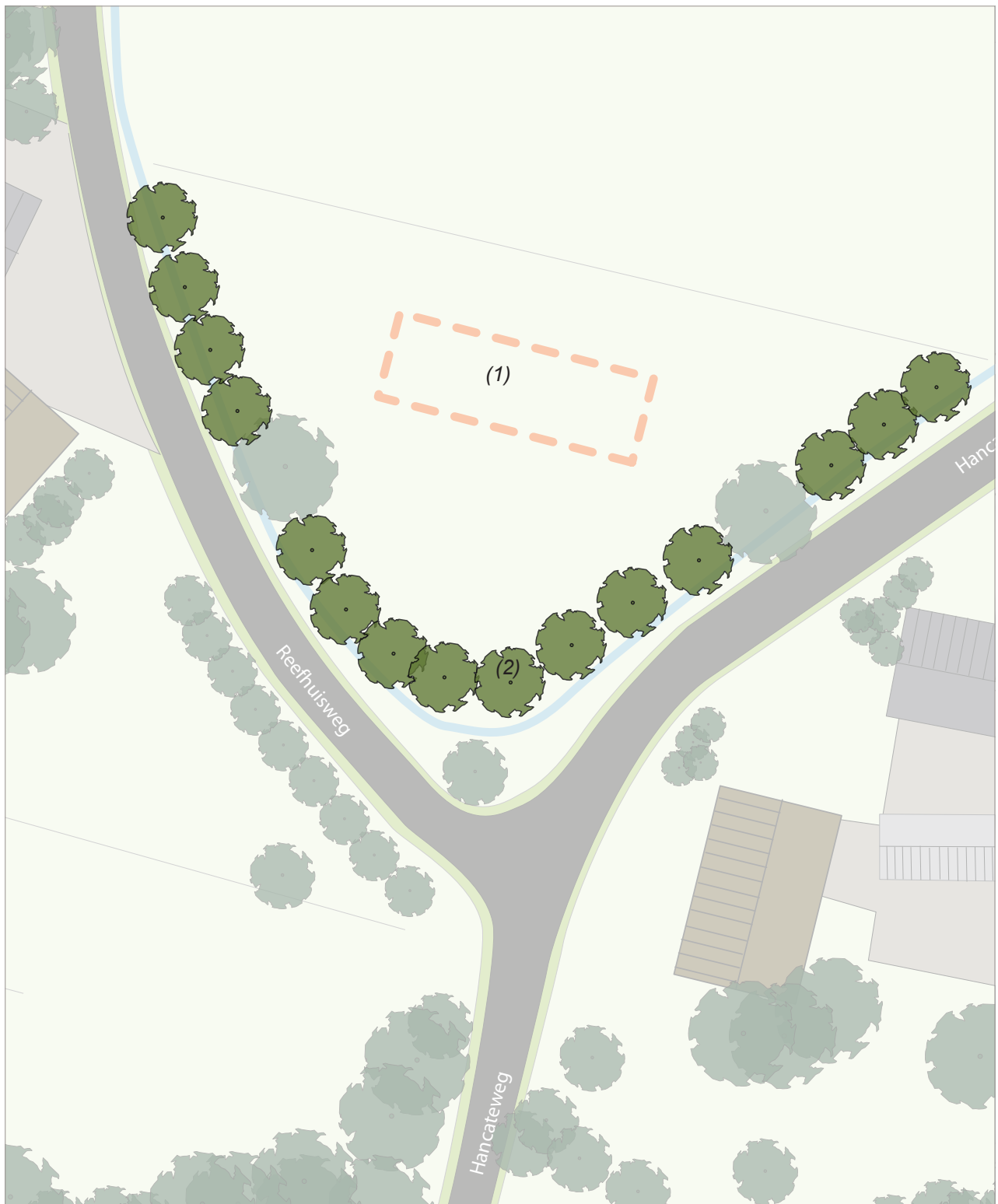
Afbeelding 27: IBeplantingsplan Reefhuisweg - Hancateweg