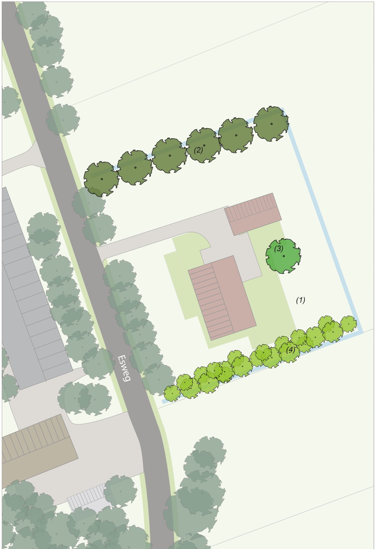
Afbeelding 28: Inrichtingsschets Esweg 19b