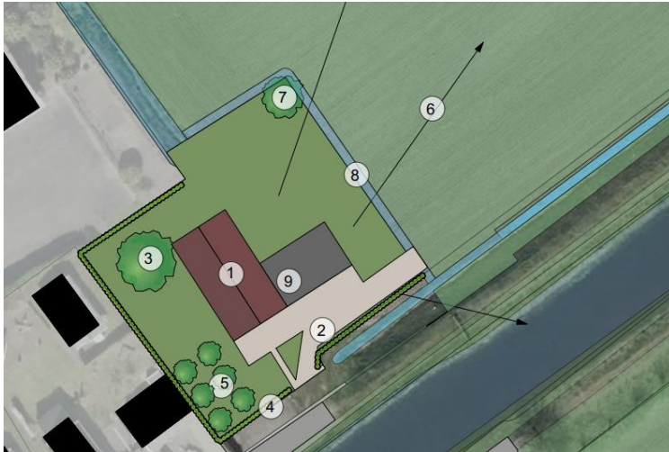
Verbeelding van het wenselijke eindbeeld van deelgebied Brugstraat.

Het voornemen bestaat de bebouwing in deelgebied Reefhuisweg en Hammerweg te slopen en een vrijstaande woning te bouwen in deelgebied Brugstraat. Vermoedelijk zal een deel van de erfverharding in deelgebied Reefhuisweg en de heesters rondom de stal aan de Hammerweg, verwijderd worden. De ondergrond van de slooplocaties wordt ingericht als erf of agrarische cultuurgrond. Om de woning te kunnen bouwen wordt een bestaande kavelgrenssloot verlegd. Het nieuwe erf aan de Brugstraat wordt landschappelijk ingepast middels de aanplant van erfbeplanting. Op onderstaande afbeelding wordt een verbeelding van het wenselijke eindbeeld in deelgebied Brugstraat weergegeven.