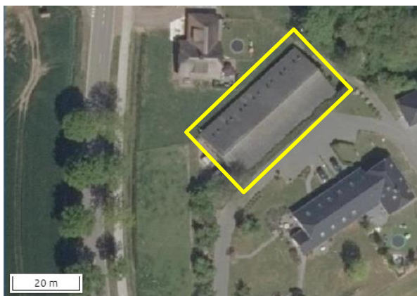
Begrenzing van deelgebied Hammerweg; deze wordt met de gele lijn aangeduid.