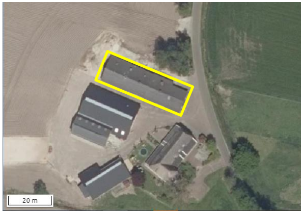
Begrenzing van deelgebied Reefhuisweg; deze wordt met de gele lijn aangeduid.

Beide deelgebieden bestaan volledig uit bebouwing. In beide deelgebieden staat een voormalige varkensstal met bakstenen buitengevels en golfplaten dakbedekking. De stallen staan geruime tijd leeg. In de stal aan de Reefhuisweg is de dakisolatie reeds verwijderd en zijn openingen in de zijgevel aangebracht. Rondom de stal Reefhuisweg ligt erfverharding. Rond de stal aan Hammerweg staan heesters. Op onderstaande luchtfoto's worden de onderzochte opstallen in de deelgebieden weergegeven.