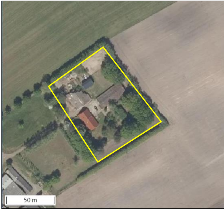
Begrenzing van het plangebied wordt met de gele lijn aangeduid.