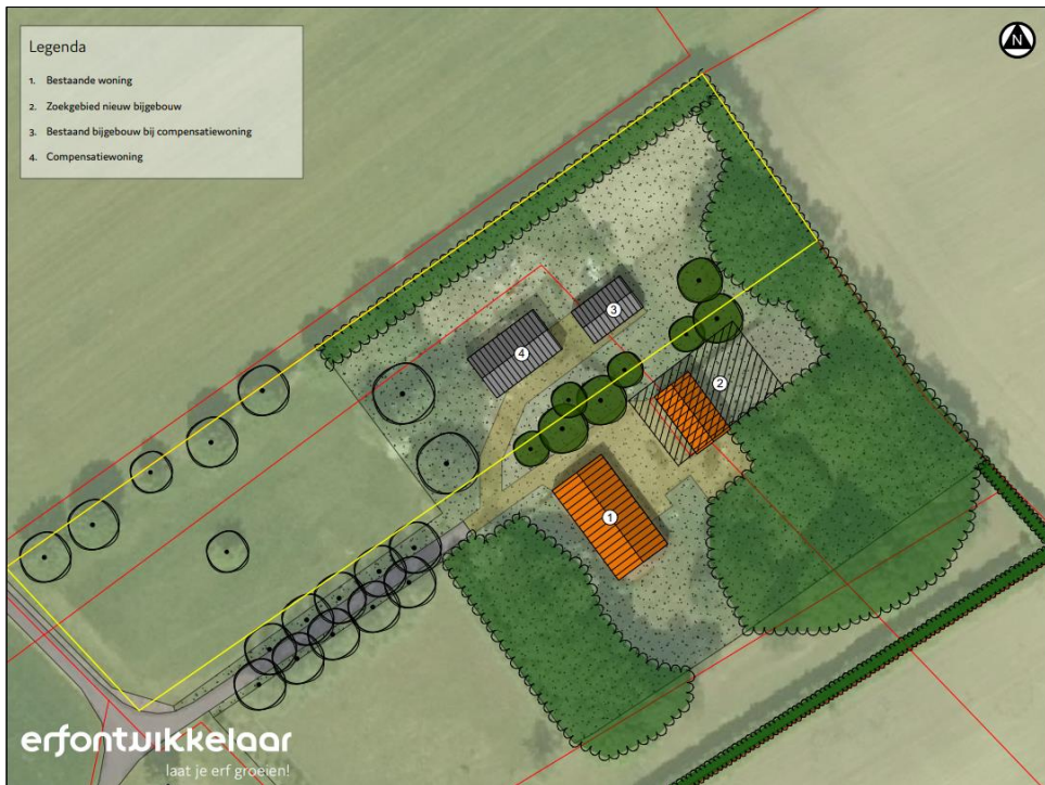
Plattegrond van het wenselijke eindbeeld.

Het voornemen bestaat om een woning en een bijgebouw te realiseren. Er wordt geen opgaande beplanting gerooit tijdens de voorgenomen werkzaamheden. De sloopwerkzaamheden zijn reeds uitgevoerd en de bouwlocaties zijn reeds bouwrijp gemaakt. De bestaande woning en schuur blijven behouden. Nadien wordt het plangebied landschappelijk ingepast met diverse beplanting. Op onderstaande afbeelding wordt een plattegrond van het wenselijke eindbeeld weergegeven.