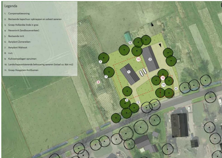
Verbeelding van het wenselijke eindbeeld.

Het voornemen bestaat om de ligboxenstal en de schuur in de zuidoosthoek van het erf te slopen en een nieuwe woning te bouwen op de plek van de ligboxenstal. De schuur in de noordoosthoek van het plangebied blijft behouden. Mogelijk wordt een deel van de beplanting aan de westzijde gerooid. Het plangebied wordt nadien landschappelijk ingepast door middel van de aanplant van erfbeplanting. Op onderstaande afbeelding wordt een verbeelding van het wenselijke eindbeeld weergegeven.