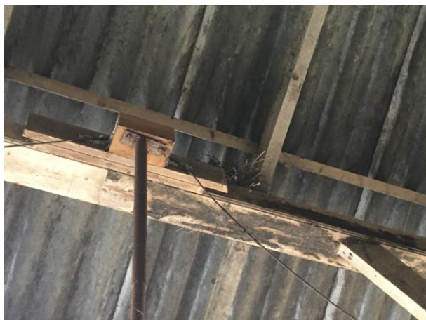
Oud houtduivennest in de houten schuur.

Het plangebied behoort tot functioneel leefgebied van verschillende vogelsoorten. Vogels benutten het plangebied als foerageergebied en vermoedelijk nestelen er jaarlijks vogels in het plangebied. Vogels kunnen een nestlocatie bezetten in de te slopen schuren en de beplanting. Vogelsoorten die mogelijk in het plangebied nestelen zijn merel, houtduif, winterkoning, koolmees, pimpelmees, boomkruiper en holenduif. Er zijn geen huismussen in het plangebied waargenomen en er zijn geen geschikte nestmogelijkheden voor huismussen aangetroffen. Verder zijn er geen oude nesten van boerenzwaluw of huiszwaluw in het plangebied aangetroffen. In het plangebied zijn tevens geen aanwijzingen gevonden dat steen- of kerkuil een vaste rust- of voortplantingsplaats bezetten. Aanwezigheid van deze soorten in gebouwen is doorgaans gemakkelijk vast te stellen aan de hand van braakballen en schijfsporen. In de bomen die op en rondom het erf staan zijn geen nesten van andere roofvogels aangetroffen.