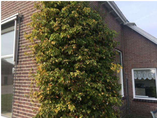
Potentiële nestplaats van vogels in het plangebied.

Het plangebied wordt als functioneel leefgebied voor verschillende vogelsoorten beschouwd. Vogels benutten het plangebied als foerageergebied, en vermoedelijk nestelen er jaarlijks vogels in het plangebied. Vogels kunnen nesten in de beplanting, er zijn geen aanwijzingen gevonden dat vogels in de boerderij nestelen. Er zijn in het plangebied geen huismussen waargenomen en onder de onderste rij dakpannen zijn geen (oude) nesten van de huismus aangetroffen. Vogelsoorten die mogelijk in het plangebied nestelen zijn vink en merel. De boerderij is niet toegankelijk voor uilen om er een vaste rust- of voortplantingsplaats in te bezetten.