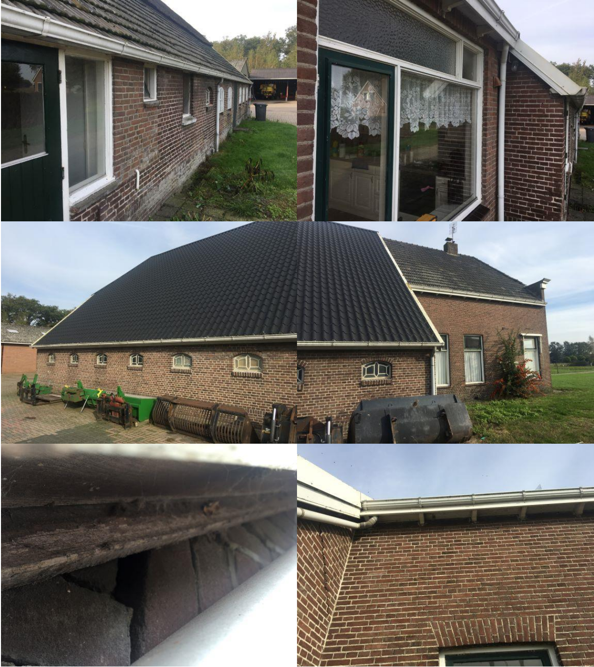
Bijlage 3. Fotobijlage. Impressie van het plangebied en de directe omgeving.