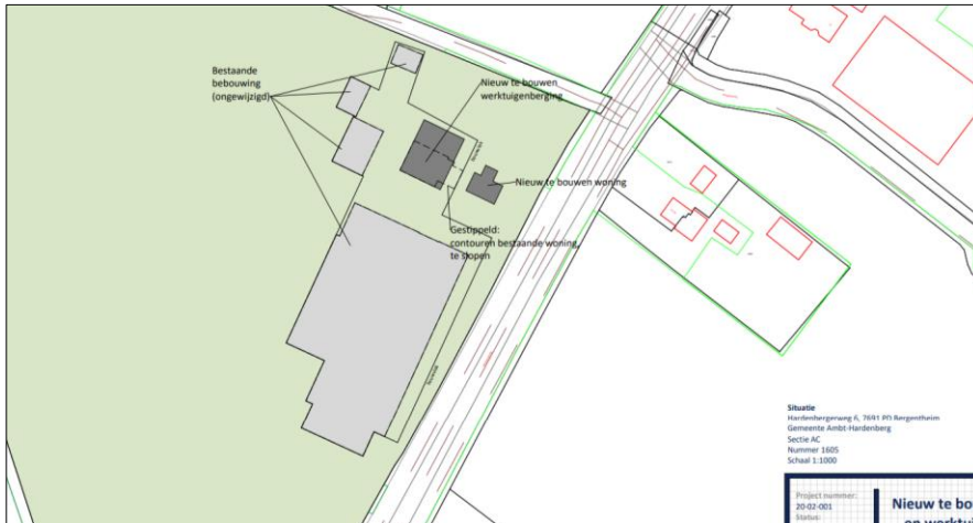
Verbeelding van het wenselijke eindbeeld.

Er zijn concrete plannen om alle bebouwing in het plangebied te slopen en een nieuwe woning en werktuigenberging in het plangebied te bouwen. Het nieuwe erf wordt landschappelijk ingepast middels de aanleg van erfbeplanting. Op onderstaande afbeelding wordt het wenselijke eindbeeld weergegeven.