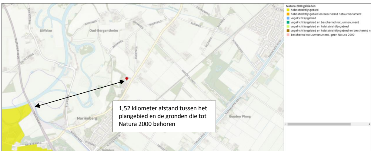
Ligging van Natura 2000-gebied in de omgeving van het plangebied. De ligging van het plangebied wordt met de rode marker aangeduid. Gronden die tot Natura 2000 behoren worden met de okergele kleur aangeduid.

Het plangebied ligt op minimaal 1,52 kilometer afstand van het Natura 2000-gebied Vecht- en Beneden-Reggegebied. Op onderstaande afbeelding wordt de ligging van Natura 2000-gebied in de omgeving van het plangebied weergegeven.