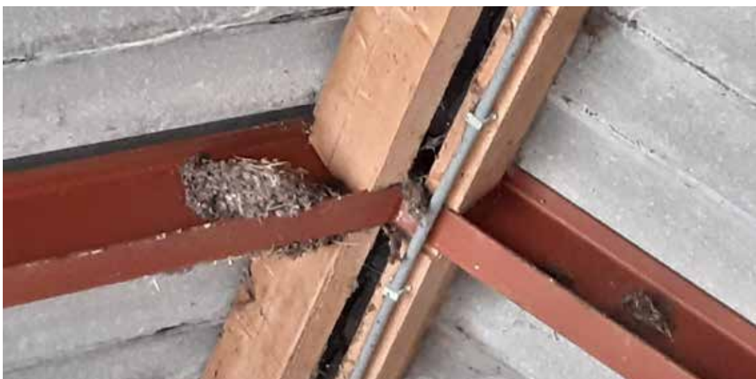
Een oud nest van de boerenzwaluw.