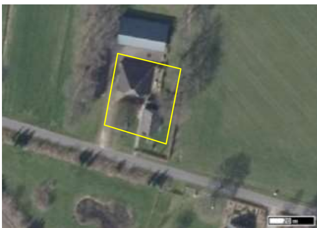
Detailopname van het plangebied. De begrenzing van het plangebied wordt met de gele lijn aangeduid.

In het plangebied vormt een deel van een woonerf en bestaat uit bebouwing, erfverharding, gazon en klimop. In het plangebied staan een woning en een oude schuur. De woning is gebouwd van bakstenen en is gedekt met dakpannen. De woning beschikt over een (holle) spouw en een beschoten kap. De schuur heeft bakstenen gevels en is gedekt met golfplaten, zonder dakisolatie. Een deel van de voorgevel en een muurtje, tussen de woning en de schuur, is bedekt met klimop. Rondom de gebouwen ligt erfverharding of gazon met een soortenarme vegetatie van 'speelgras'. De staat van onderhoud van beide gebouwen is goed; ze zijn wind- en waterdicht. Op onderstaande luchtfoto wordt de ligging van het plangebied op een weergegeven, evenals de begrenzing. Voor een impressie van het plangebied wordt verwezen naar de fotobijlage.