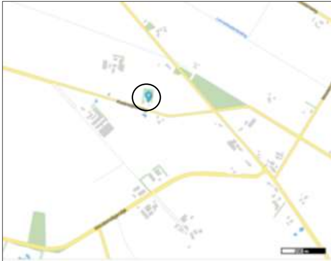
Globale ligging van het plangebied. De ligging van het plangebied wordt met de cirkel aangeduid (bron kaart: PDOK).

Het plangebied is gesitueerd aan de Radewijkerweg 4 te Radewijk. Het plangebied ligt in het buitengebied en wordt aan alle zijden omgeven door agrarisch cultuurland. Op onderstaande afbeelding wordt de globale ligging van het plangebied weergegeven op een topografische kaart.