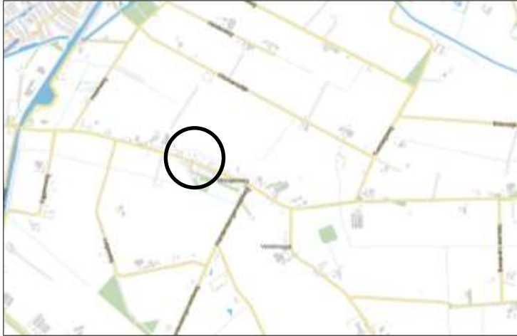
Globale ligging van het plangebied. De ligging van het plangebied wordt met de zwarte cirkel aangeduid.

Het plangebied is gesitueerd op het adres Hoogenweg 34 te Hoogenweg. Het maakt onderdeel uit van lintbebouwing in de buurtschap Hoogenweg. Het grenst aan de voor- en weerszijden aan woningen en openbare ruimte en aan de achterzijde aan agrarisch cultuurland. Op onderstaande topografische kaart wordt de globale ligging van het plangebied weergegeven.