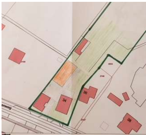
Verbeelding van het wenselijk eindbeeld.

Het concrete voornemen bestaat om alle bebouwing in het plangebied te slopen en een nieuwe schuur in het plangebied te bouwen. Op onderstaande afbeelding wordt een verbeelding van het wenselijke eindbeeld gegeven. Dit is een voorlopig-ontwerp. De definitieve inrichting is nog niet vastgesteld.