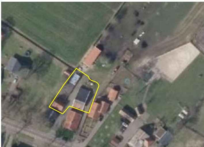
Detailopname van het plangebied. De begrenzing van het plangebied wordt met de gele lijn aangeduid.

Het plangebied vormt een deel van een bestaande (voormalig) agrarisch erf. Het bestaat uit bebouwing en erfverharding. De bebouwing bestaat uit een bakstenen schuur, twee kapschuren en een carport. De bakstenen schuur heeft een met dakpannen gedekt plat dak, de beide kapschuren zijn gedek met damwand dakpanelen of golfplaten. Geen van de gebouwen beschikt over een beschoten kap, dak- of wandisolatie. Op onderstaande afbeelding wordt het plangebied in detail weergegeven, evenals de begrenzing. Voor een verbeelding van het plangebied wordt naar de fotobijlage verwezen.