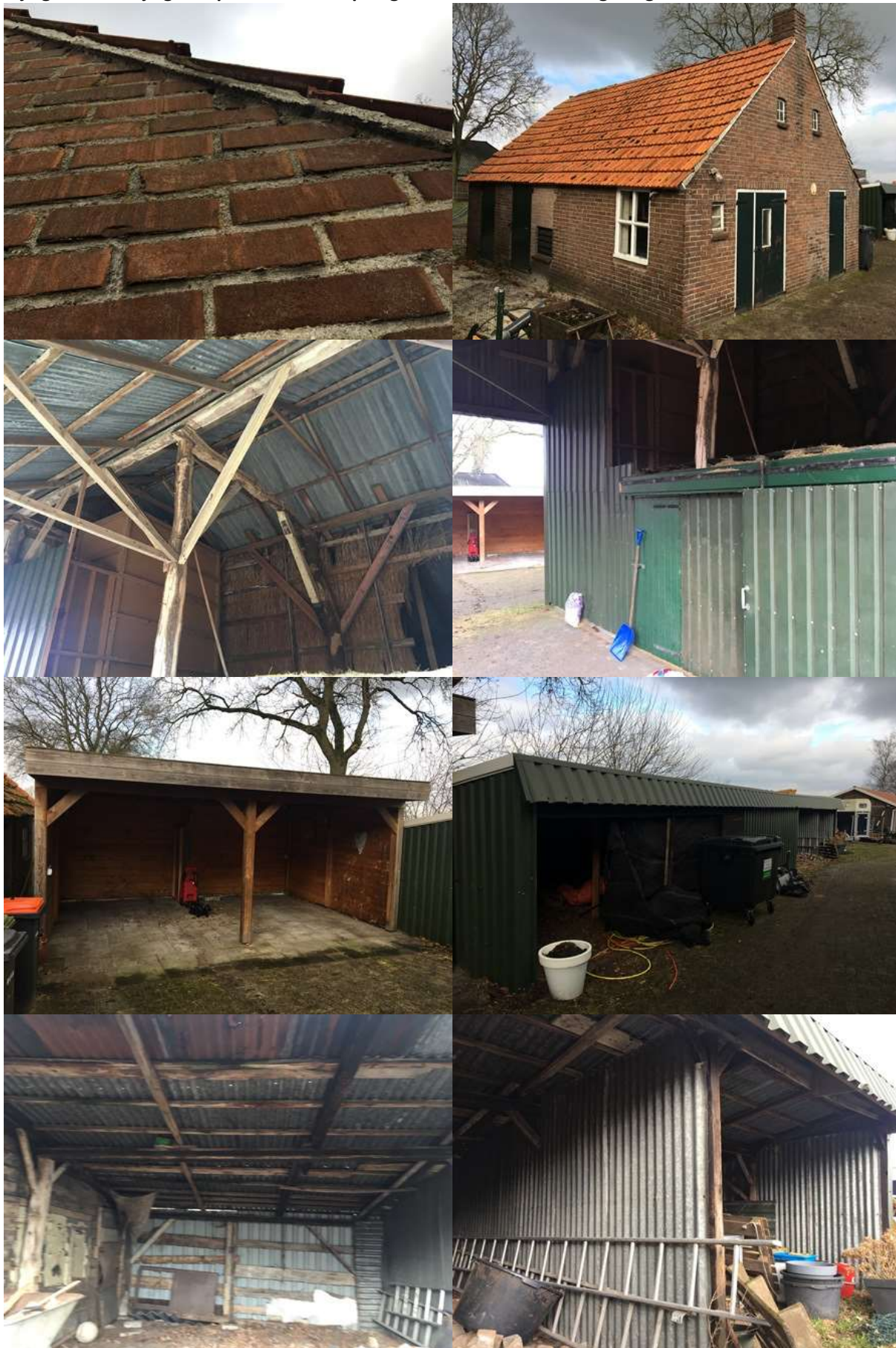
Bijlage 3. Fotobijlage. Impressie van het plangebied en de directe omgeving.