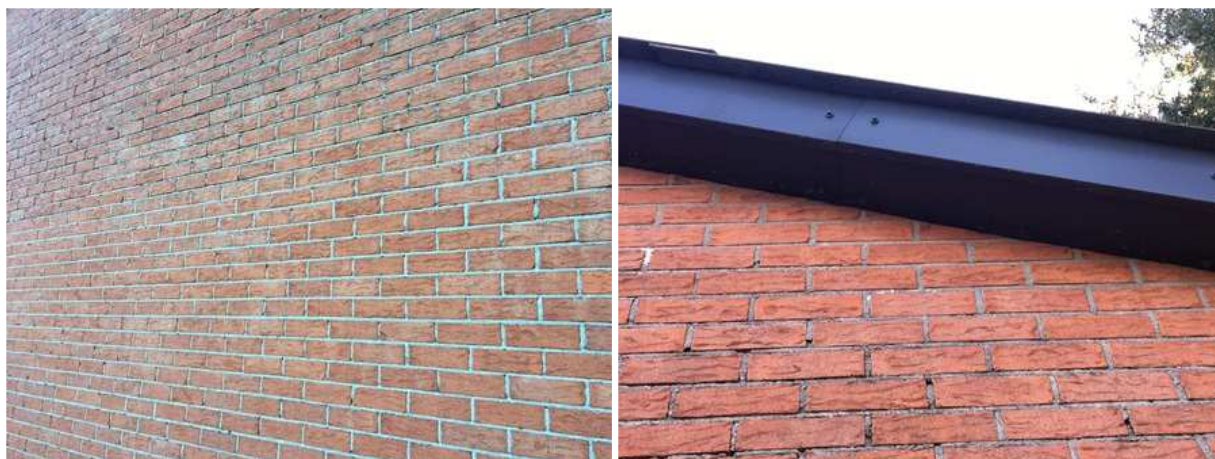
Links: geen open stootvoegen. Rechts: de daklijst sluit nauw aan op de buitengevel. Vleermuizen hebben zo geen mogelijkheid om de spouw te betreden om er een verblijfplaats te bezetten.

Door uitvoering van de voorgenomen activiteiten worden geen vleermuizen verstoord, verwond of gedood en worden geen verblijfplaatsen beschadigd of vernield.