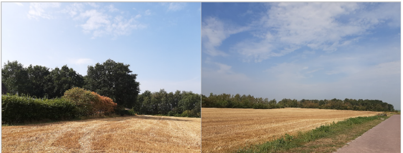
Figuur 3-3. Impressie van het plangebied met links een foto in zuidwestelijke richting en rechts een foto noordelijke richting met een indicatie van de bosschage.