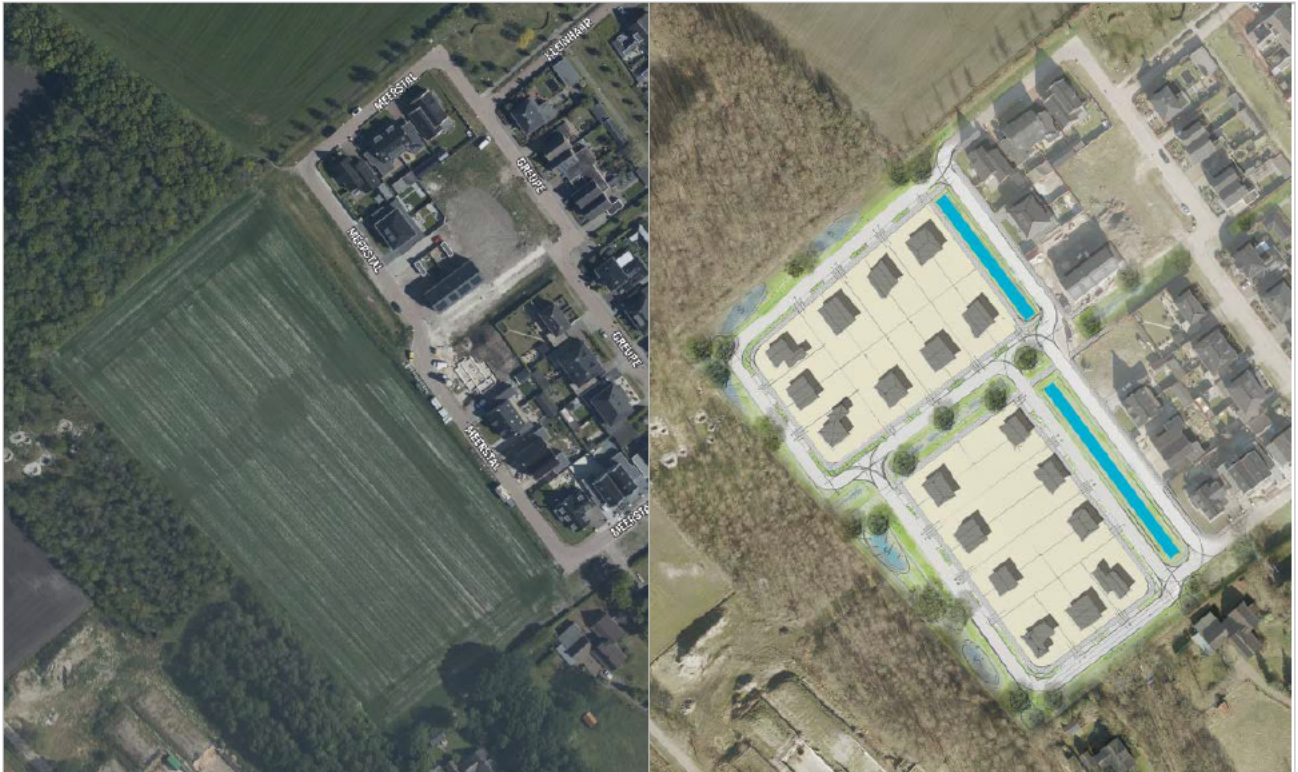
Figuur 3-2. Links een luchtfoto ingezoomd op het plangebied, gelegen aan de Meerstal (bron: Cyclomedia) en rechts een schetsontwerp van de voorgenomen eindsituatie (bron: Gemeente Hardenberg).