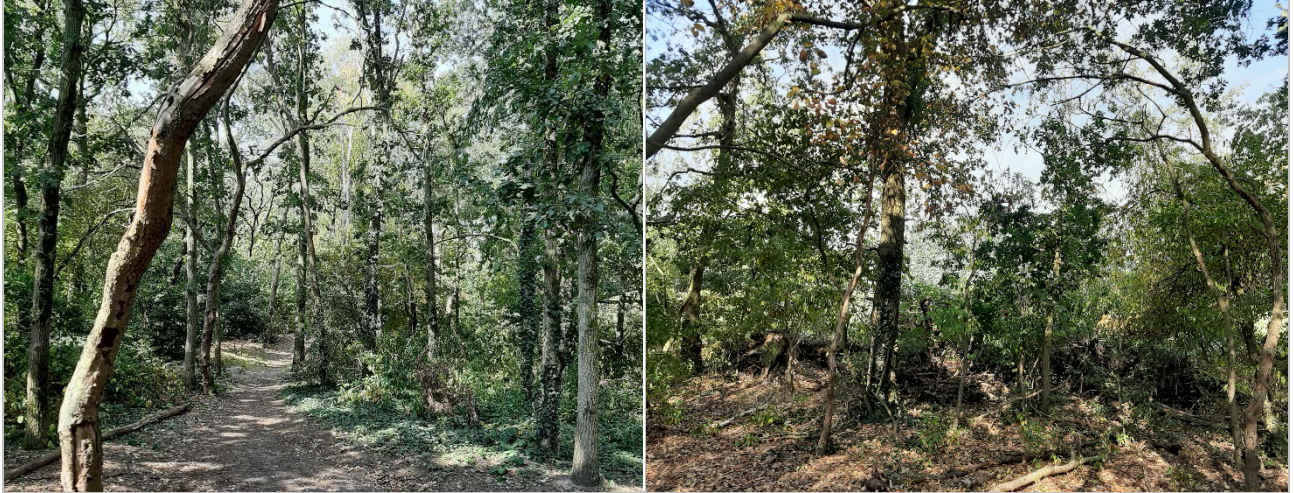
Figuur 3-4. Impressie van de bosschage die ligt op de grens met het plangebied met links een foto van de bosschage aan de westkant en rechts een foto van de bosschage aan de noordkant van het plangebied (foto's: RHDHV).