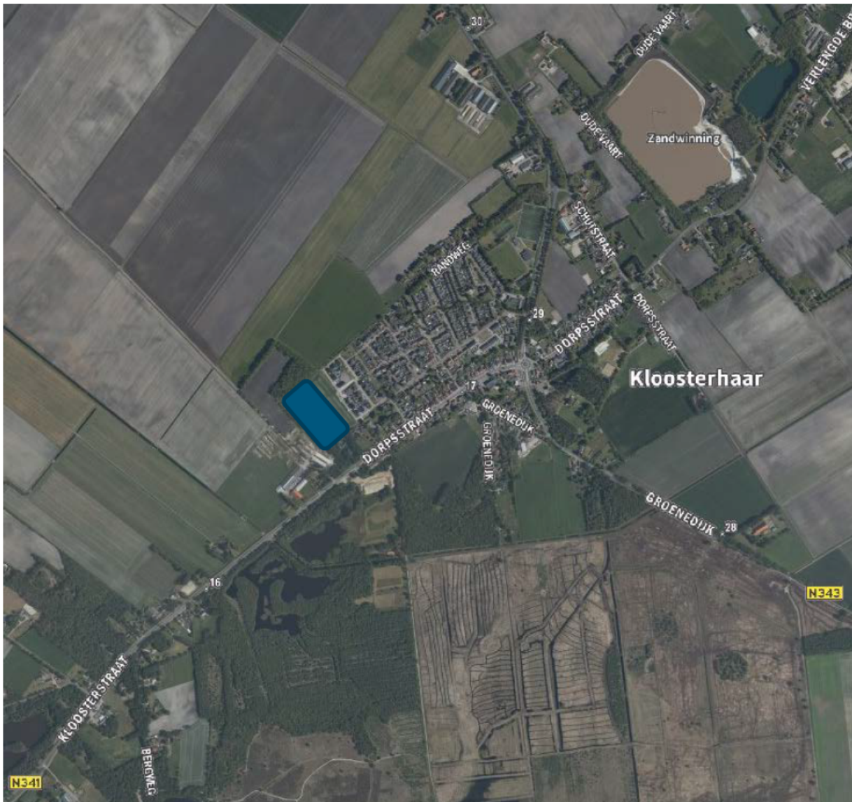
Figuur 3-1. Luchtfoto met de globale ligging van het plangebied (het blauwe vlak).

Het plangebied is gelegen aan de westkant van Kloosterhaar, aan de Meerstal (zie Figuur 3-1 en Figuur 3-2). Het plangebied bestaat uit landbouwgrond, waarop dit jaar graan is verbouwd (zie Figuur 3-3). Aan de noord- en westzijde grenst het plangebied aan een ondiepe, droog liggende watergang met daarachter een bosschage (met daarin veel Amerikaanse kers). In deze bosschage is sprake van veel menselijke verstoring, zo lopen er meerdere wandelpaden doorheen (zie Figuur 3-4). Voor het overige deel wordt het plangebied omgrensd door bebouwing. In de omgeving van het plangebied bevinden zich voornamelijk landbouwgrond. Op circa 115 meter ten zuiden van het plangebied bevindt zich het Natura 2000-gebied Engbertsdijkvenen (Zie Figuur 6-1, het effect hiervan zal worden toegelicht in §6.1).