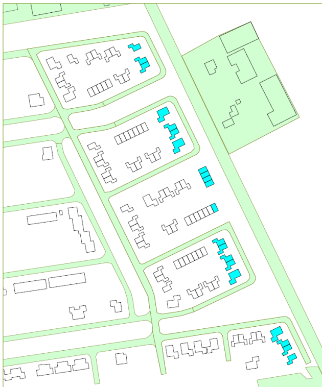
Figuur 4.1 Woningen met een maximale geluidsbelasting hoger dan de grenswaarde (lichtblauw)

De rekenresultaten zijn opgenomen in bijlage 2. Hieruit blijkt dat ter plaatse van de 21 te projecteren woningen die zich het dichtst bij de Stegerensallee bevinden de grenswaarde van de geluidsbelasting wordt overschreden. De betreffende woningen zijn weergegeven in figuur 4.1. Voor de overige woningen wordt voldaan aan de voorkeursgrenswaarde van 48 dB.