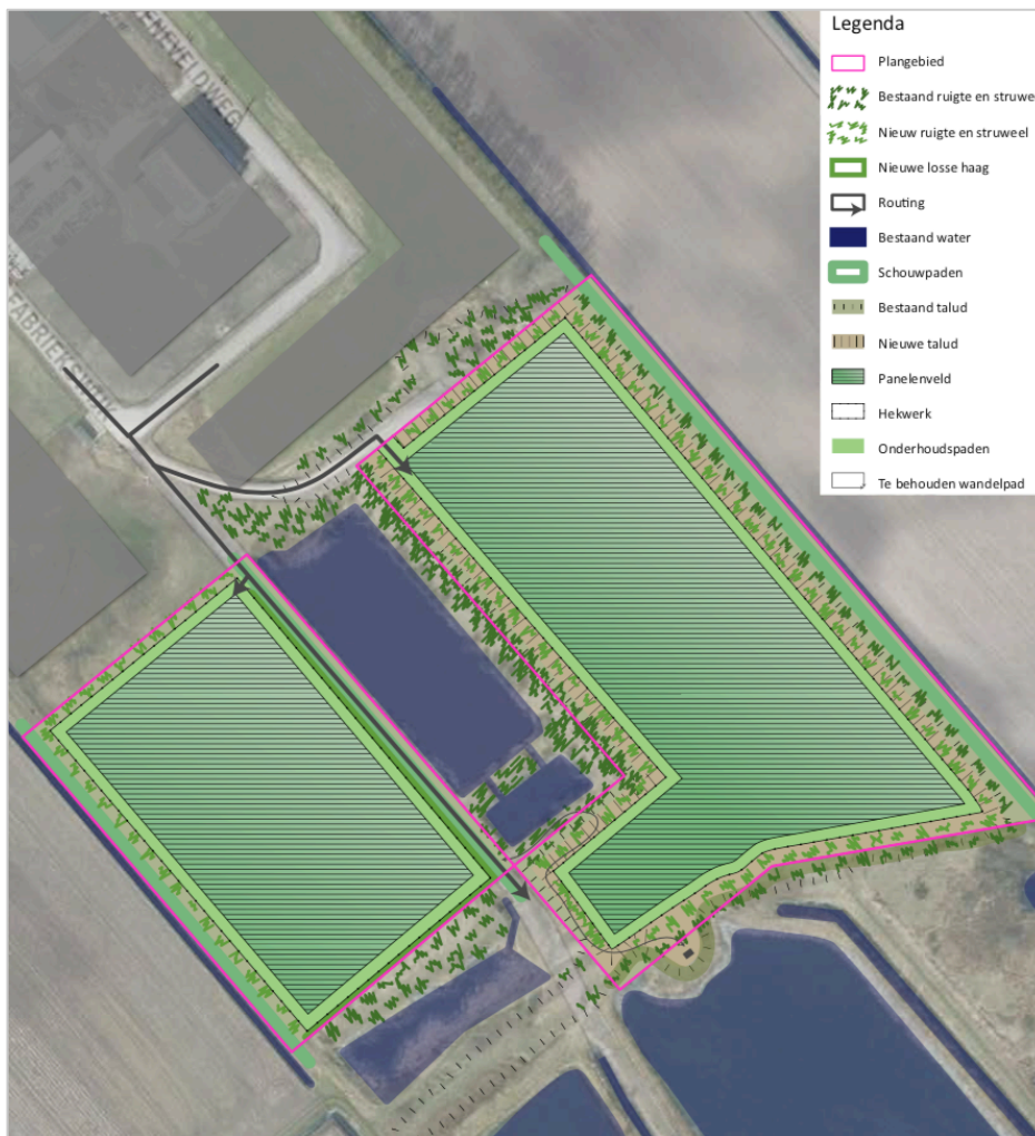
Afbeelding 3. Voorgenomen werkzaamheden. De toekomstige inrichting

Met de voorgenomen ontwikkelingen worden de percelen ingericht met zonnepanelen. Om het terrein wordt een hekwerk van ca. 2 meter geplaatst. Het hek wordt niet vastgezet, er blijft een opening aanwezig zodat kleinwild toegang blijft behouden tot de locatie. Het park wordt landschappelijk ingericht. De waterpartij en waterafvoersloten in de omgeving blijven behouden en blijven onaangeroerd. De uitvoering van de werkzaamheden zijn gepland na het verkrijgen van de benodigde vergunningen, mogelijk vind de aanleg plaats medio 2020-2021.