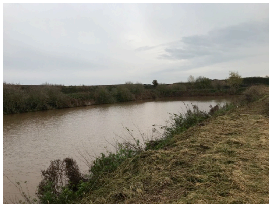
Waterpartij gelegen tussen beide planlocaties hoog en laag