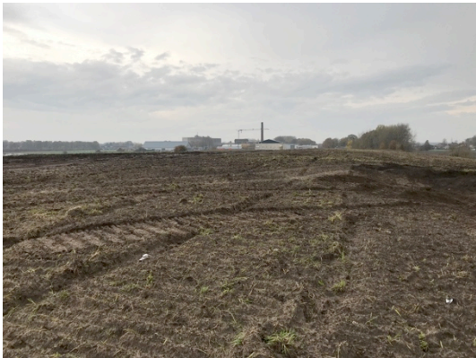
1. Plan locatie huidig gronddepot (hoog)