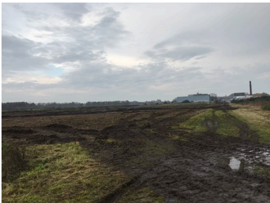
2. Deel planlocatie (laag)