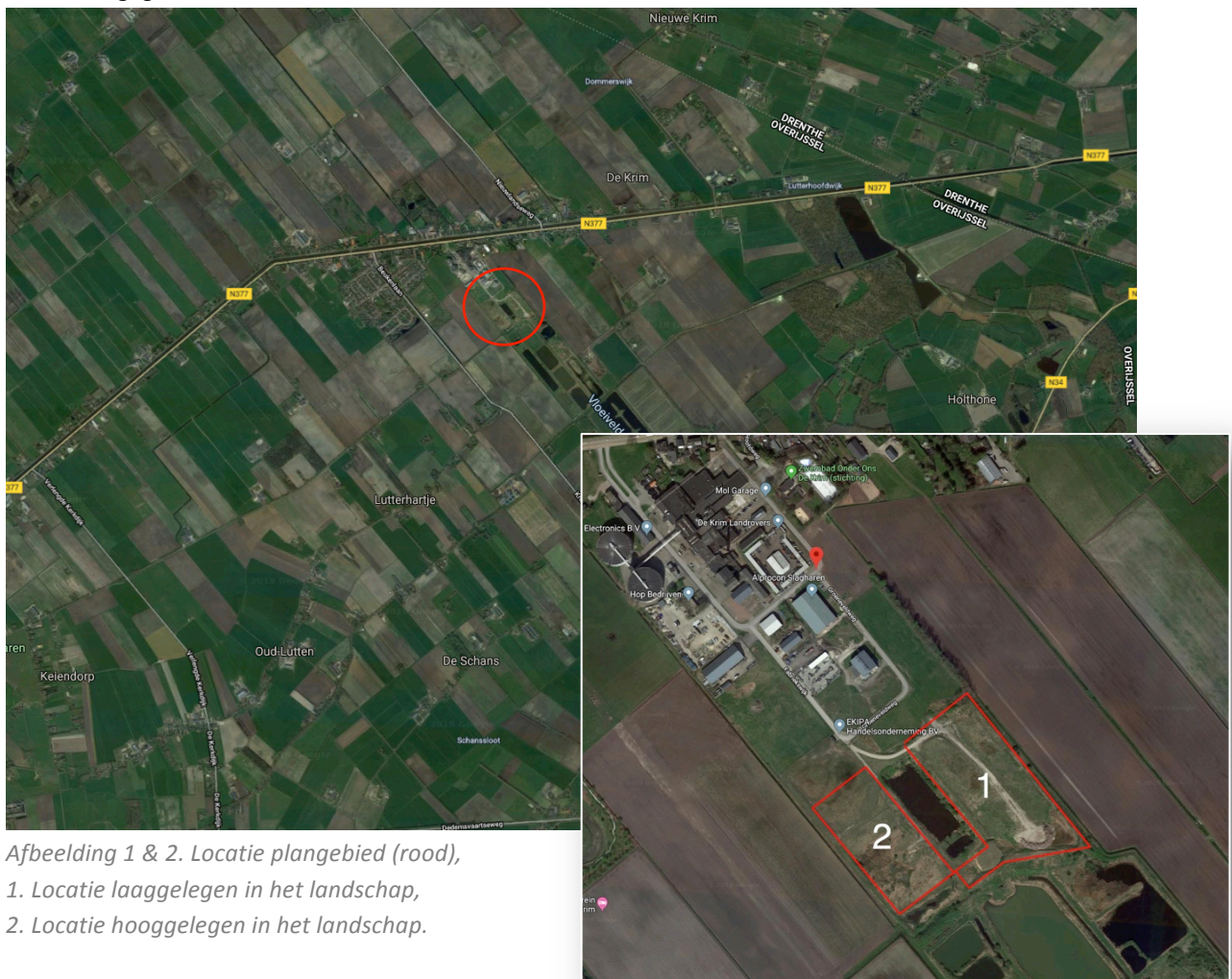
Afbeelding 1 & 2. Locatie plangebied (rood), 1. Locatie laaggelegen in het landschap, 2. Locatie hooggelegen in het landschap.

Het plangebied betreft een gronddepot. Een deel van het perceel ligt verhoogd in het landschap. Te midden van de planlocatie ligt een waterbassin. Op de onderstaande afbeelding wordt de planlocatie met een rode kleur weergegeven.