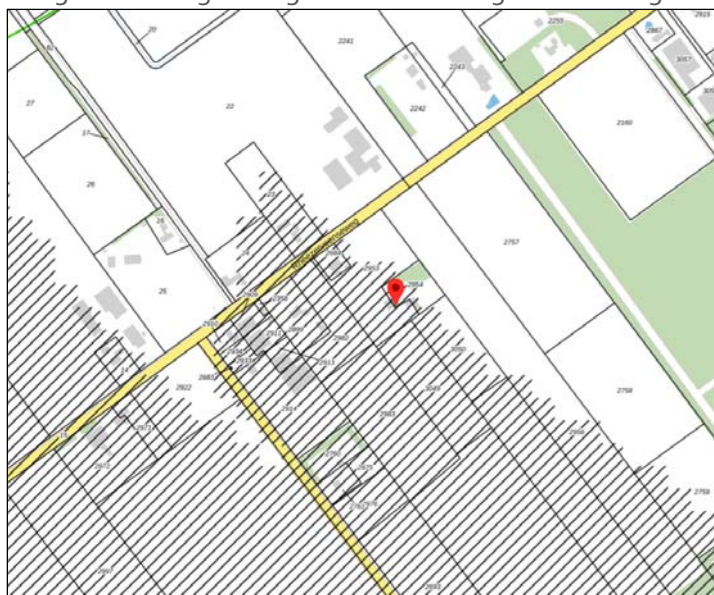
4. Lust- en leisurelaag: gearceerde gebied is gelegen in een donker gebied.

De kwaliteitsambitie is om de divers landschappen herkenbaar te houden ten opzichte van elkaar en verschillen en contrasten binnen deze landschappen te accentueren. De lijnen in lila weergegeven zijn onderdeel van het fietsroutenetwerk: IJssel Vecht. Het gearceerde gebied geeft aan dat dit gebied is aangewezen als kansrijk zoekgebied voor windenergie.