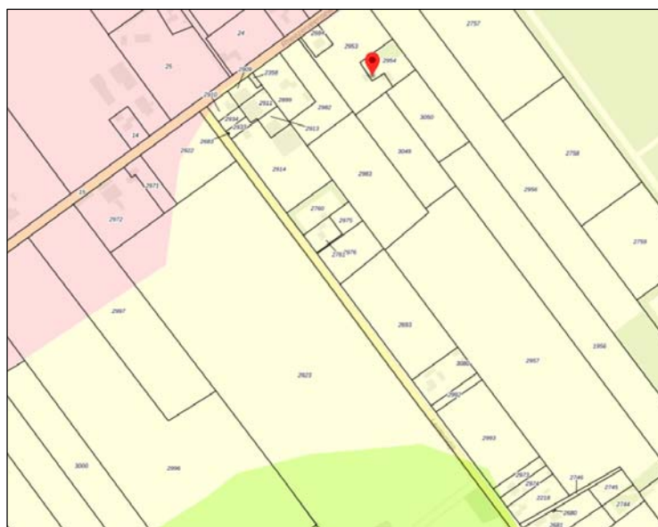
2. Laag van het agrarisch cultuurlandschap: jong heide- en broekontginningslandschap (lichtgroen), Hoogveenontginningen (roze), oude hoevenlandschap (groen).