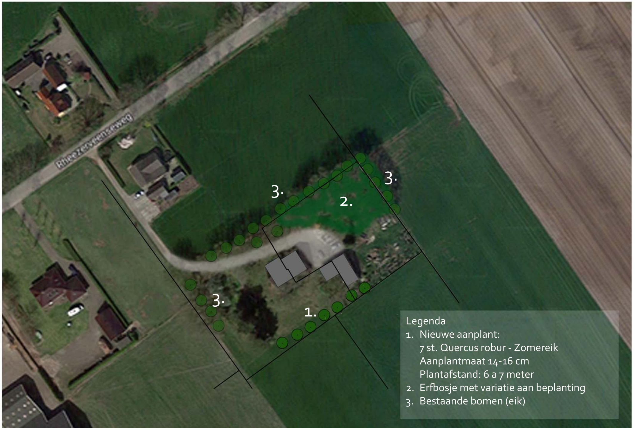
Ruimtelijk kwaliteitsplan Rheezerveenseweg 18 - 18i