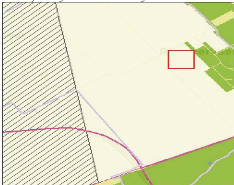
Ontwikkelingsperspectief: buitengebied accent productie: schoonheid van de moderne landbouw (lichtgroen) en kansrijk zoekgebied windenergie (arcering)