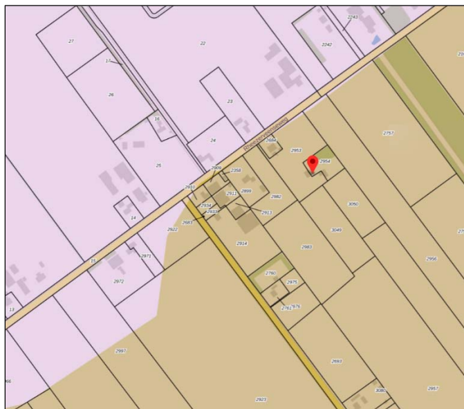
1. Natuurlijke laag: dekzandvlakte en ruggen (bruin) en hoogveengebieden in cultuur gebracht (paars).

Het landschap noordelijk van de Rheezerveenseweg is gelegen in het hoogveenontginningslandschap. Hier ligt ook het plangebied. Noordelijk van deze weg kent het landschap de karakteristiek van het jonge heide- en broekontginningslandschap.