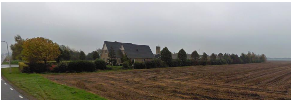
Figuur 1. huidige situatie

De initiatiefnemers hechten aan een goede landschappelijke inpassing van hun bedrijf. Getuige hiervan is de al aanwezige erfbeplanting rondom het bedrijf. Zie figuur 1