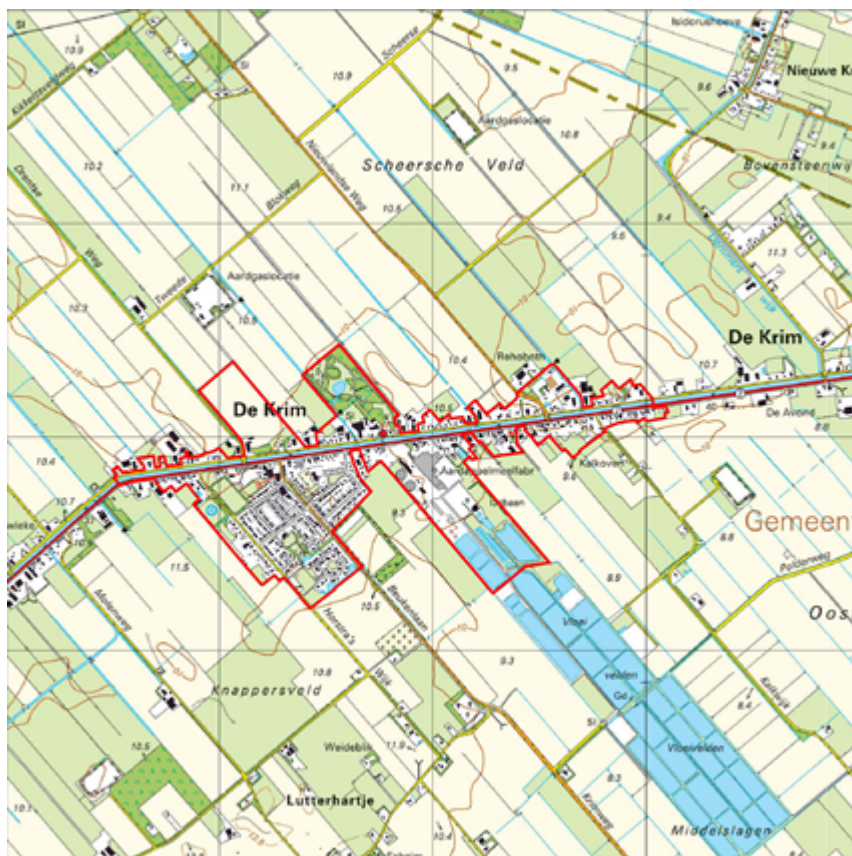
Gemeente Hardenberg